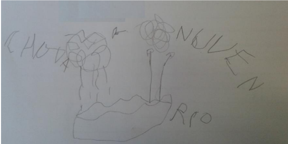
Figura 3 – Produção de estudante do 7º ano em atividade sobre o ciclo hidrológico