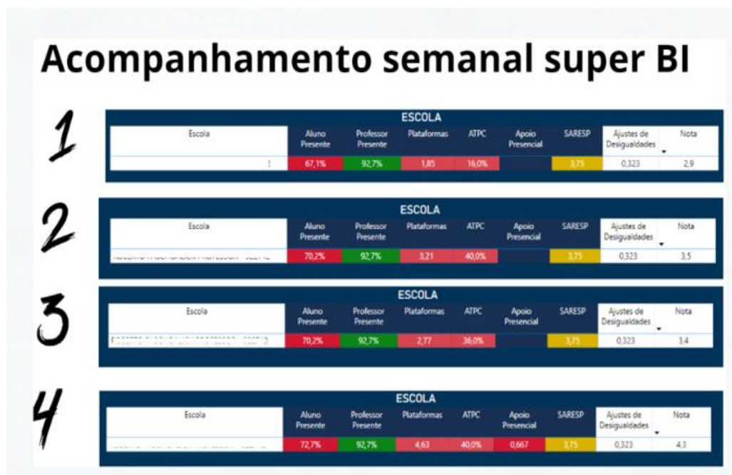
Figura 1 – Painel de acompanhamento semanal SuperBI (URE)

Nota: Preservo a origem dos dados das figuras (internos) e identificações por razões éticas, evitando exposição de unidades escolares, turmas e sujeitos.