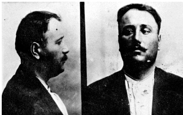
Ilustração 1 – Oreste Ristori.