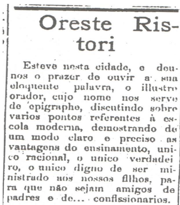
Ilustração 5 – Trecho do jornal Oreste Ristori