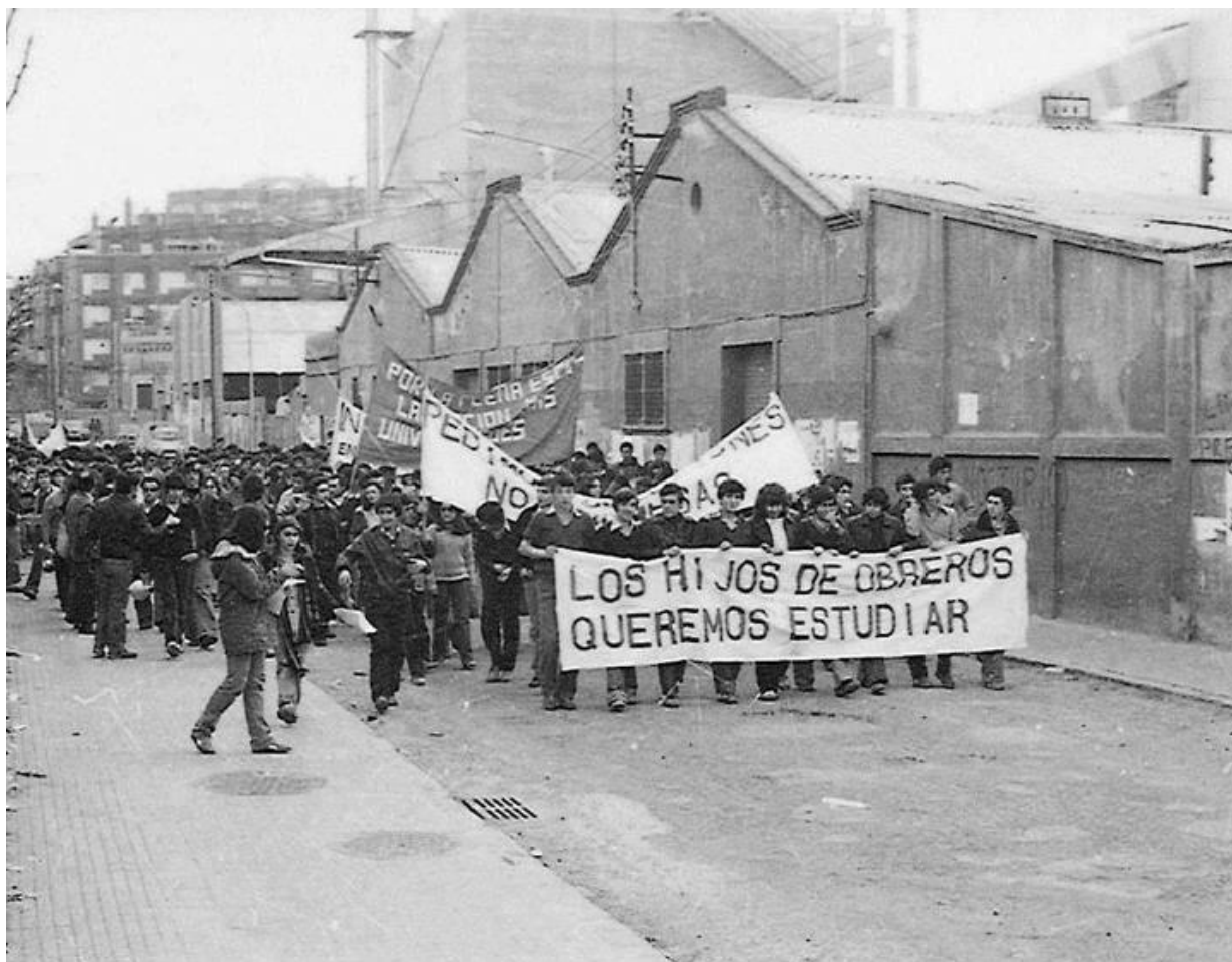
Ilustração 9 – Manifestação de operários no município de Cornellà de Llobregat, na província de Barcelona, Espanha nos anos 1970.