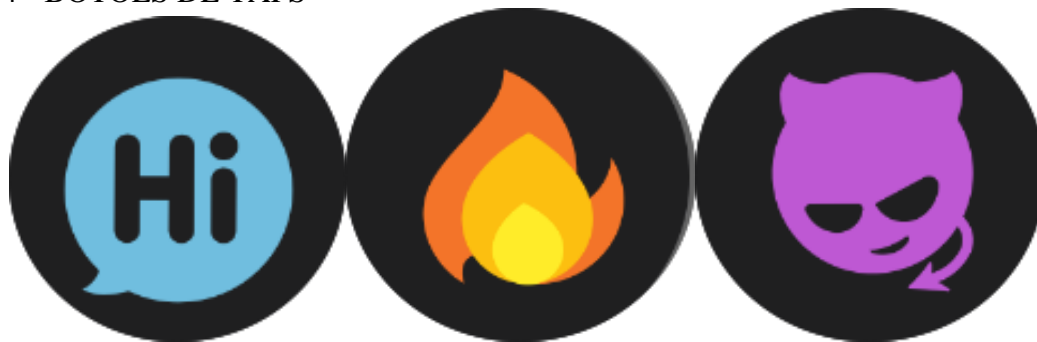
FIGURA 4 - BOTÕES DE TAPS