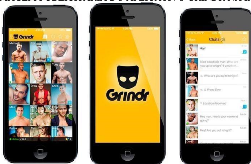
FIGURA 3 - IMAGEM PUBLICITÁRIA DO APLICATIVO GRINDR NA INTERNET.