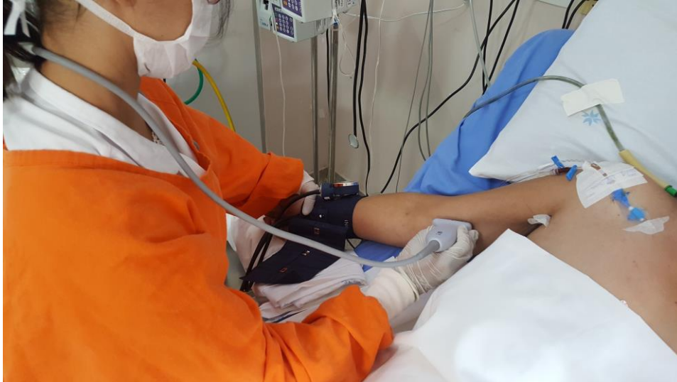
Figura 2: Demonstração da posição do probe do ultrassom.