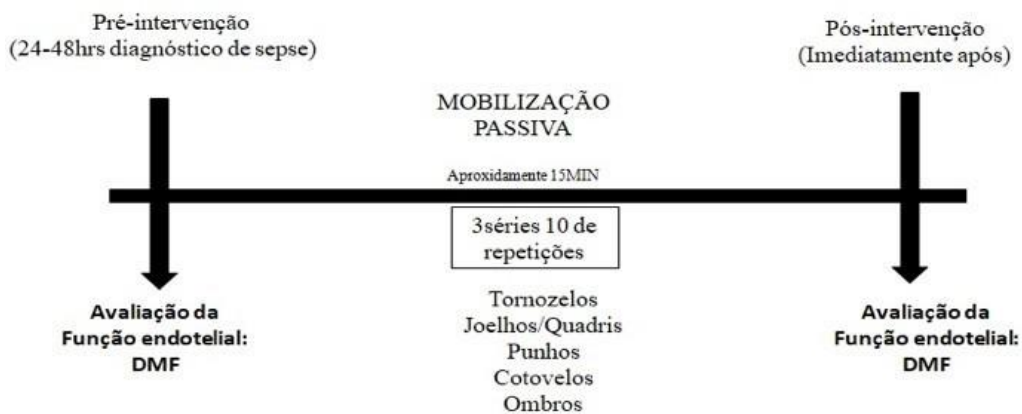
Figura 4: Resumo do procedimento experimental. DMF: dilatação mediada pelo fluxo. MP: mobilização passiva.

A figura 4 demonstra o resumo do procedimento experimental.