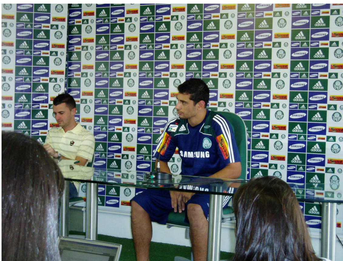
Ilustração 7 61