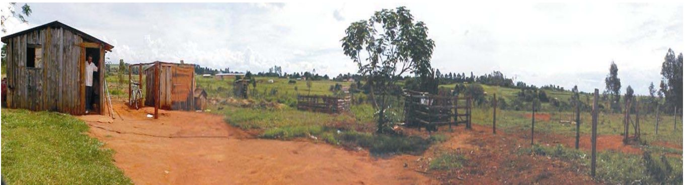
Condições das Habitações do Assentamento Pirituba II, antes das construções das casas do InovaRural

Relacionado aos problemas de infra-estrutura ligados a moradia, havia um abaixo-assinado, com 50 nomes das famílias assentadas, encaminhado para o Itesp (Instituto de Terras do Estado de São Paulo), requisitando a construção de habitações.