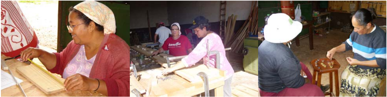
Marceneiras trabalhando e realizando a divisão dos ganhos da marcenaria