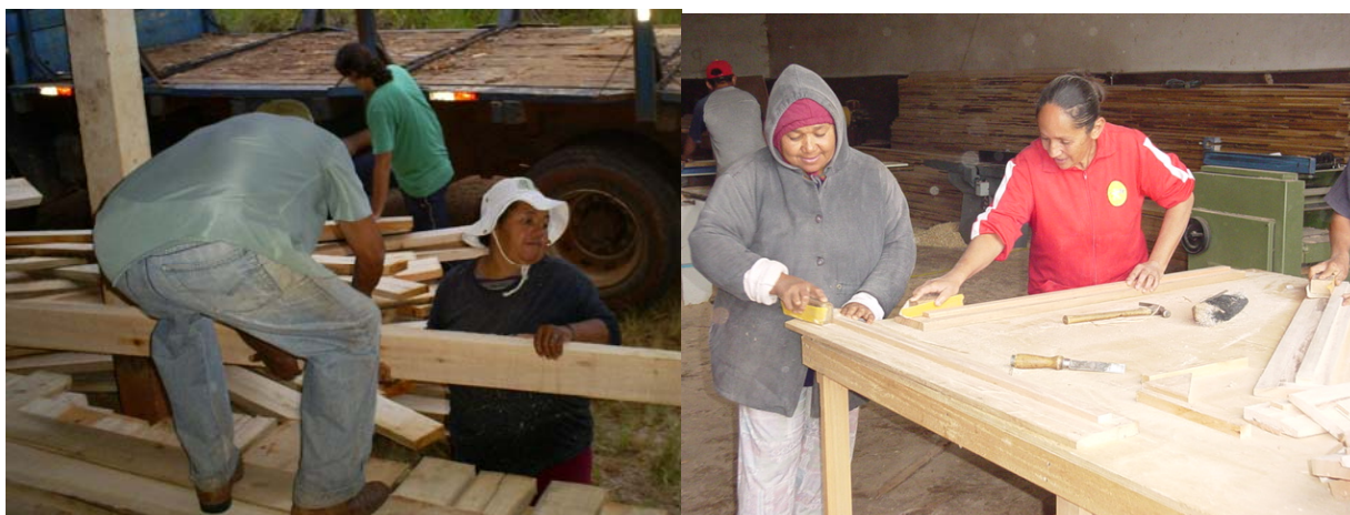
Marceneiras trabalhando: descarregando madeira, lixando peças.