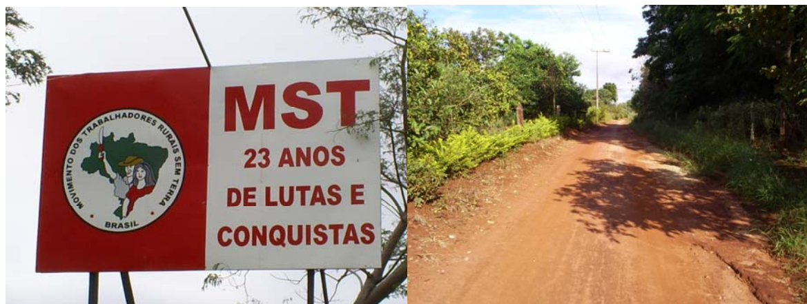
Placa do aniversário de 23 anos do assentamento Pirituba II e ruas do assentamento.