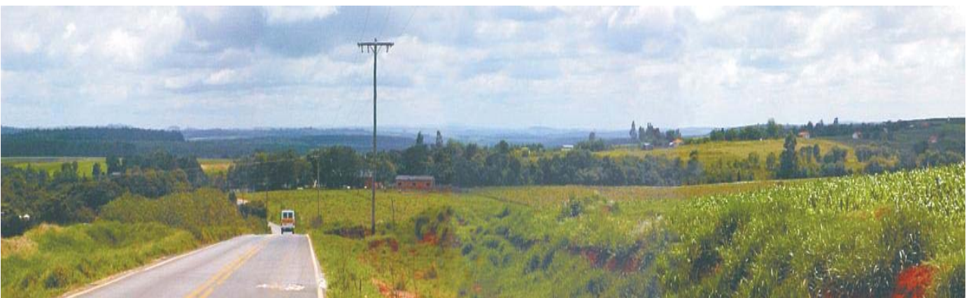
Panorâmica do Assentamento Pirituba II

As fotos que seguem ampliam a nossa compreensão sobre o assentamento, bem como em torno das condições de moradias das famílias envolvidas no projeto InovaRural.