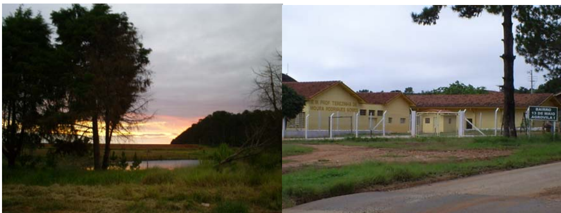
O assentamento Pirituba II, estrada que passa pelo assentamento e escola – Agrovila I.