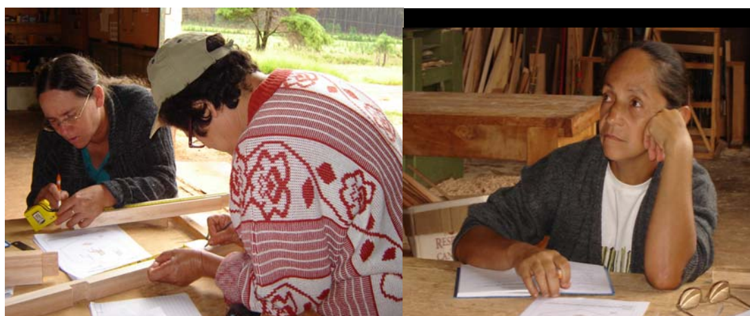
As Marceneiras trabalhando 66 .