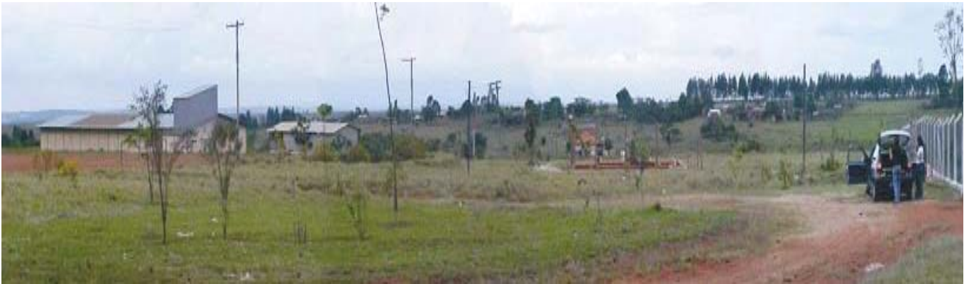
Panorâmica do Assentamento Pirituba II – Fotografia de Ivan do Valle