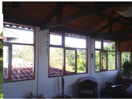
Sistema de cobertura feito na marcenaria, casa de uma das marceneiras com esquadrias feitas na marcenaria, janelas fabricadas na Madeirarte

Apresentado o contexto da pesquisa, bem como a formação da Madeirarte assumida pelas mulheres marceneiras, faz-se necessário discorrer sobre o meu encontro com este grupo e com os temas e teorias que fundamentam esta investigação.