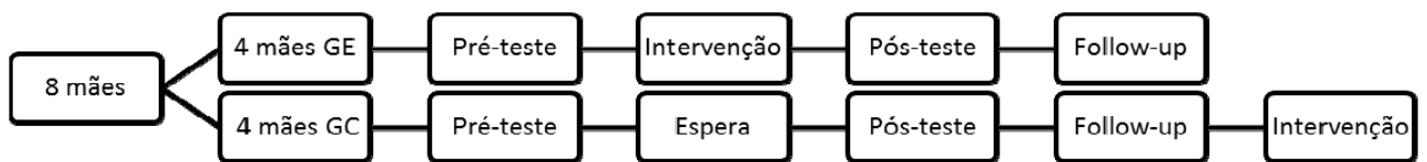
Figura 4. Diagrama do Delineamento da Pesquisa

A Figura 4 apresenta um diagrama ilustrativo do delineamento da pesquisa.