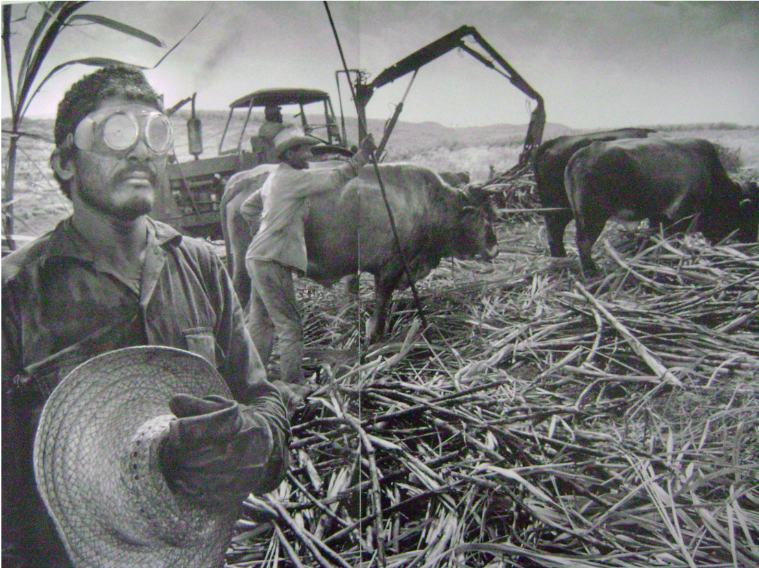
Sebastião Salgado (1993)