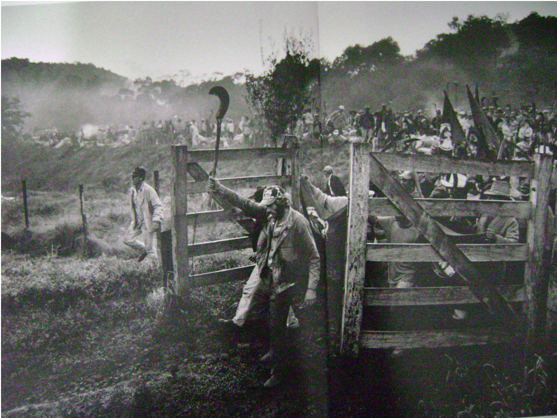
Sebastião Salgado (2000)