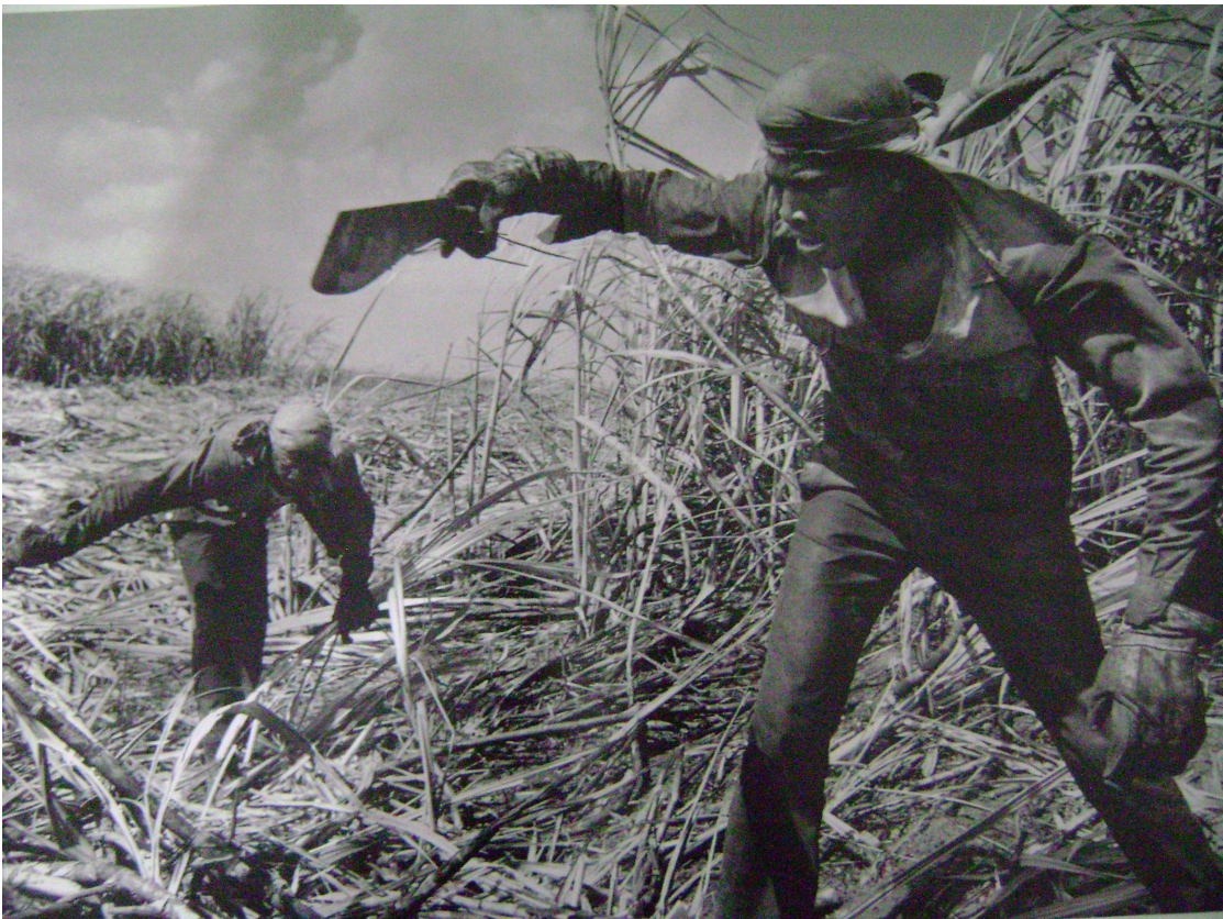
Sebastião Salgado (1993)