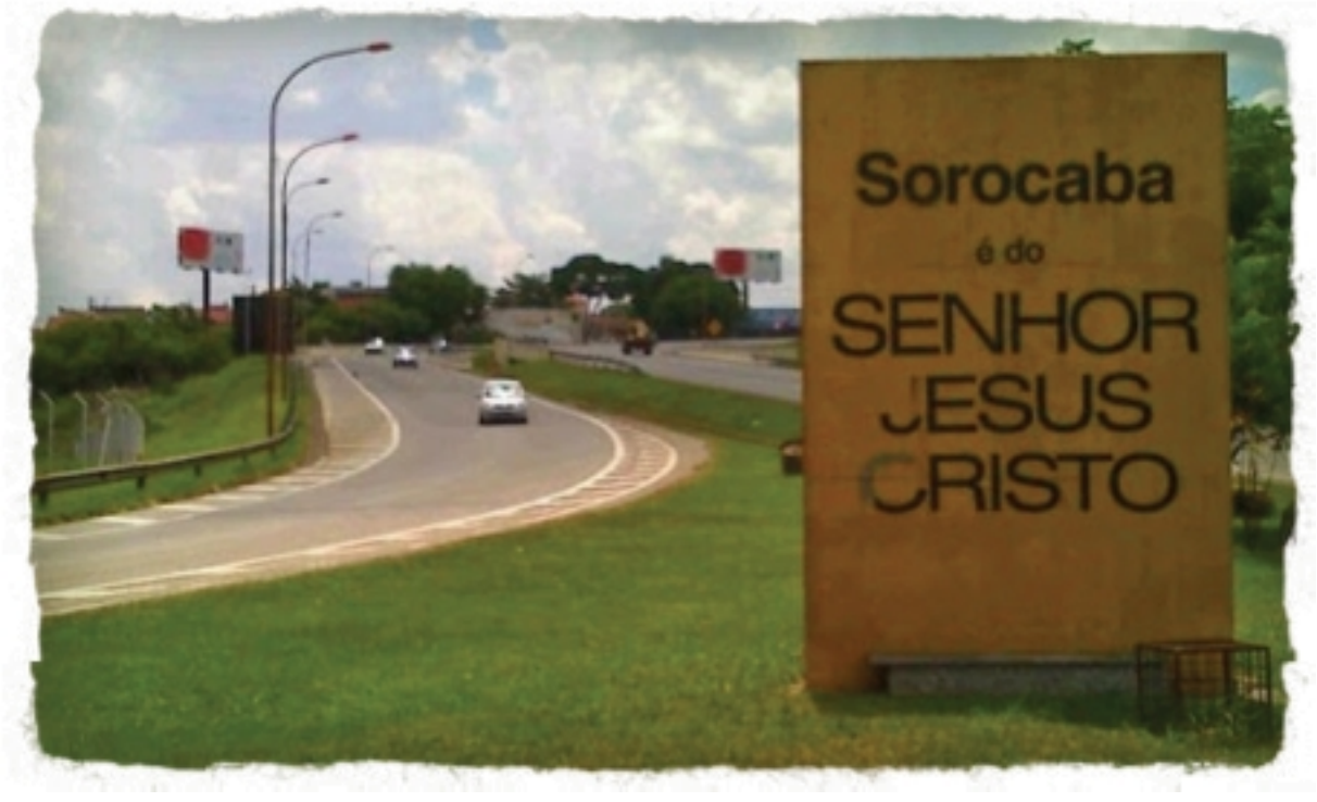
(Imagem 04 - Totem na entrada da cidade de Sorocaba)

Como um ato de resistência contra este totem na entrada da cidade, diversos grupos sociais realizam intervenções artísticas (BOCCA; SOUZA, 2009), não apenas (re)significando-o, mas também fomentando um debate na sociedade sorocabana perante a laicidade do Estado.