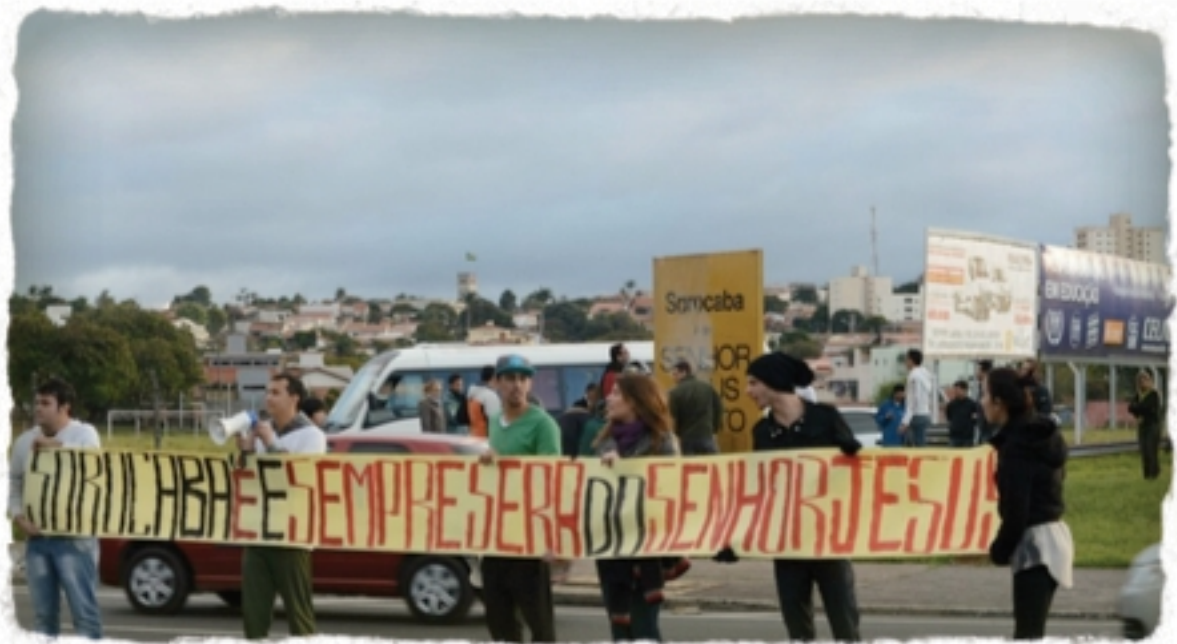
(Imagem 06 - Religiosos limpando o totem e se manifestando contra as intervenções)

Sempre que ocorre algum tipo de intervenção artística no totem, também há um discurso conservador por parte da mídia local, políticos de partidos específicos, religiosos e setores da sociedade em manifestações favoráveis à sua originalidade.