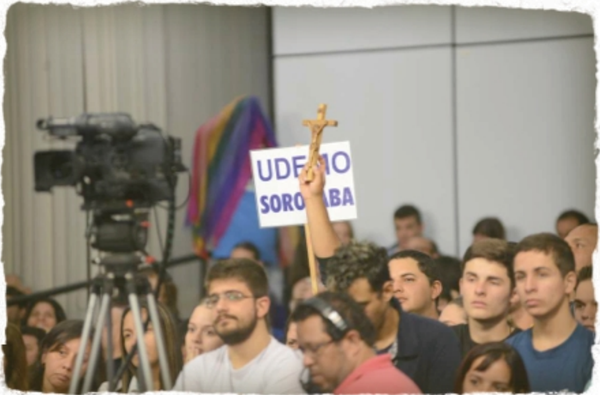
(Imagem 07 21 - Votação sobre a manutenção/exclusão de Gêneros e Sexualidades no PME)