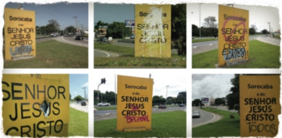
(Imagem 05 - Intervenções artísticas no totem)

Sempre que ocorre algum tipo de intervenção artística no totem, também há um discurso conservador por parte da mídia local, políticos de partidos específicos, religiosos e setores da sociedade em manifestações favoráveis à sua originalidade.