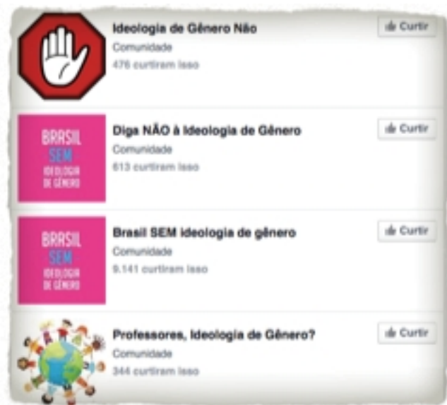
(Imagem 03 - Páginas de Facebook sobre Ideologia de Gênero)

As sessões nas Câmaras Municipais e Estaduais que debatiam os planos eram marcadas por grandes polêmicas e intensas manifestações, tanto da parte de grupos contrários quanto da parte de grupos favoráveis às questões de gêneros e sexualidades.