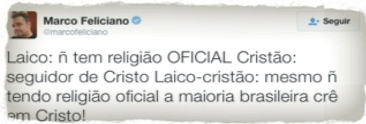
(Imagem 01 - Twitter do Deputado Federal Marco Feliciano)

A ausência de entendimento da diferença entre estado laico e influência cristã faz com que Deputados Federais com influências religiosas tenham a liberdade de afirmar, como fez Marco Feliciano em seu Twitter no dia 12 de julho de 2012: