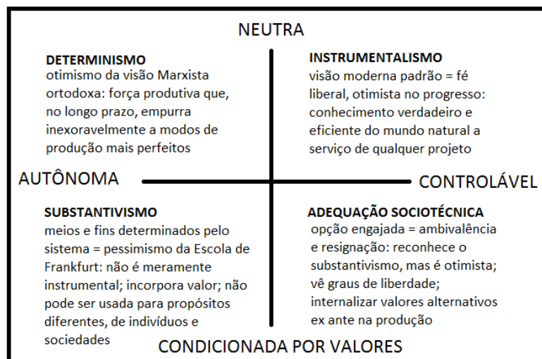
Figura 3 - As quatro concepções sobre a Tecnociência