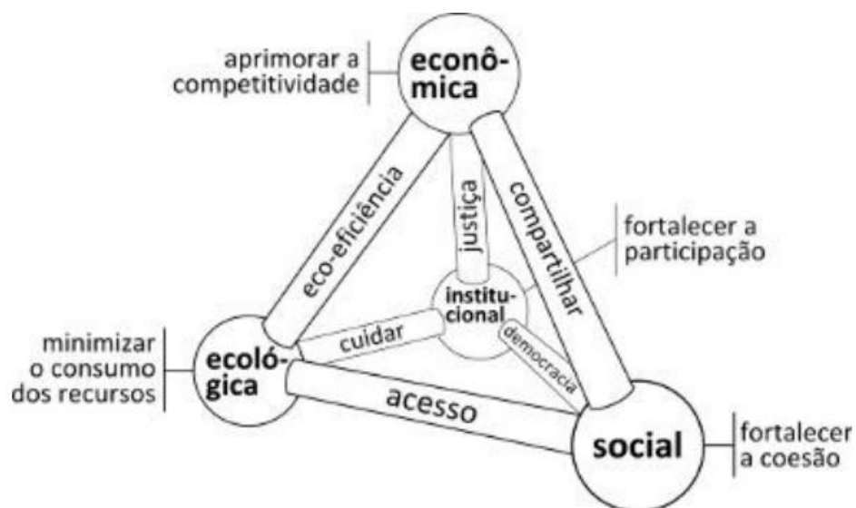
Figura 2 - Prisma da Sustentabilidade