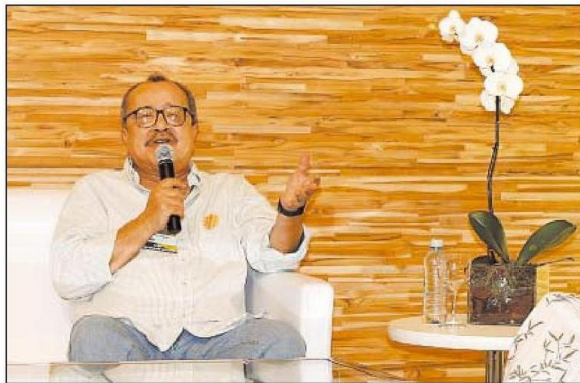
O ESCRITOR João Ubaldo: "Ouso dizer que somos um povo deprimido. Não falo só da classe média"