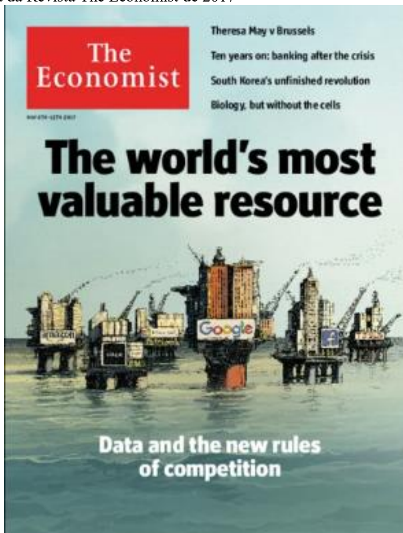
Figura 1 – Capa da Revista The Economist de 2017