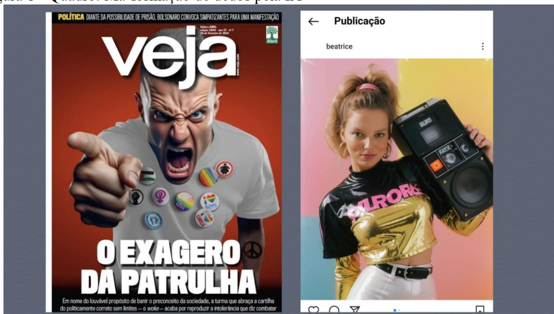
Figura 6 - Quadro: Má-formação de dedos pela IA