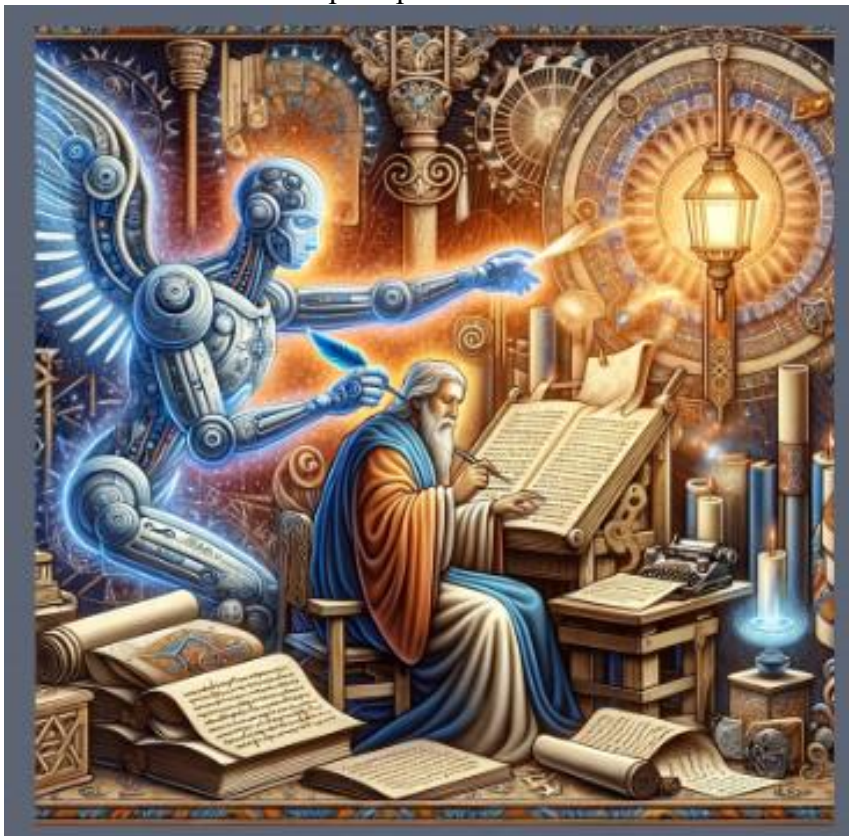
Figura 4 - Quadro: “A Arte do Pensar” prompts de Ana Mahle