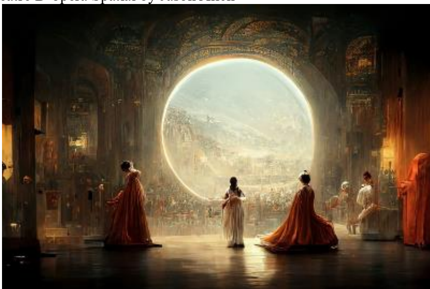
Figura 5 - Théâtre D'opéra Spatial by Jason Allen

A imagem abaixo, ganhou um prêmio por ficar em primeira colocada na categoria de arte digital na Feira Estadual do Colorado.