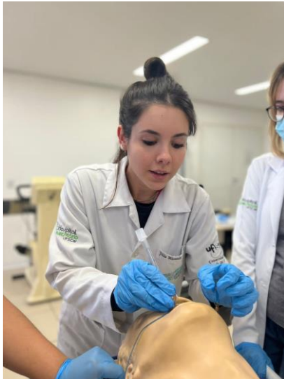
Imagem 7 - Atividade da oficina de intubação orotraqueal, em 7 de junho de 2023