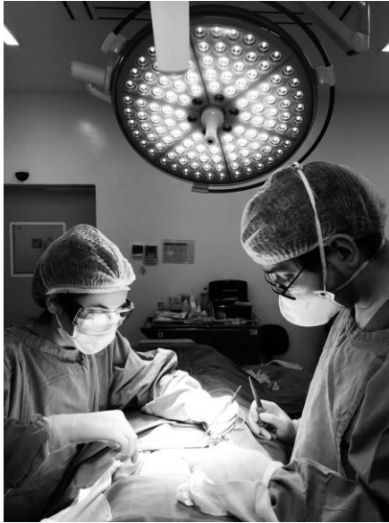
Imagem 9 - Eu e um dos médicos cirurgiões preceptores do HU-UFSCar, durante procedimento cirúrgico para correção de hérnia de parede abdominal, em 17 de agosto de 2023