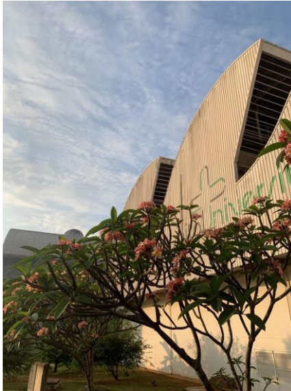
Imagem 12 - A beleza das flores e da fachada do HU-UFSCar capturada ao final de uma tarde de céu azul, após um dia de atividades no estágio da Clínica Médica do 5º ano