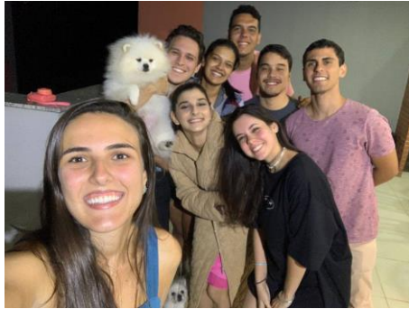
Imagens 13, 14, 15 e 16 – Registros de algumas de nossas reuniões da MedCélula