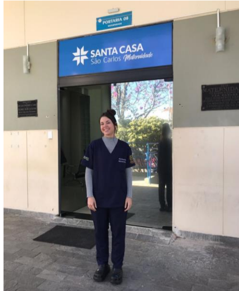
Imagem 8 - Eu em meu primeiro dia como interna, em 12 de junho de 2023