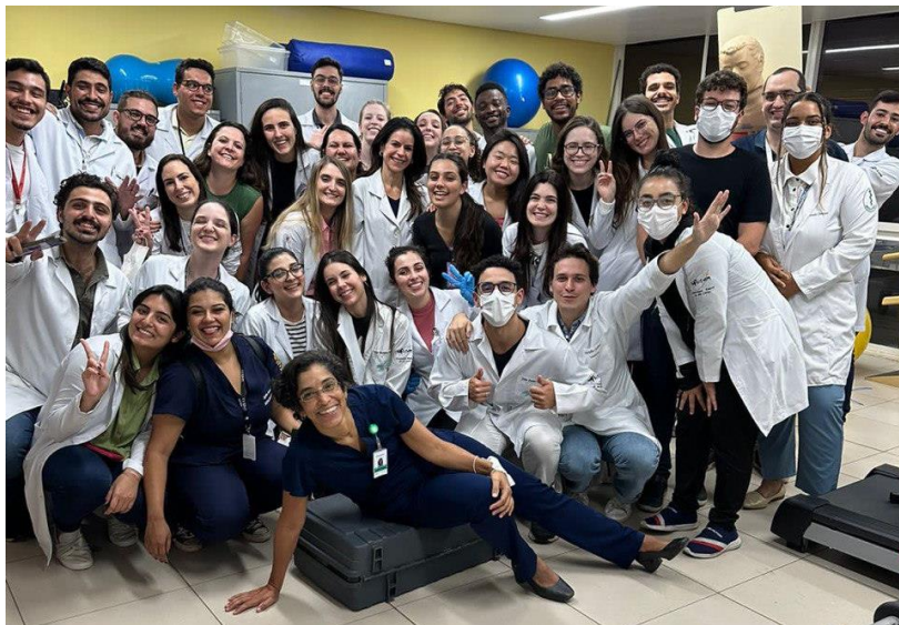
Imagem 6 - Registro ao final de um dia de oficinas de procedimentos em nossa semana pré-internato, no dia 7 de junho de 2023, no Hospital Universitário da Universidade Federal de São Carlos (HU-UFSCar)

Em 2019, o internato parecia muito distante, mas bastou um piscar de olhos, e ele chegou. Era junho de 2023, e lá estava eu empolgada para iniciar essa fase tão singular em nossa carreira médica.