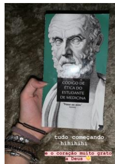
Imagem 4 - Foto de 11 de março de 2019

Tivemos uma semana de apresentações, muitas atividades e dinâmicas diferentes. E em uma das atividades dessa semana, recebemos um livrinho: o Código de Ética do Estudante de Medicina. Como era incrível ver que realmente estava tudo começando.