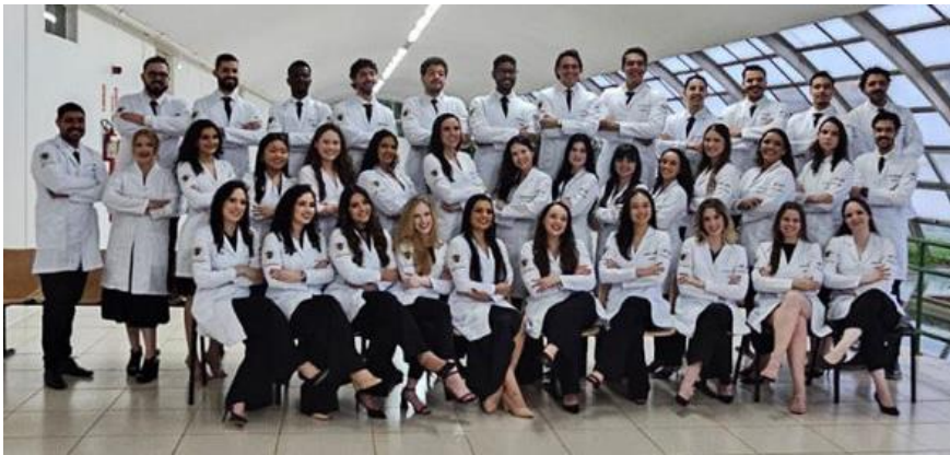
Imagem 18 - Turma XIV do curso de Medicina da Universidade Federal de São Carlos

A graduação, uma etapa tão fascinante da vida que Deus me permitiu viver, está chegando ao fim. Meu coração se enche de alegria por tudo que pude aprender, por ter podido provar de Seu carinho em cada um dos detalhes até aqui.