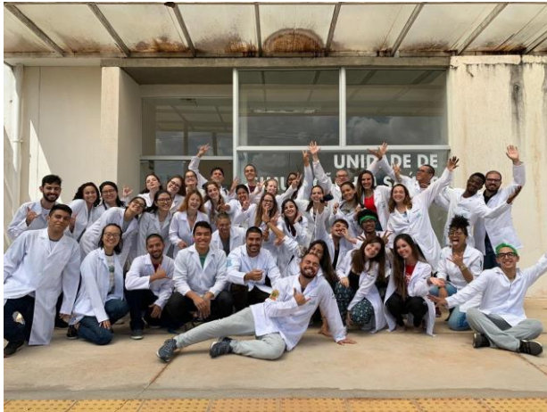
Imagem 5 - Eu e minha turma no dia em que fomos conhecer a Unidade de Simulação em Saúde (USS) da UFSCar, em 20 de março de 2019