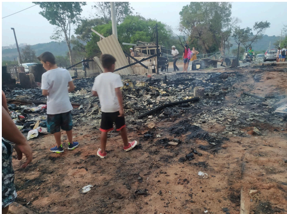
Figura 6 - Área do incêndio que acometeu a Cozinha Solidária do MTST, outubro de 2024.