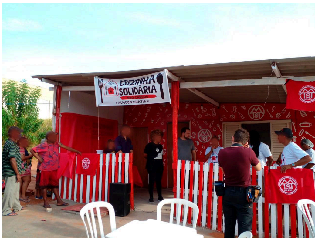
Figura 5 - Inauguração da Cozinha Solidária do MTST na OEBUS. Fonte: Acervo de Natália Salim, cedido à autora, junho de 2022.