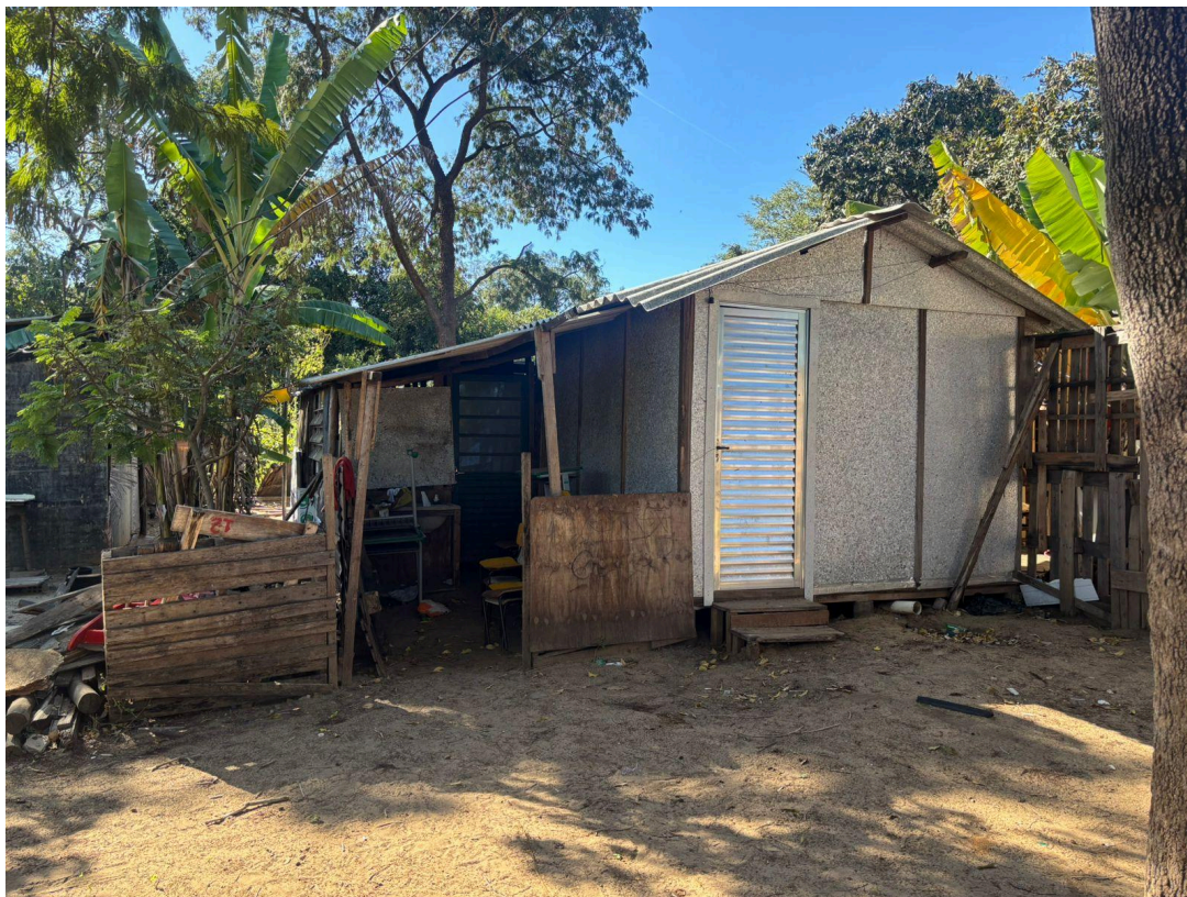
Figura 4 – Cozinha comunitária da OEBUM, junho de 2025.