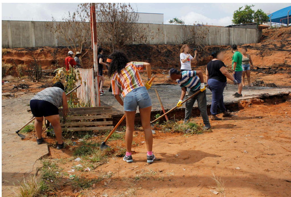
Figura 8 - Moradores e voluntários em mutirão de limpeza e reconstrução da área acometida pelo incêndio.