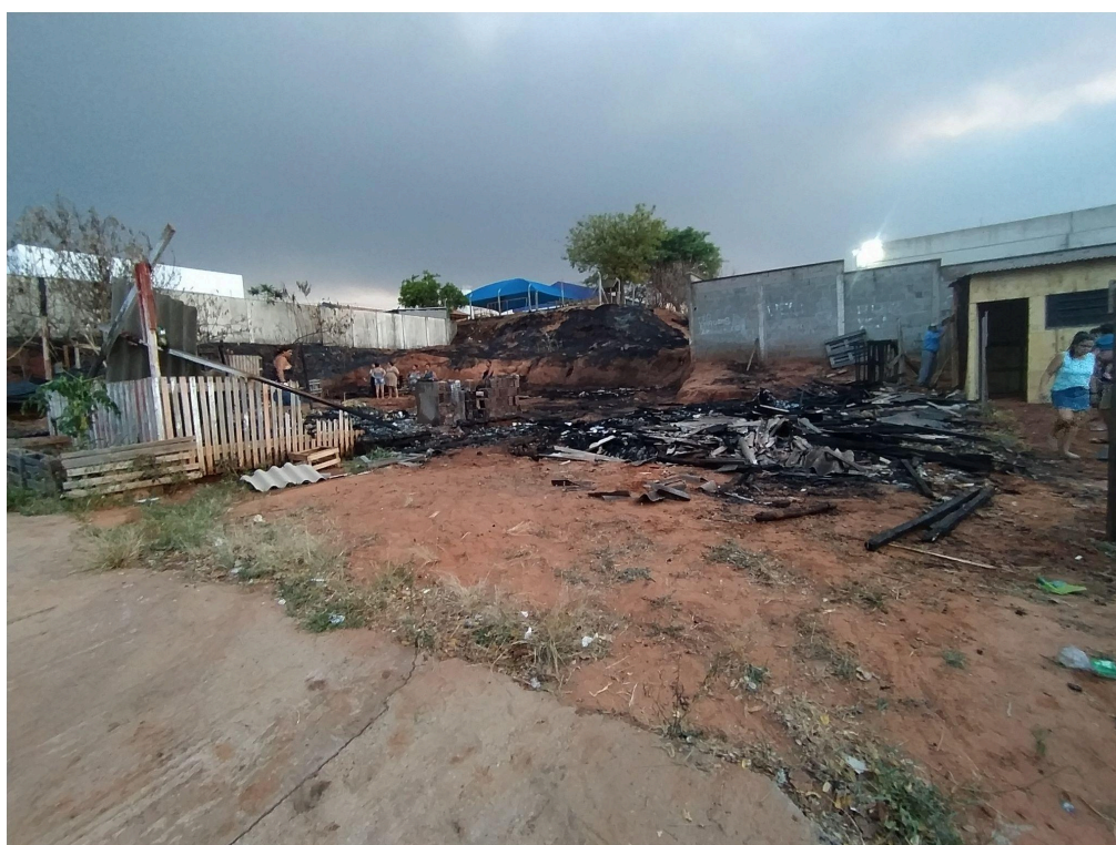
Figura 7 - Área do incêndio que acometeu a Cozinha Solidária do MTST, outubro de 2024.

O episódio ocorreu apenas dois dias após a eleição de Fernanda Castellano (PSOL), como vereadora de São Carlos, candidatura que contou com apoio ativo de Jéssica e Patrícia,