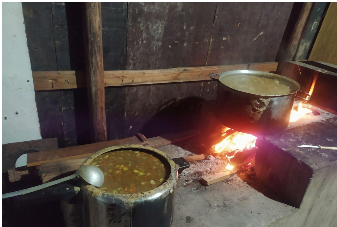
Figura 2 – Feitio da sopa na cozinha comunitária da OEBUM. Fonte: Acervo pessoal, julho de 2024.

A OEBUM fica em um terreno de terra nas extremidades de um pasto, uma das vias de acesso ao bairro Antenor Garcia. Por estar localizada na Bacia hidrográfica do Córrego Quente, o solo é arenoso, úmido e instável para habitação. Os caminhos entre os barracos pareciam pequenos labirintos: algumas vielas, outras ruas curtas de terra, quase sempre marcadas por um fio de água escorrendo pelo centro. Os barracos são muito próximos entre si, construídos com tapumes, placas, vigas de madeira, telhas de tetra pack e todo tipo de quinquilharia.