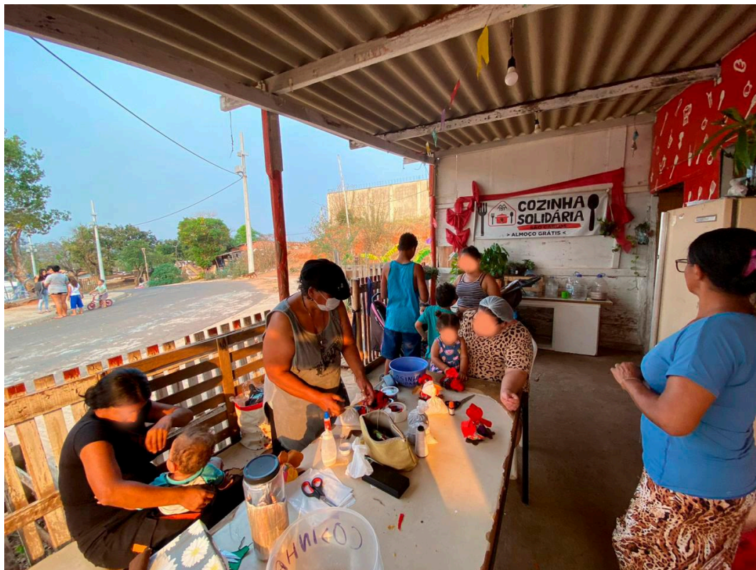
Figura 3 - Roda de conversa com mulheres da OEBUS, realizada na Cozinha Solidária.

A OEBUS, em contraste com a OEBUM, está localizada em uma área asfaltada e conta com uma disposição territorial mais ampla. A distância entre os barracos é maior, e há lotes vazios. Essa configuração física influenciou também a forma como me movimentei por lá: por ser mais espaçada, a Cozinha Solidária da OEBUS não estava tão integrada ao restante dos barracos, o que fez com que eu permanecesse mais nesse espaço. Já a OEBUM, mais “apertada”, me proporcionou um contato mais direto com o cotidiano da ocupação como um todo, embora meus vínculos mais duradouros tenham se estabelecido na OEBUS.