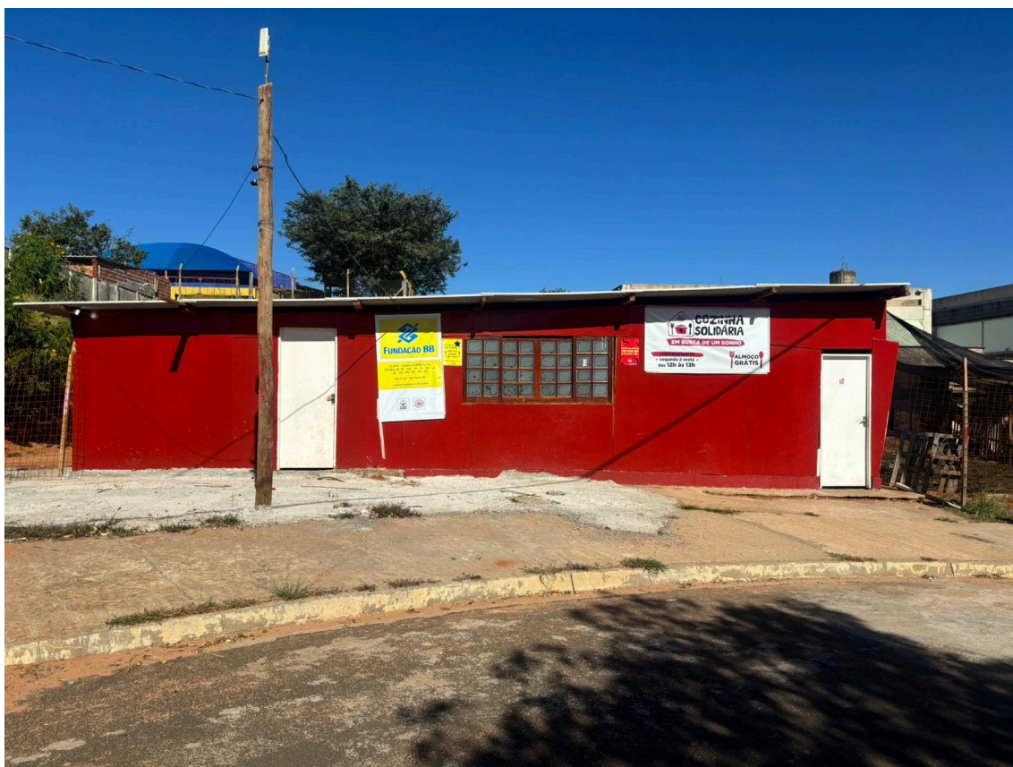
Figura 10 - Cozinha Solidária do MTST na OEBUS após a reconstrução, junho de 2025.

Cinco meses depois, em março de 2025, a cozinha foi reinaugurada. A reconstrução contou com a articulação do MTST, apoio de entidades estudantis da UFSCar e USP, de ocupantes e voluntários. O retorno da Cozinha Solidária não se restabeleceu apenas materialmente, mas também como representação de um trabalho de várias mãos que reconstituiu o coração da luta.