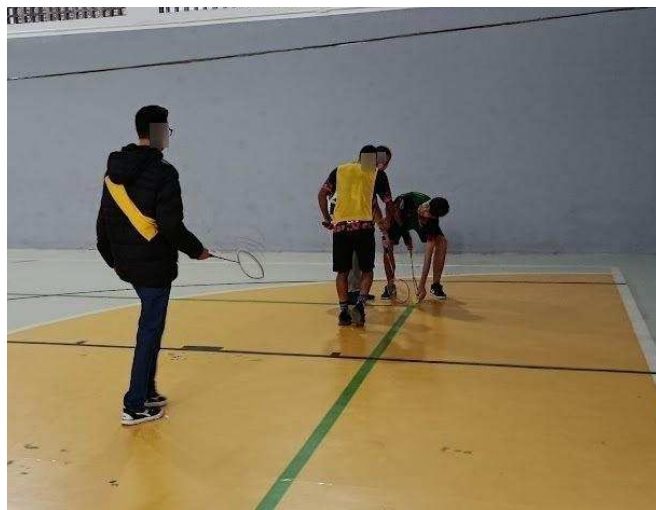
Figura 1: Situação-problema gerado no decorrer do jogo.

No decorrer dessa pesquisa, a partir das vivências das práticas corporais algumas situações-problema aconteceram, principalmente até as primeiras duas modalidades. Após a apropriação da turma a respeito da Metodologia Callejera e através dos seus momentos dialógicos, a quantidade de situações-problema foram diminuídas.