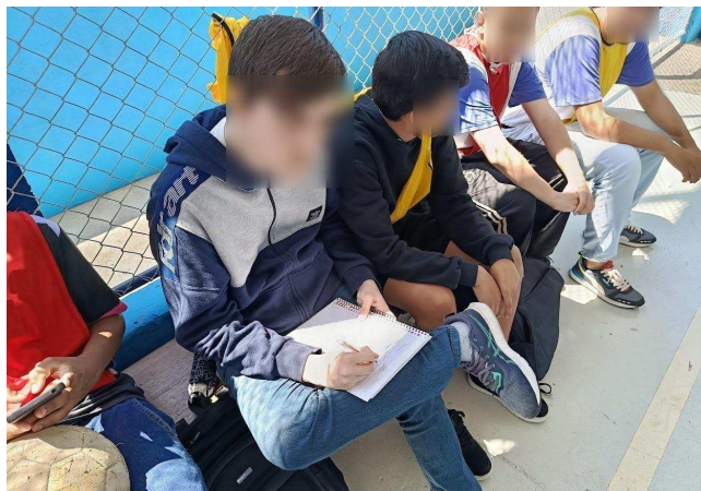
Figura 6: Alunos anotando os scouts do jogo