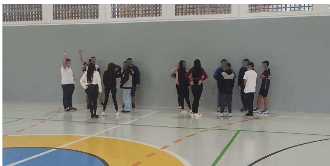
Figura 11: Diálogo entre as equipes