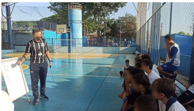
Figura 7: Apresentação dos princípios da competição.

Encerramos essa etapa na aula com alguns alunos ainda murmurando que “perderam tempo” com a eleição. Expliquei novamente que aquele processo não era perda de tempo, mas sim parte essencial da aula de Educação Física e da construção de uma nova competição. Reforcei que a partir da próxima aula dividiríamos as equipes e começaríamos a planejar as regras, sendo que se o tempo permitisse poderíamos escolher as práticas corporais da competição. Apesar das reclamações, percebi que alguns alunos estavam visivelmente animados, principalmente os que foram eleitos como mediadores/as, enquanto outros ficaram irritados por não terem atividade prática nesse dia.