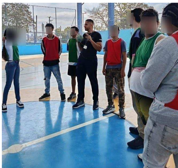
Figura 16: Diálogo no primeiro-tempo da Queimada.