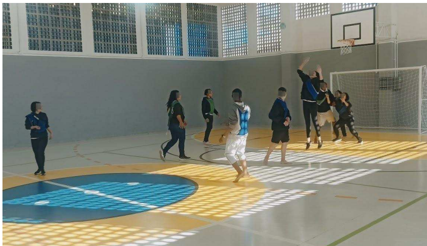
Figura 14: Vivência do Tapembol utilizando a metodologia Callejera.

chamaram atenção no decorrer do mini-torneio. Me despedi da turma dizendo para virem preparados para tentarmos começar a competição na próxima aula.