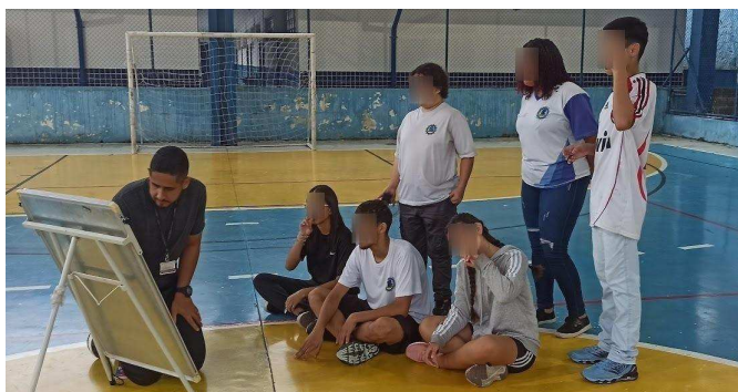
Figura 10: Etapa de filiação com os/as mediadores/as.

A turma saiu da aula dividida entre a animação pela competição e as resistências típicas de quem ainda vê o esporte apenas pela ótica da performance. Para mim, ficou evidente o quanto ainda precisaremos insistir na dialogicidade como pilar desse processo.