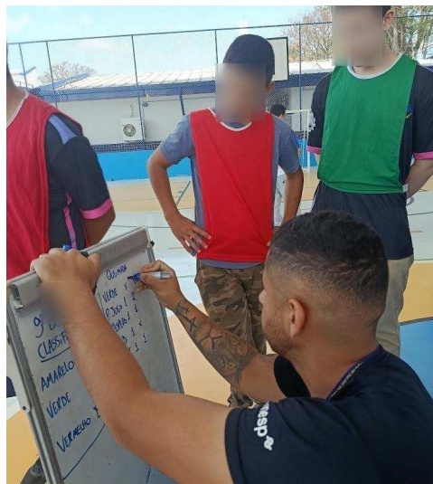
Figura 5: Registro das pontuações no terceiro-tempo da Queimada.

competição, o respeito deixou de ser uma obrigação mediada pelo medo de perder, para se tornar um ato habitual e consciente. Dentre os pilares da Metodologia Callejera , o respeito teve o maior destaque e recepção positiva por parte dos/as alunos/as.