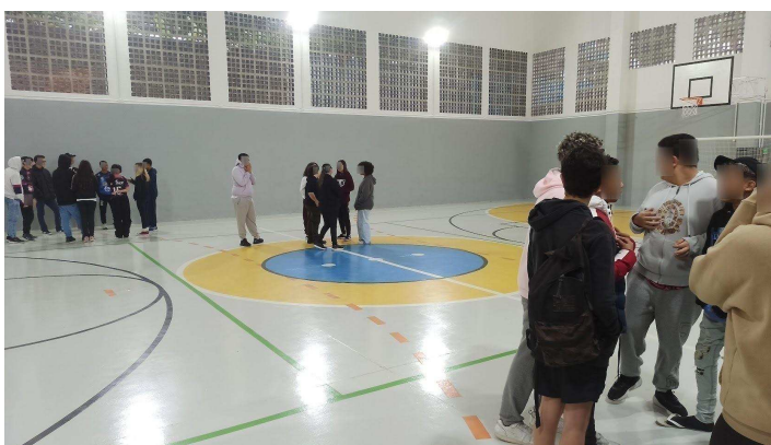
Figura 2: Diálogo entre os grupos para escolherem as práticas corporais.