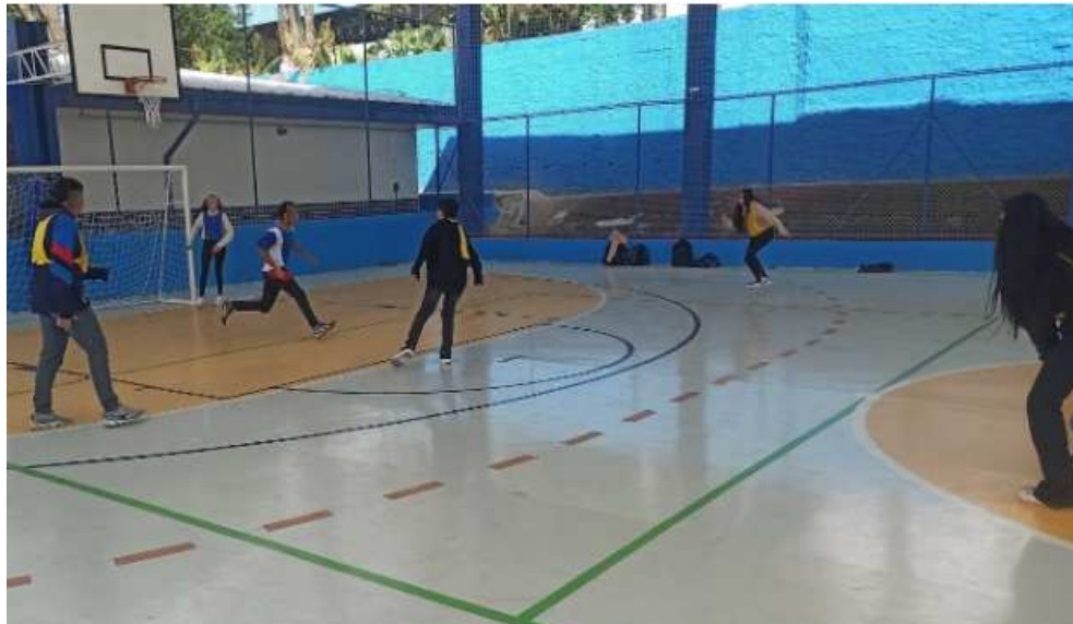
Figura 13: Vivência do jogo Bandeirinha utilizando a metodologia Callejera