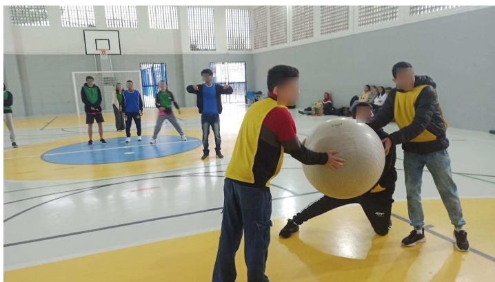
Figura 18: Ensaio de vivência do Kin-ball.

Esse ensaio com o Kin-ball foi importante para lembrarem as regras e se apropriarem de estratégias; foi fundamental para verem que é uma modalidade inclusiva e, pela animação da turma, um esporte divertido. Ao final da aula, disse que iríamos tentar realizar o Badminton na próxima aula e deixar o Kin-ball para finalizar a nossa competição, por ser um esporte bastante imprevisível e que pode gerar bastante empolgação para o resultado da classificação final. Me despedi dos alunos/as escutando depoimentos do tipo: “Pensei que seria chato, mas é legal!”. Nesse dia, saí contente em ver o empenho de alguns colegas em escolherem modalidades diferentes das tradicionais, que privilegiam somente aqueles que têm altas habilidades.