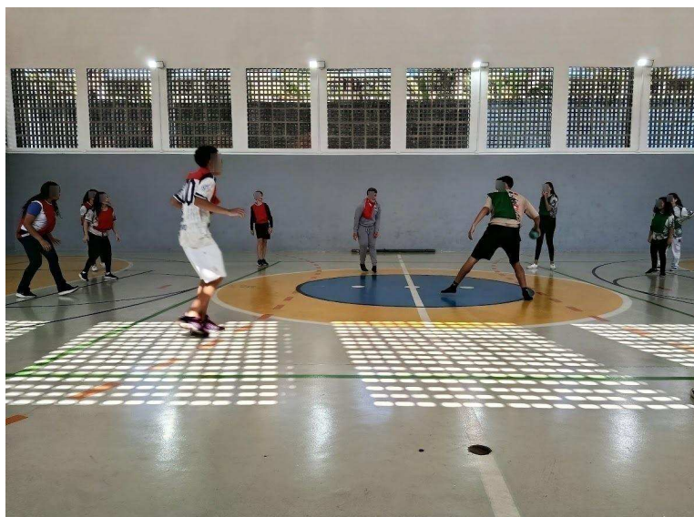
Figura 15: Vivência do jogo da Queimada.

Por fim, somei as pontuações deste primeiro dia, e deixei a disposição no flipchart para todos verem, Amarelo com 7 pontos, Verde com 6 e Vermelho com 5. Reforcei que na próxima aula iremos vivenciar novamente a queimada a fim de possibilitar oportunidades para melhorarem os elementos dos pilares da metodologia callejera. Orientei também a importância desses pilares que seria um diferencial nessa nossa competição. Após alguns minutos os alunos se dirigiram a sala de aula para a aula com o próximo professor.