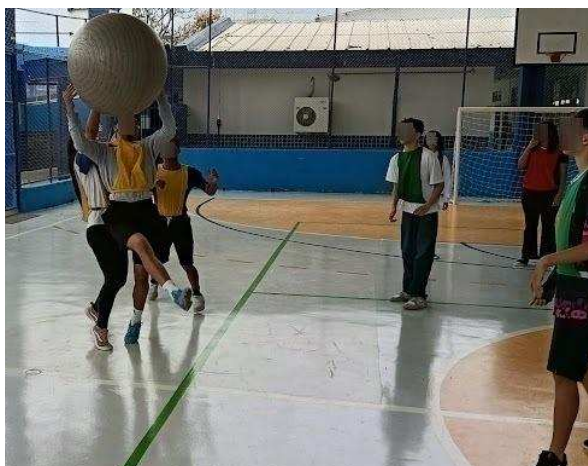
Figura 20: Vivência do Kin-ball.

Apesar dos pedidos para estender a competição, mantive o cronograma para não comprometer o planejamento bimestral. Despedi-me dos alunos e eles seguiram para a próxima aula.