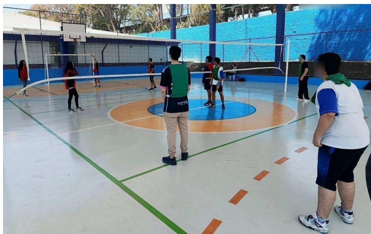
Figura 17: Vivência do Voleibol