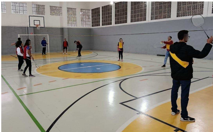
Figura 19: Vivência do Badminton.