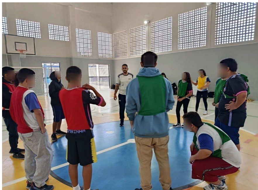
Figura 3: Diálogo no primeiro-tempo do jogo da Queimada.

estereótipos enraizados na competitividade exacerbada e na padronização dos corpos, o que exige um esforço constante para transformar a vivência em um espaço de palavra, e não apenas de mera reprodução mecânica de gestos técnicos. É desafiador quando é ofertada aos/as alunos/as a possibilidade de sugerir adaptações em práticas que com o passar do tempo se tornaram 'cômodas' durante o exercício docente, por conta do conhecimento das regras e da lógica interna da prática pelos próprios/as alunos/as.