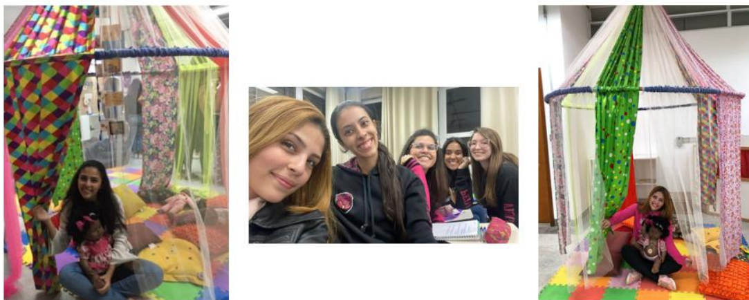
IMAGEM 10: Ensaio fotográfico sobre o primeiro dia de aula, amigas que me acompanharam no curso, foto do primeiro dia refeita em 2023.