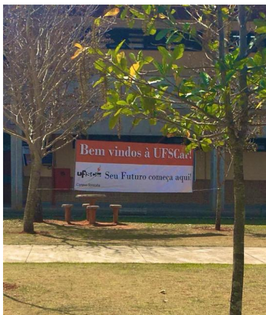
IMAGEM 3: “Universidade aberta: UFSCar, seu futuro começa aqui”