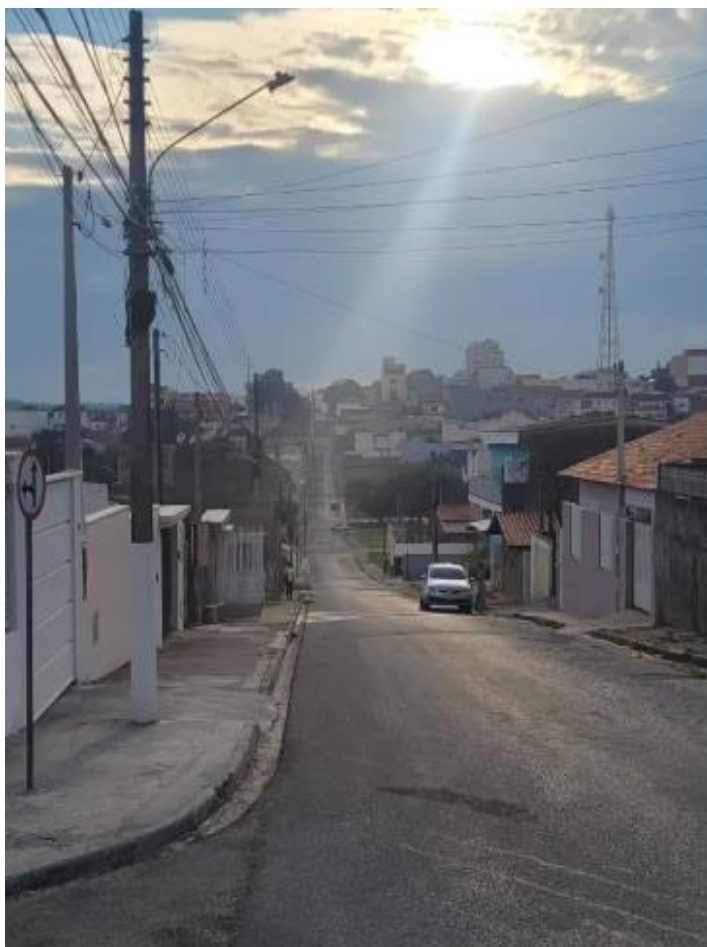
Figura 8 - Rua Presidente Kennedy - Bairro Campo Grande