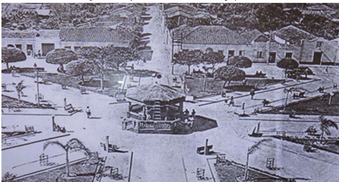
Figura 3 - Praça central vista da torre da Igreja Matriz em 1954