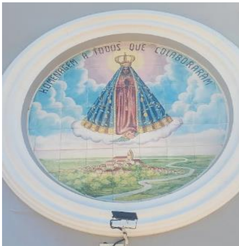
Figura 1: Pintura em azulejo na Paróquia Bom Jesus do Bom Fim em alusão à fundação da cidade.