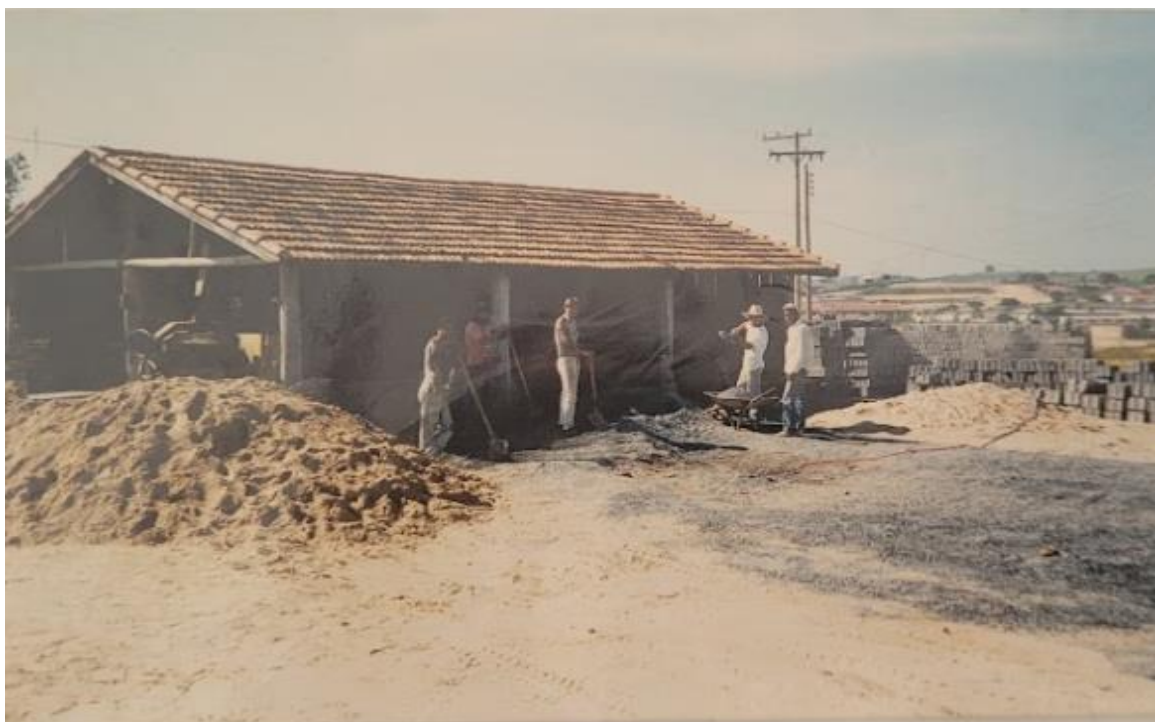
Figura 11 - Fábrica de blocos cedida pela prefeitura.