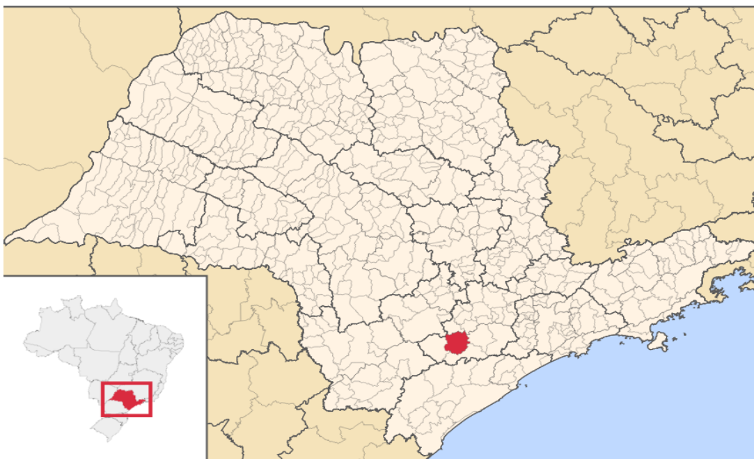
Mapa 1: Localização do município de Pilar do Sul no Estado de São Paulo.