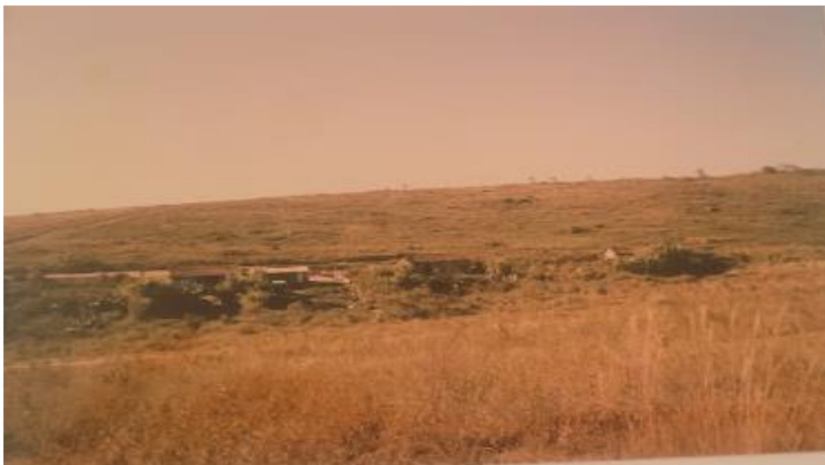
Figura 9 - Região onde hoje é o Jardim Nova Pilar no início dos anos 1980