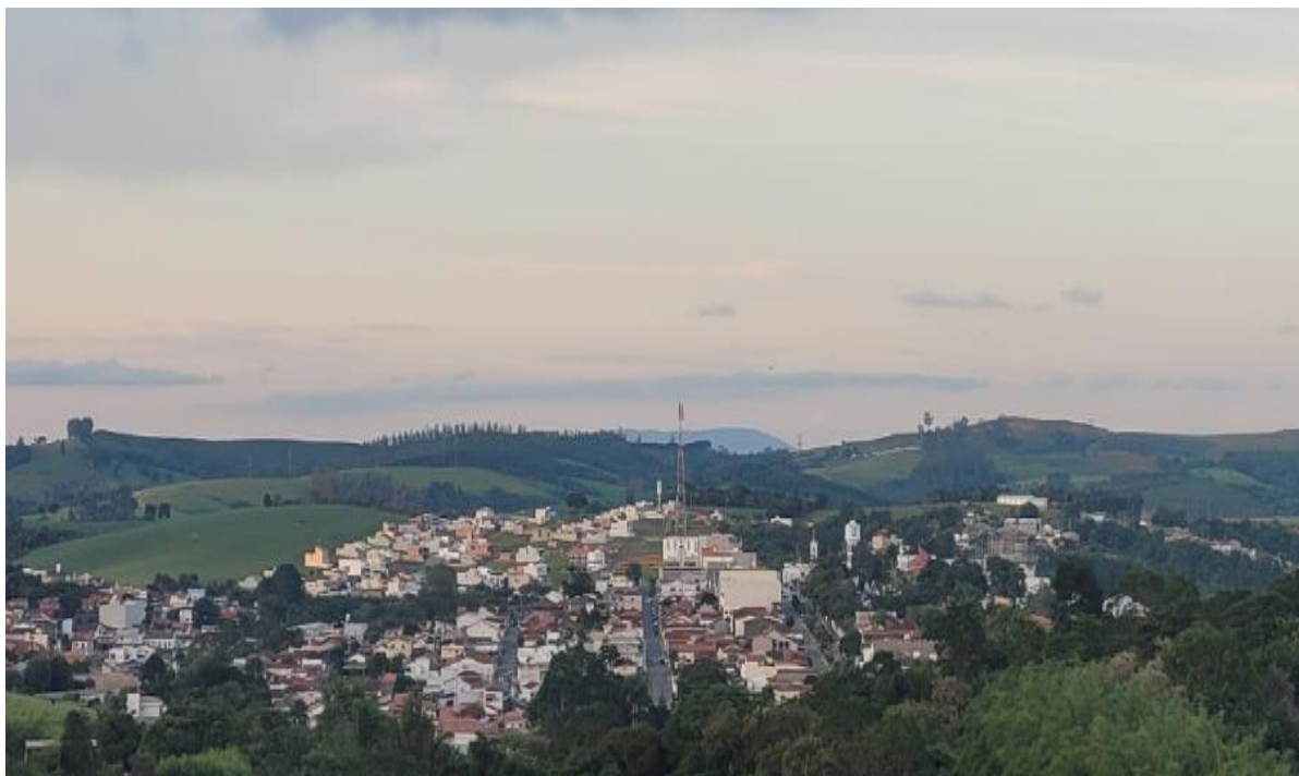
Figura 6 - Vista panorâmica da área central da cidade. Dezembro/2024