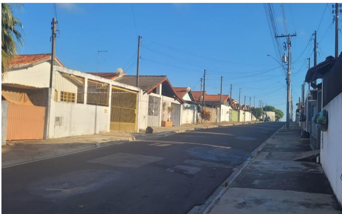
Figura 16 - Rua Acácio de Moraes. Janeiro/2025