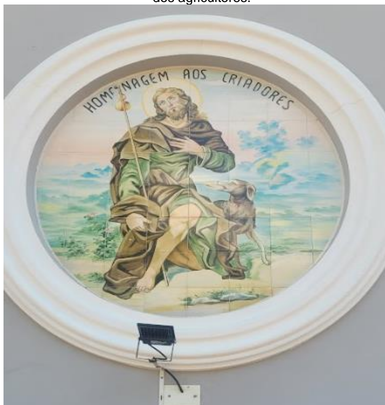
Figura 2: Pintura em azulejo na Paróquia Bom Jesus do Bom Fim dedicada a São Roque, padroeiro dos agricultores.