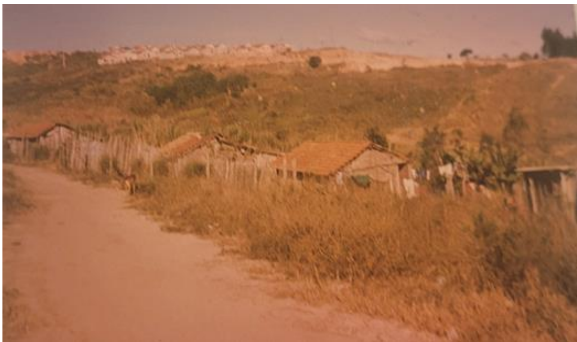
Figura 10 - Vilarejo em que a Cleonice viveu. Ao fundo, o início da construção do Jardim Nova Pilar.