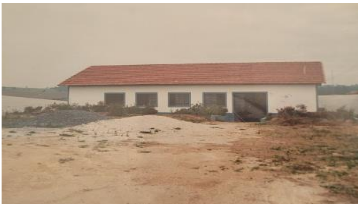
Figura 12 - Salão comunitário de Nossa Senhora do Pilar - 1993