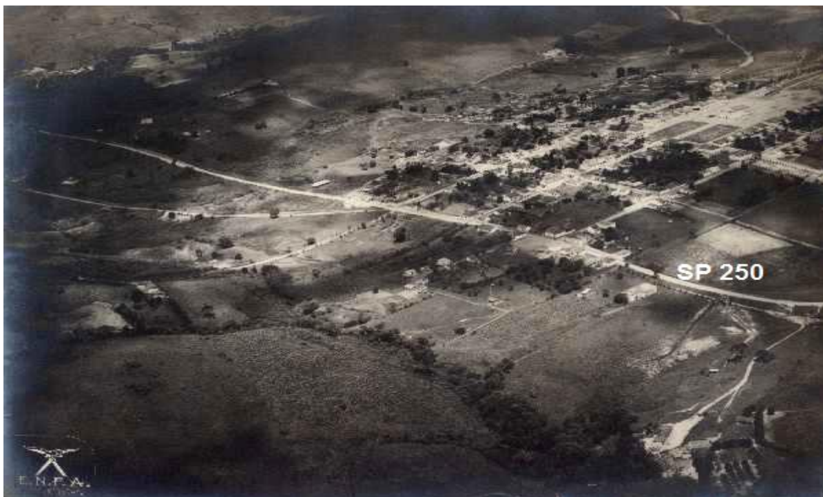
Figura 5 - Vista aérea da zona urbana 1939/1940