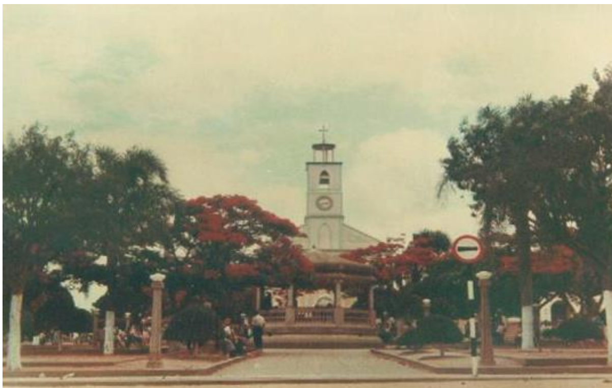
Figura 4 - Praça central vista com destaque ao coreto no centro e a Igreja Matriz ao fundo.