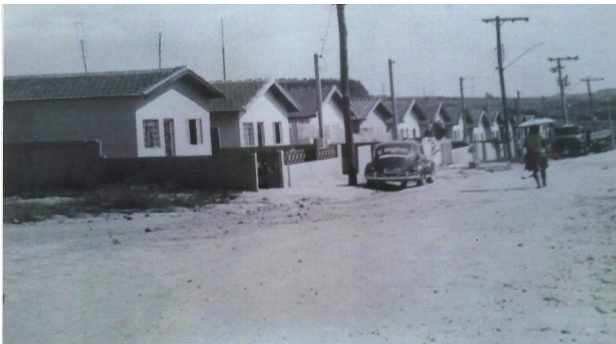
Figura 15 - Rua Acácio de Moraes, final da década de 1980