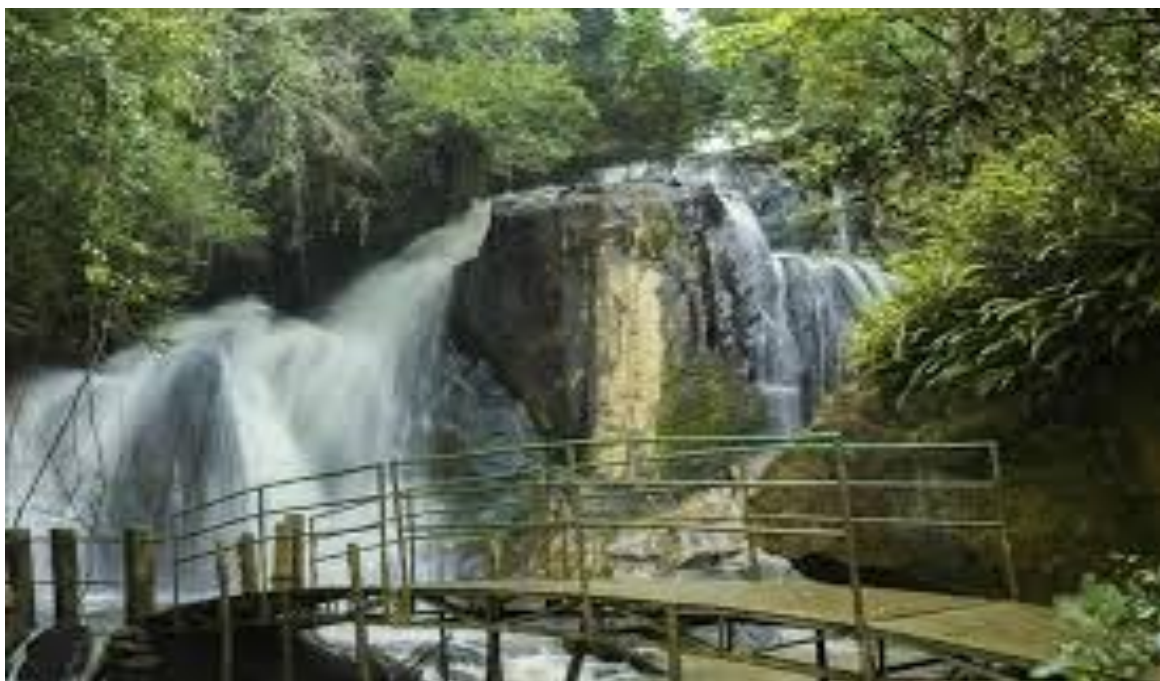
Figura 7 - Cachoeira Nascente das Águas - símbolo pilarense

A cachoeira Nascente das Águas (Figura 7) localiza-se na Rodovia José de Carvalho, KM 133, no bairro Turvinho e é um ponto turístico da cidade. Com um grande volume de água, atrai visitantes o ano todo, principalmente aos finais de semana.