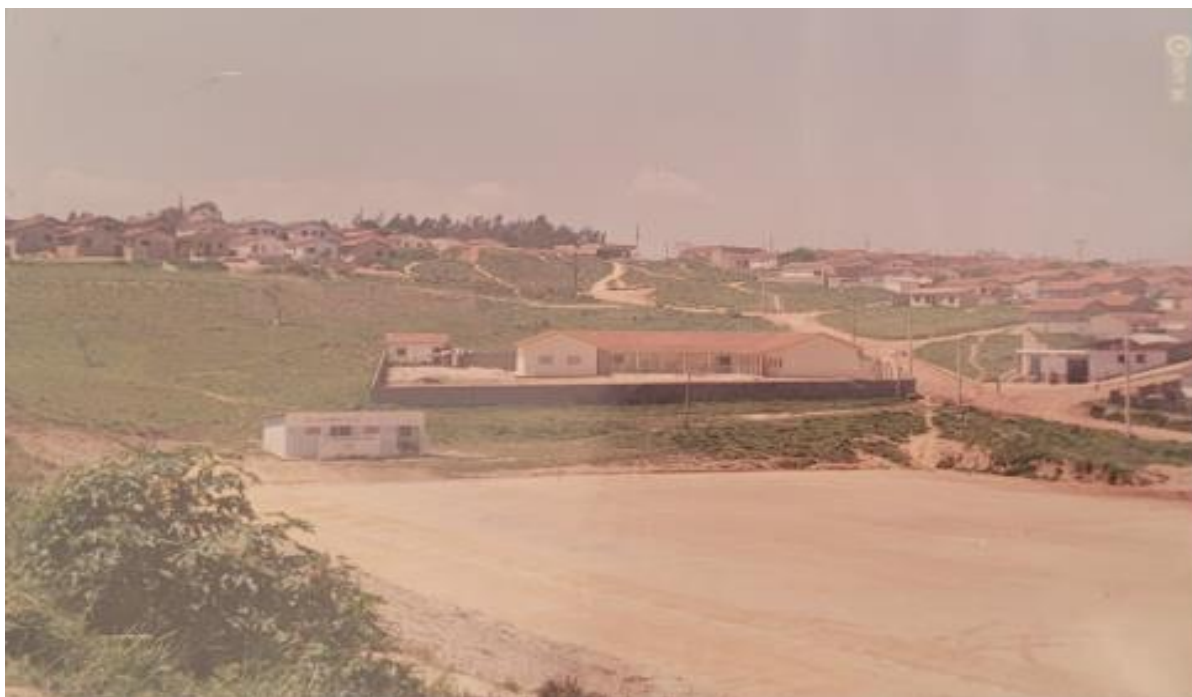
Figura 17 - Creche da Comunidade Cristã Pilarense e área de lazer do bairro em 1993.