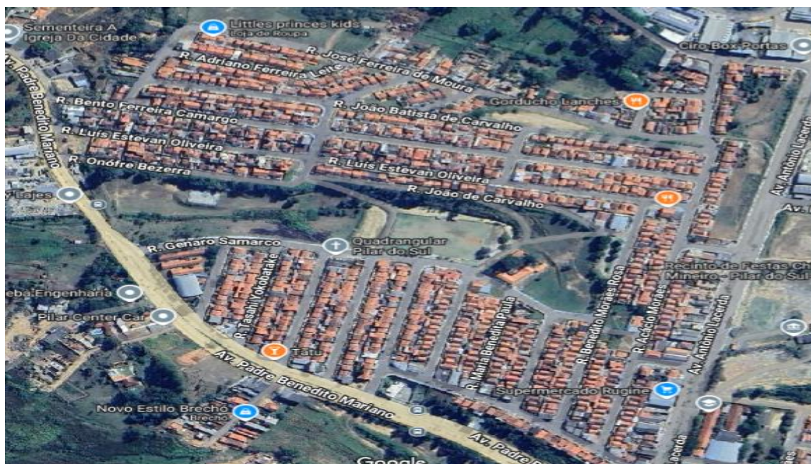
Mapa 3 - Jardim Nova Pilar I, II e III atualmente