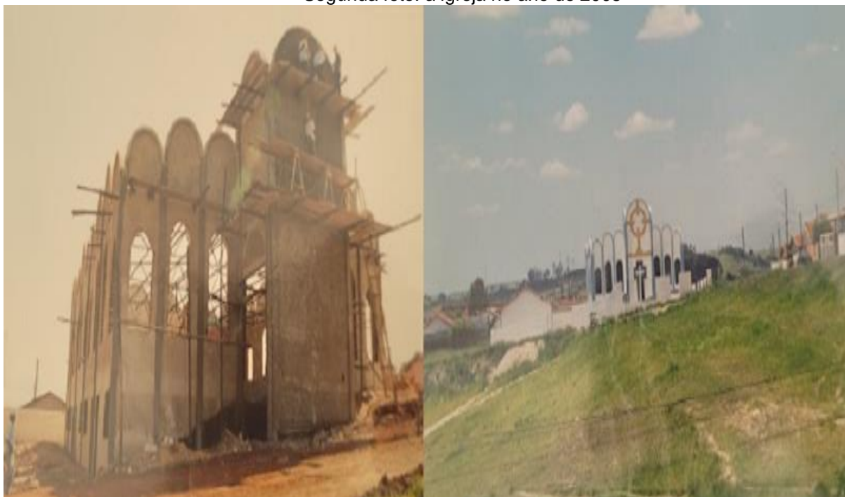
Figura 18 - Primeira foto: a construção da igreja no ano 2000. Segunda foto: a igreja no ano de 2005