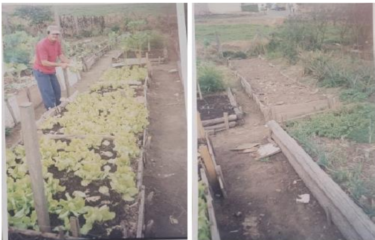
Figura 14 - Horta comunitária que existiu entre 2002 e 2010