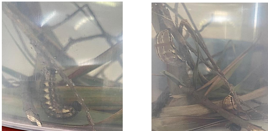
Imagem: Nosso tesouro suspenso