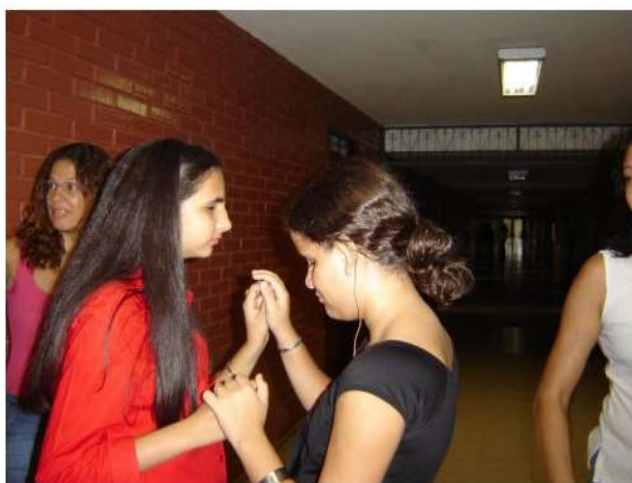
Figura 7 - Língua de Sinais Tátil