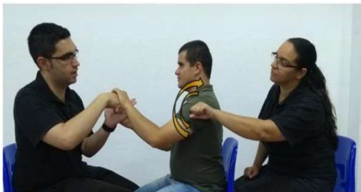
Figura 10 - Comunicação Social Háptica

Fonte: Almeida, 2015. p.52. Baseado em Dorado, 2004.