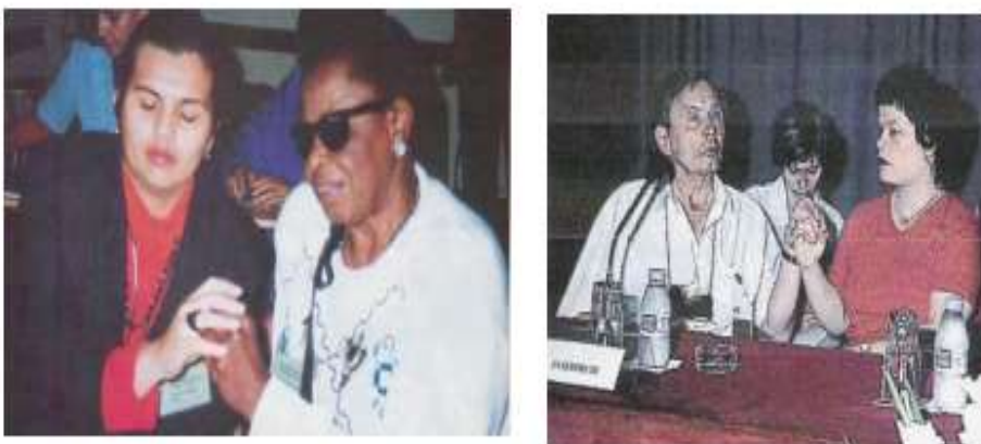
Figura 1 - Alfabeto Datilológico Tátil

Como há diferentes vivências quanto a surdocegueira, existem diferentes formas de comunicação que vêm sendo estudadas por pesquisadores da área. Em sua tese, Almeida (2015) aponta que as formas de comunicação podem ser por meio de sistemas alfabéticos (que trazem o alfabeto da língua portuguesa para transmissão de significados) e sistemas não alfabéticos (não utilizam letras, mas são representadas palavras inteiras). Nos sistemas alfabéticos existem: o Alfabeto Datilológico Tátil (Figura 1), Escrita na palma das mãos (Figura 2), Braille Tátil (Figura 3), Pranchas alfabéticas (Figura 4), Sistema Malossi (Figura 5) e Alfabeto MOON (Figura 6). Nos sistemas não alfabéticos se destacam: a Língua de Sinais Tátil (Figura 7), Método Tadoma (Figura 8), Língua de Sinais em Campo reduzido (Figura 9); Comunicação Social Háptica (Figura 10)