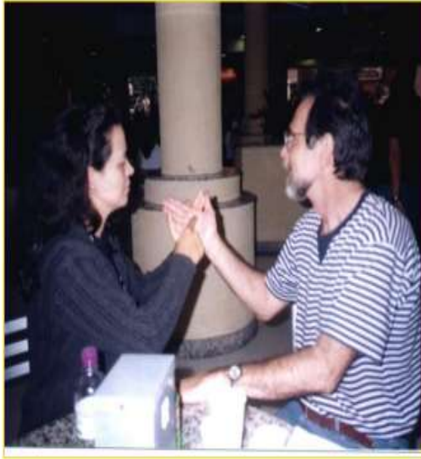
Figura 2 - Escrita na Palma das Mãos