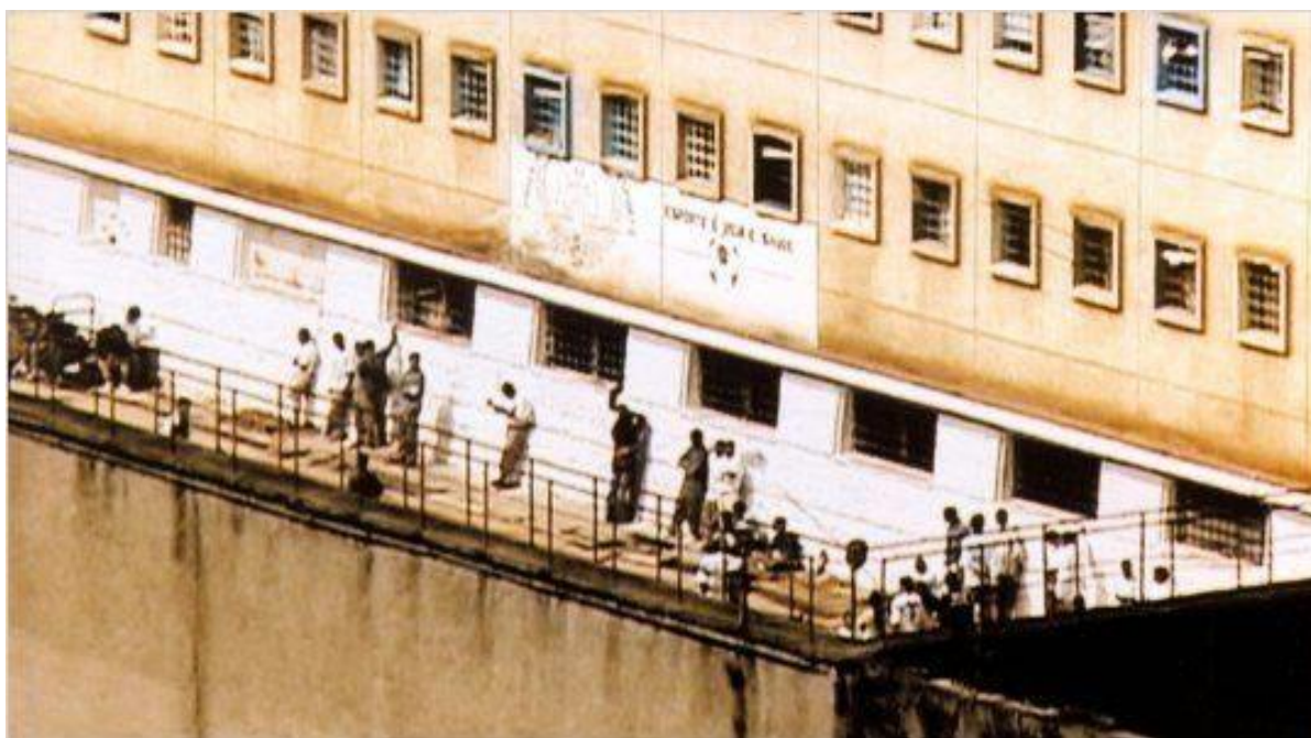
Figura 5: Prisioneiros no Muro do Carandiru