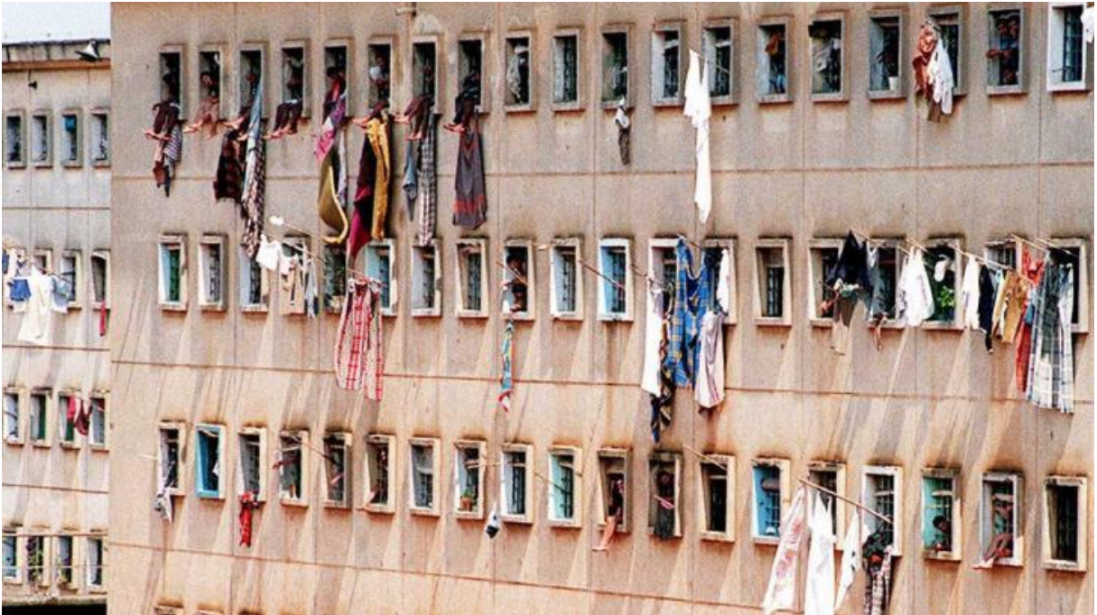
Figura 3: Um dos Prédios do Carandiru