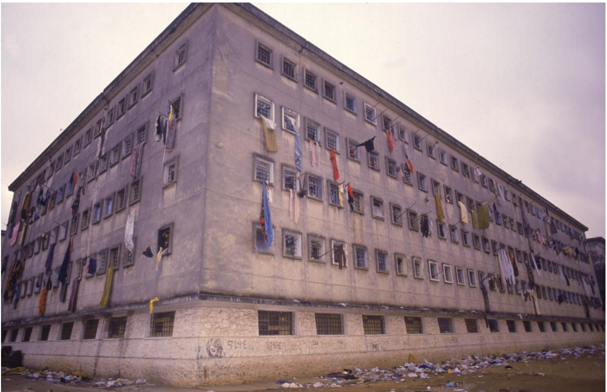
Figura 4: Mais um dos Prédios do Carandiru