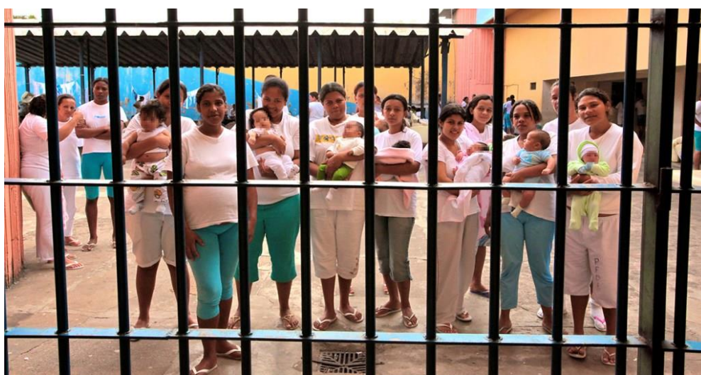
Figura 8: Mulheres Encarceradas e seus Bebês