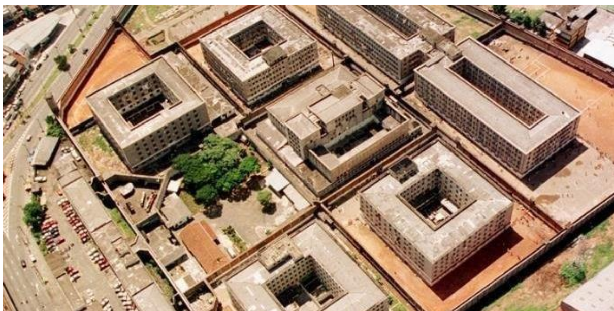
Figura 2: Vista Superior do Complexo do Carandiru

É possível observar algumas fotos do Carandiru a seguir.