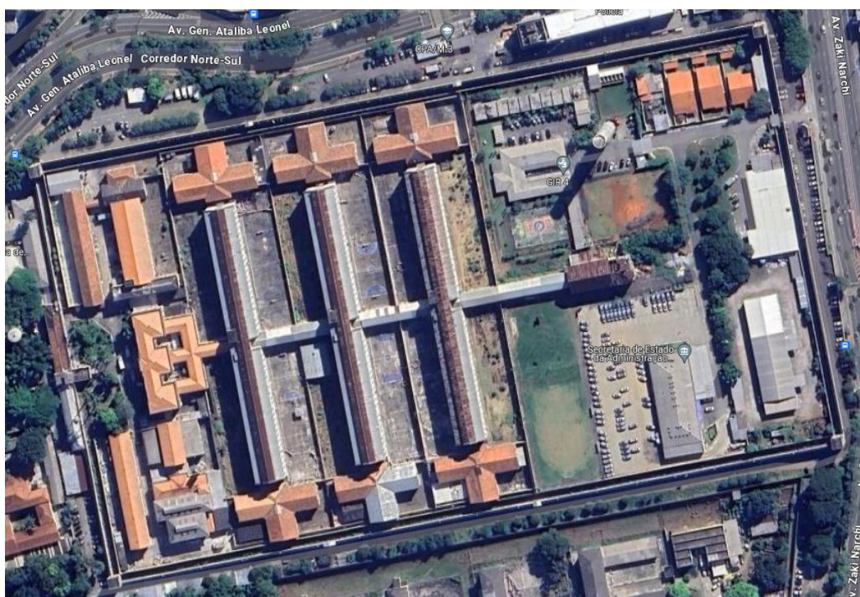
Figura 6: Penitenciária Feminina de Sant'Ana, vista de cima, 2024