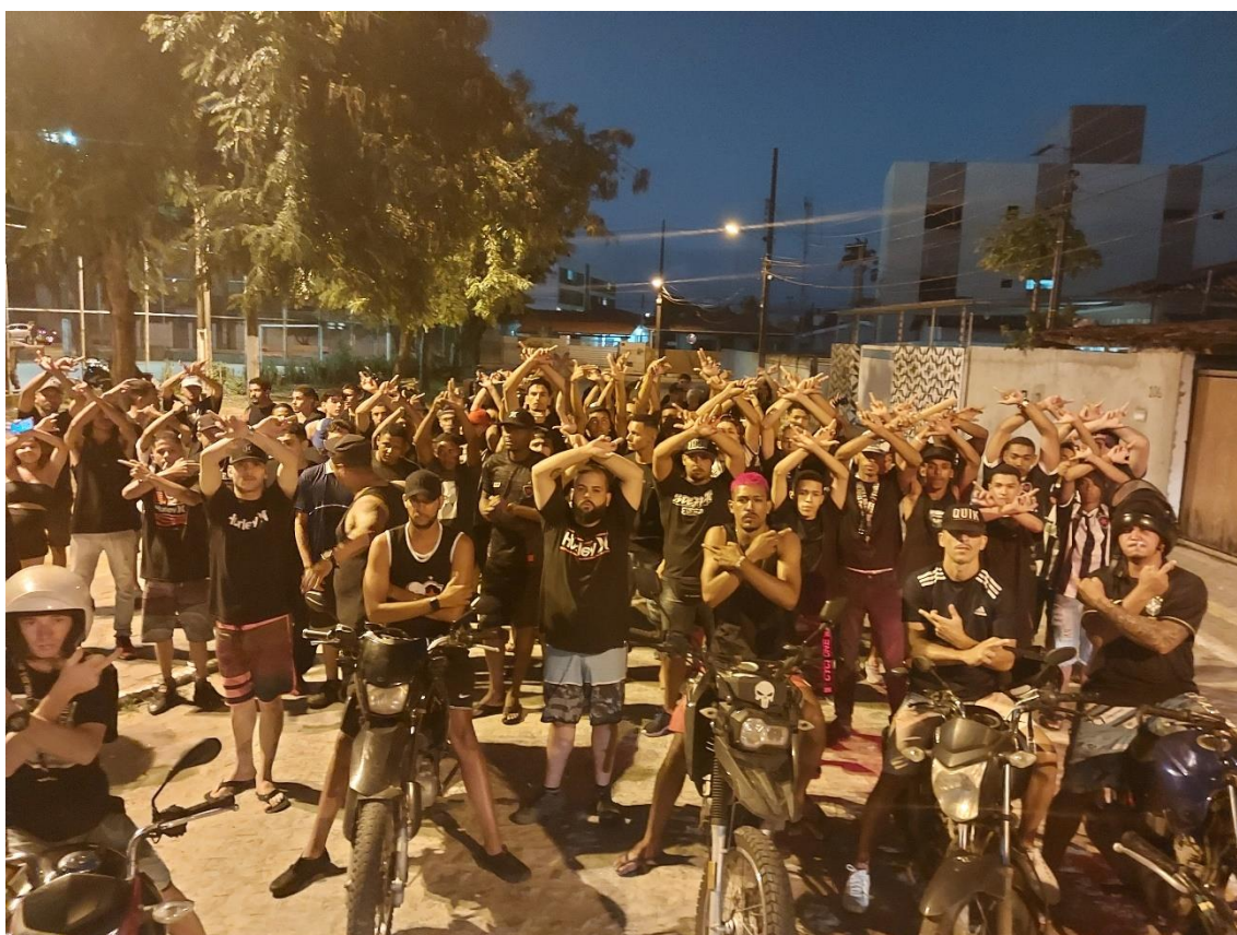
Figura 20 / Integrantes da TJB fazem o símbolo da União Dedo pro Alto pouco antes de iniciar um arrastão até o Estádio Almeidão / Felipe Caldas / 30 de julho de 2023

A TJB, então, que é DPA, é aliada de todas essas torcidas citadas acima. Mas, quando o debate vai para o Nordeste, a relação da Jovem com as demais torcidas pode mudar a partir de arranjos contextuais locais que acabam por superar as uniões nacionais.