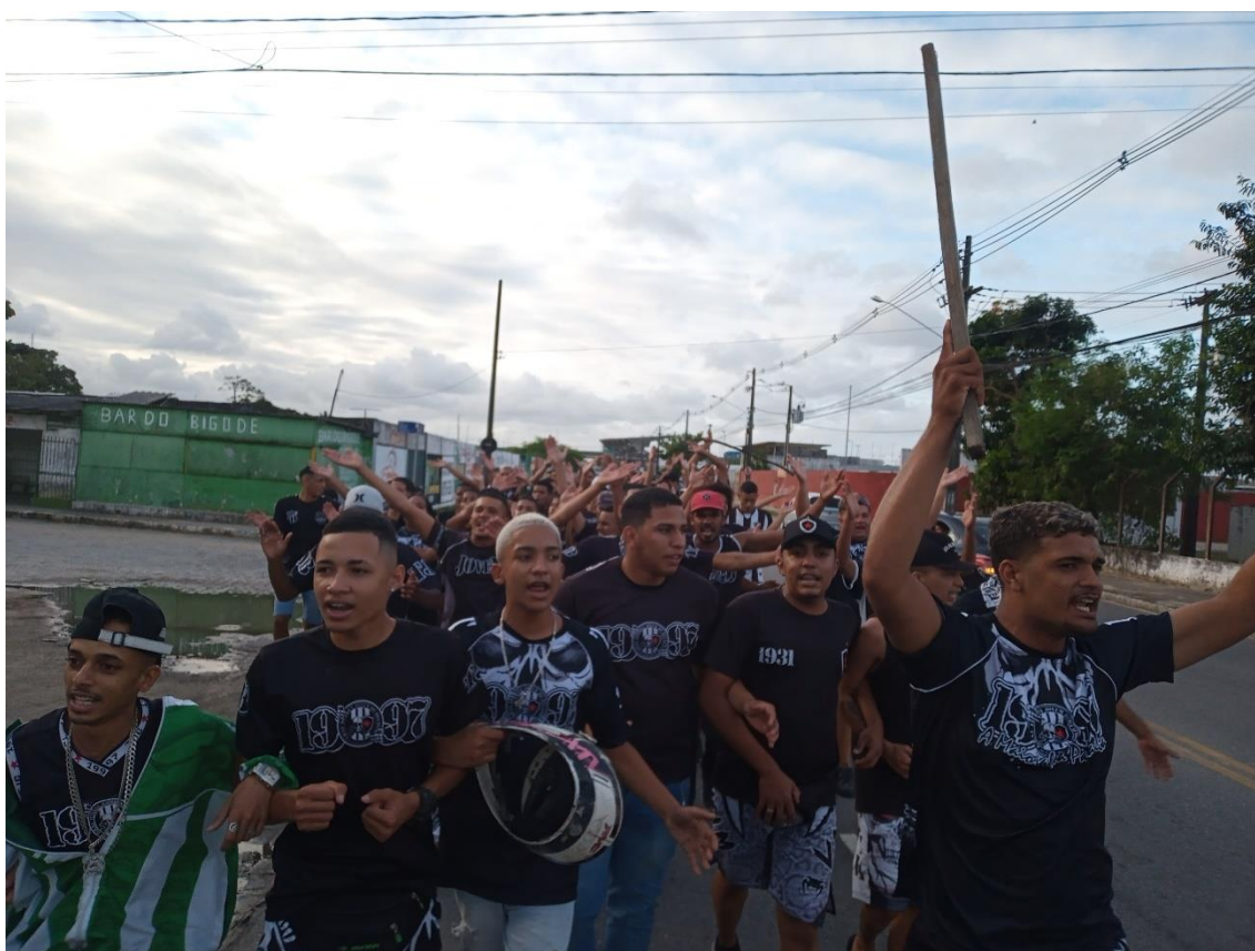
Figura 28 / Chegada da Zona Oeste da TJB à concentração do jogo contra o Remo-PA / Phelipe Caldas / 24 de julho de 2022

Acompanhei, uma vez mais, o processo, daquela vez a partir da Praça Bela, onde o Bonde dos Faixas se reuniu por volta de uma da tarde. E, como a Zona Sul foi a primeira a chegar ao ponto de encontro, testemunhei naquele dia a chegada das demais. Lembro que a Zona Oeste me chamou a atenção de forma especial (Figura 28), mais impactante, ao chegar em um número impressionantemente grande de torcedores, “ocupando a rua, cantando alto, pulando festivamente” (Caderno de Campo, 24 de julho de 2022).