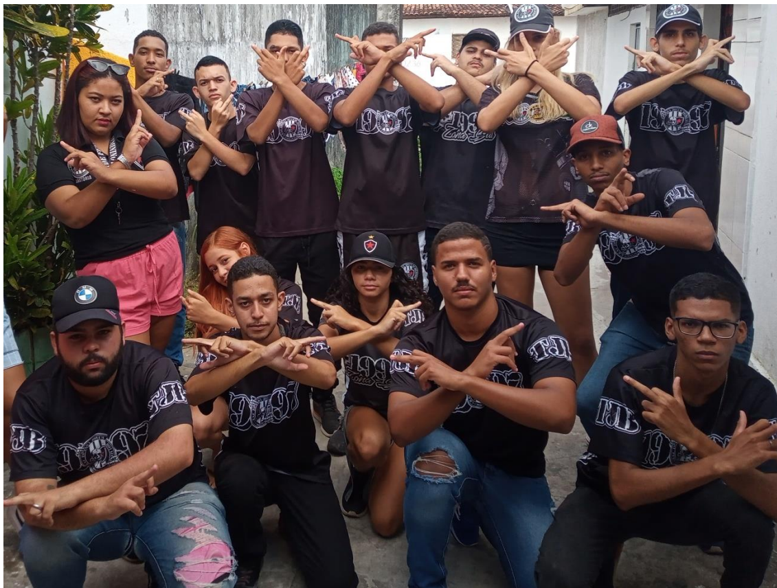
Figura 03 / Integrantes do BDF fazem o sinal da Jovem antes de iniciar arrastão por João Pessoa, no dia de jogo contra o Fortaleza / 15 de fevereiro de 2022

O certo é que, ao me tornar BDF, tornei-me uma série de outras identidades também. E deixei de ser muitas outras, claro. Paulatinamente, a complexa rede identitária que forma uma torcida organizada foi sendo descortinada para mim.