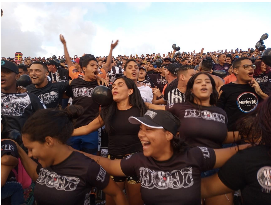
Figura 16 / As mulheres da TJB em luta constante pelo direito à arquibancada / Phelipe Caldas / 14 de maio de 2022

De toda forma, retomando o debate sobre a luta das mulheres da TJB por mais espaço na torcida organizada, é curioso demonstrar que nem mesmo o BF tem sucesso em sua pretensa unidade. Afinal, são mulheres que se unem em busca das mesmas conquistas e dos mesmos espaços de torcer, mas num contexto em que também elas precisam mediar suas diferenças internas e externas. Por exemplo, existem óbvias divergências entre algumas das mais de 30 integrantes do bonde 88 e nem todas as mulheres da TJB querem integrar o BF.