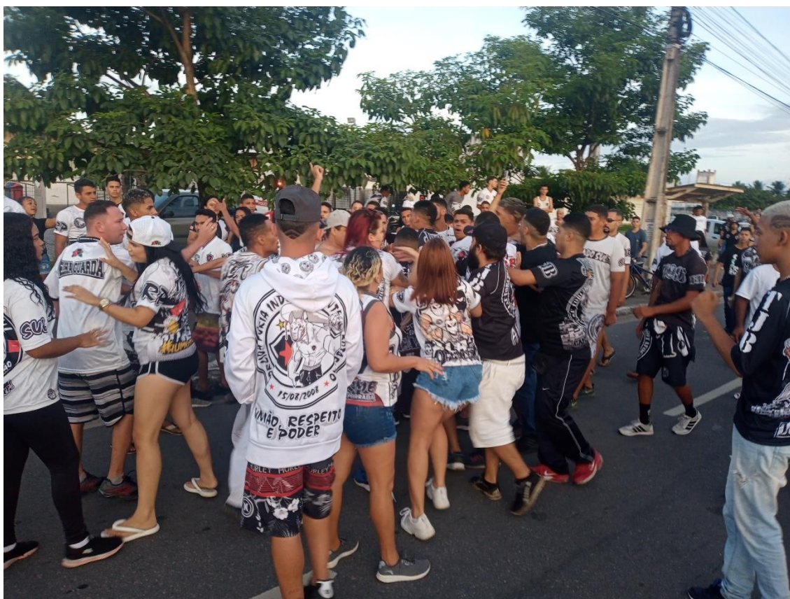
Figura 29 / Torcedores de TJB e Fúria se estranham no bairro de José Américo / 24 de julho de 2022

A situação começou a sair do controle com as encaradas e, logo depois, com as piadas e provocações que eram feitas à medida em que os torcedores se movimentavam entre si para realizar a reorganização dos espaços do arrastão. Não se passaram poucos segundos, os primeiros empurrões. No instante seguinte, a briga (Figura 29) 121 . Intensa, agressiva, rápida, violentamente separada por policiais militares, que usaram gás de pimenta, cassetetes, balas de borracha no meio da avenida.