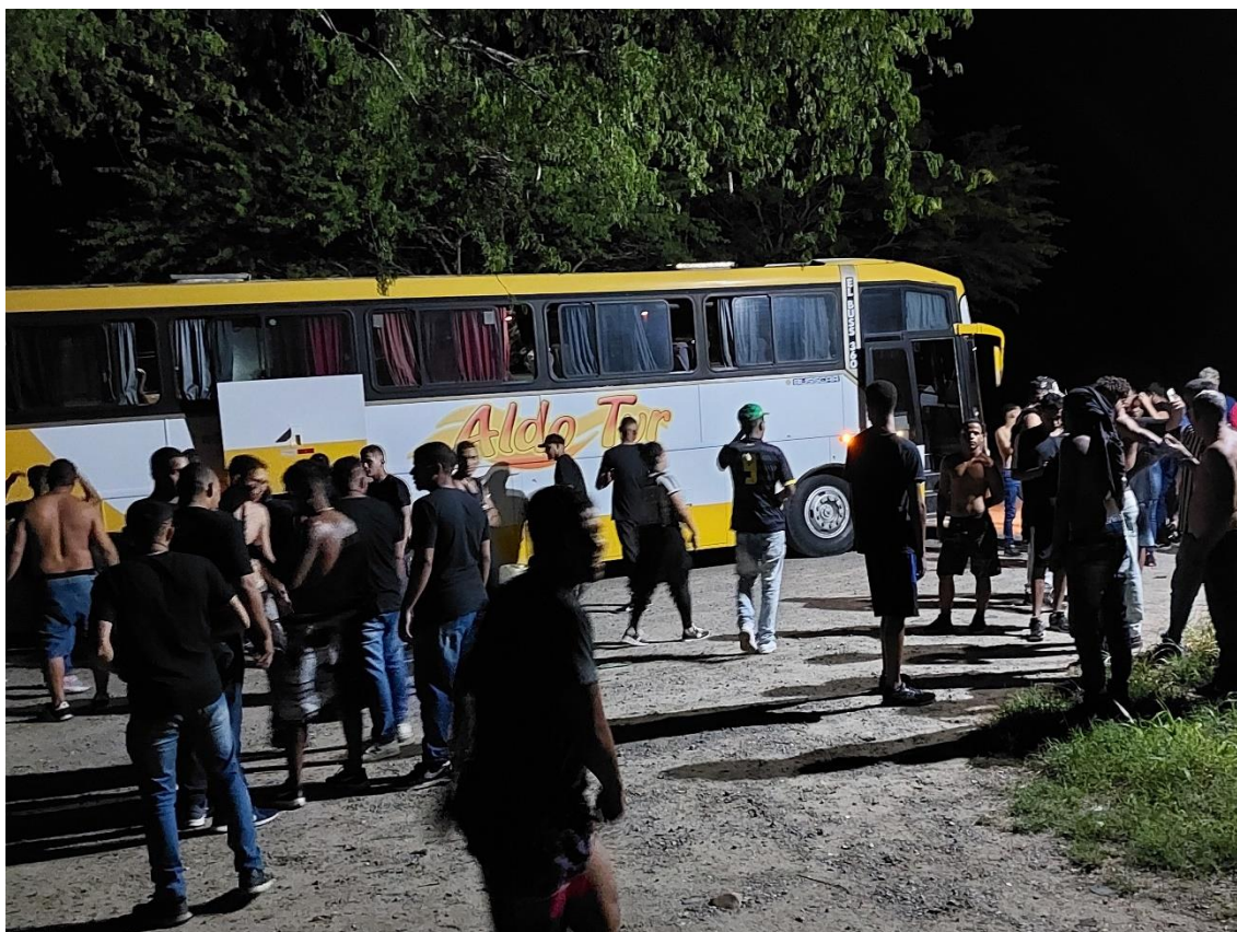
Figura 34 / Ônibus da TJB quebra no retorno para João Pessoa após pista contra a Fação Jovem em Campina Grande / Phelipe Caldas / 26 de janeiro de 2023

Sobram, assim, as mais precárias, as mais desesperadas para qualquer tipo de viagem. Logo, não raro, aquelas com veículos velhos, irregulares, com problemas mecânicos e documentações e vistorias vencidas. De certa forma, são os efeitos colaterais de uma dinâmica promovida pelas próprias torcidas organizadas que as afasta de ônibus em melhores condições.