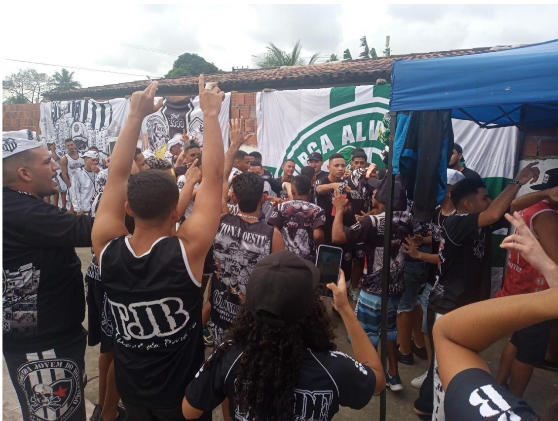
Figura 18 / Torcedores da Toca e da TJB cantam juntos uma música que faz alusão às “duas caveiras unidas” / Phelipe Caldas / 31 de julho de 2022