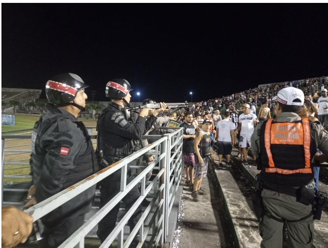
Figura 38 / Policial militar aponta espingarda para torcedores da Jovem localizados na Arquibancada Sol do Almeidão / 24 de julho de 2022

Naquele mesmo dia, mas já dentro do estádio, ao menor indício de desavença entre as duas torcidas, os policiais militares, mais uma vez, agiram com violência. Não raro, a intervenção provocava mais confusão do que a própria briga. E, mesmo quando não havia qualquer desavença sendo registrada, não foram poucas as vezes em que vi policiais militares apontando indiscriminadamente as suas armas contra os torcedores (Figura 38).