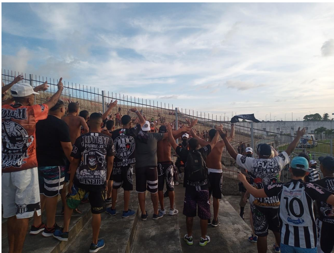
Figura 40 / Torcedores da Jovem cantam e provocam a distância rivais do Campinense-PB após gol do Belo no Estádio Almeidão / 6 de março de 2022