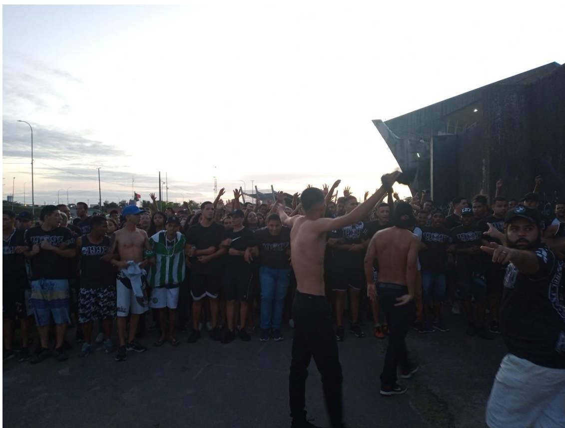
Figura 30 / TJB realiza arrastão solo no dia do jogo contra o Remo-PA, alguns minutos depois de briga com a Fúria / Phelipe Caldas / 24 de julho de 2022

Muitos excessos e abusos foram cometidos pela Polícia Militar naquele momento. Uma resposta desproporcional e inquietante que, apenas para respeitar as divisões temáticas apontadas por mim mesmo ainda na Introdução desta pesquisa, eu deixarei para abordar no Capítulo 4.