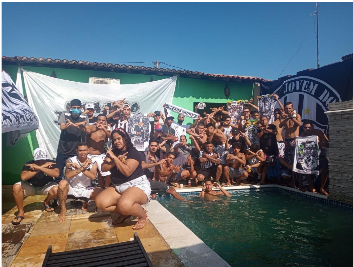
Figura 21 / Torcedores de TJB e Gang posam para foto na recepção em Ceará-Mirim, diante das bandeiras das respectivas torcidas / Phelipe Caldas / 6 de fevereiro de 2022

Muita gente da Jovem e da Gang foi para a piscina, enquanto outros se cotizavam e compravam bebidas diversas para seguir a festa. Com relação às músicas que saíam da caixa de som, eram todas ligadas às duas torcidas, às alianças das quais ambas faziam parte. Havia também muito papo mútuo, muito reencontro entre pessoas das duas torcidas que já nutriam amizades de outras caravanas, outras recepções, outros momentos juntos. Mas havia também novas relações sendo gestadas, entre integrantes novatos das duas torcidas que iam sendo apresentados pelos mais antigos.