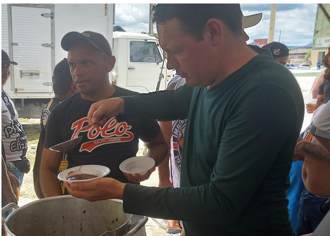
Figura 26 / Caldeirão de feijoada é servido para os torcedores em Sousa / Phelipe Caldas / 26 de março de 2023

Até porque relações de aliança antecipam, em mesma medida, relações de rivalidade. Ou vice-versa. Fato é que alianças são valorizadas, acima de tudo, porque todos os lados precisam de proteção adicional quando adentram território hostil. Festa e pista, como já dito, partes de um mesmo processo relacional entre torcidas organizadas. É nesse outro elemento da mesma estrutura que vou adentrar a partir de agora, pois. Afinal, como apregoa Farias (2013, p. 73), “a intensidade das relações é recíproca”. Ela falava das alianças, mas a mesma máxima vale igualmente para as rivalidades.