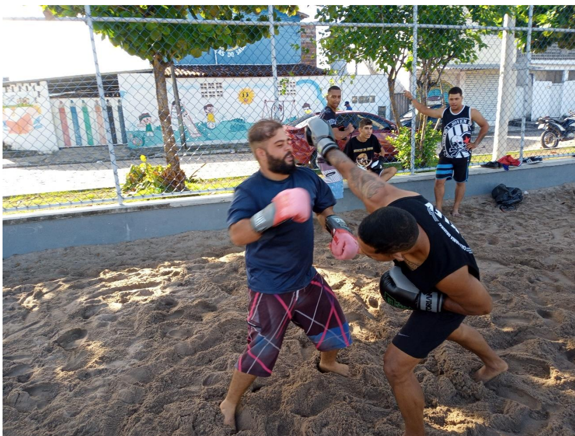
Figura 05 / Torcedores do BDF realizam simulação de combate “na vera” / Phelipe Caldas / 30 de abril de 2022

E se esses elementos estavam presentes numa mobilização agitada e de grande esforço físico como um treino de kickboxing , estavam igualmente presentes numa reunião de quarta-feira à noite na mesma praça, para desta vez combinar como seria a ação social do Dia das Crianças do BDF.