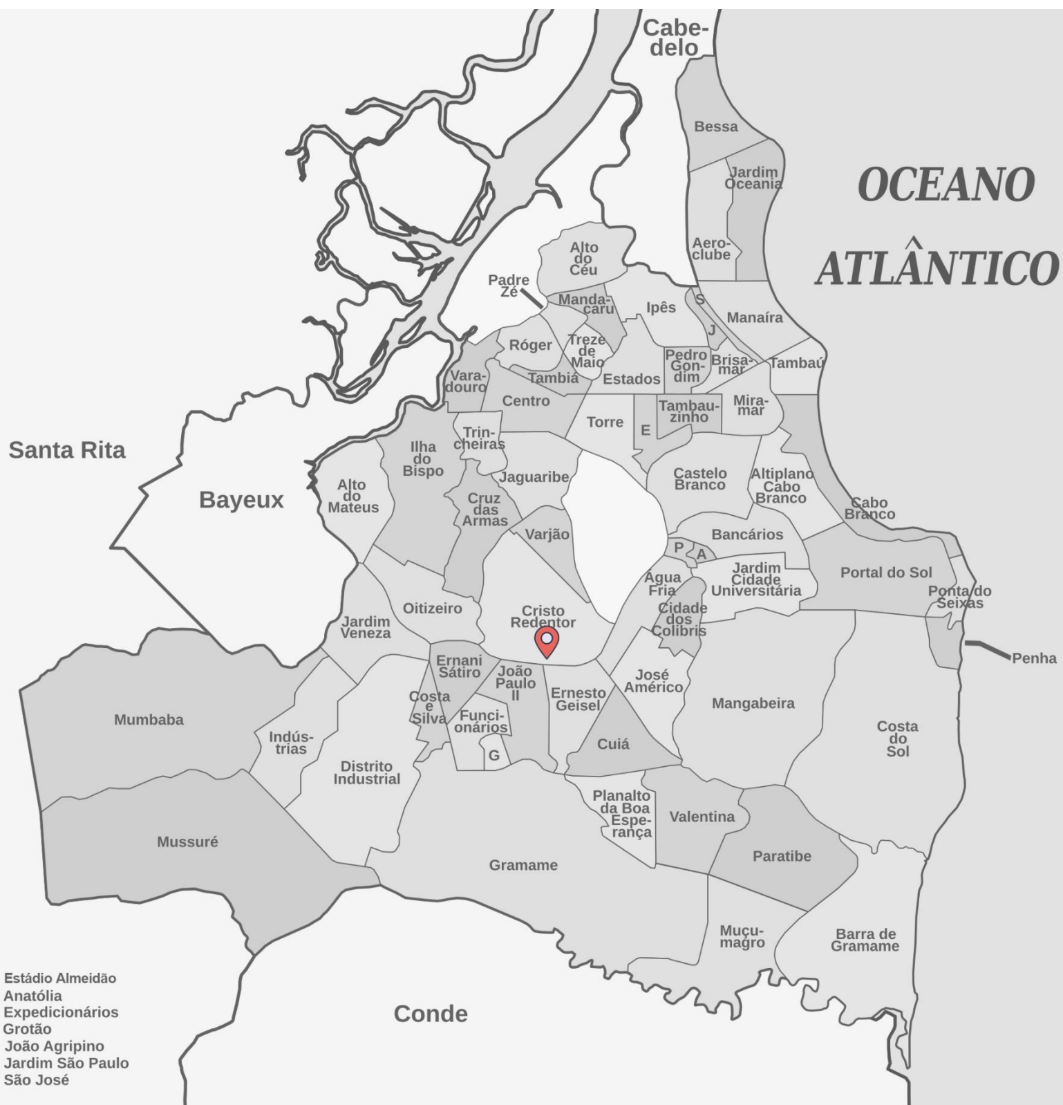
Mapa 01 / Mapa de João Pessoa / Diogo Almeida / 10 de outubro de 2024 14