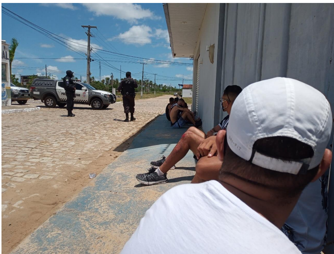
Figura 42 / Policiais militares do Rio Grande do Norte revistam torcedores da TJB que chegavam em caravana para Ceará-Mirim / 6 de fevereiro de 2022

Fiquei assim alguns minutos, dando sequência ao meu projeto, até que saquei o celular do bolso, acionei a máquina fotográfica e o deixei em posição, disfarçando-o perto da perna. Pensei agilmente, pesei o momento certo, tomei coragem, arrisquei algumas fotos (Figura 42). Não mostra muito, mas o suficiente para configurar a cena de abordagem policial em um dia calorento e causticante.