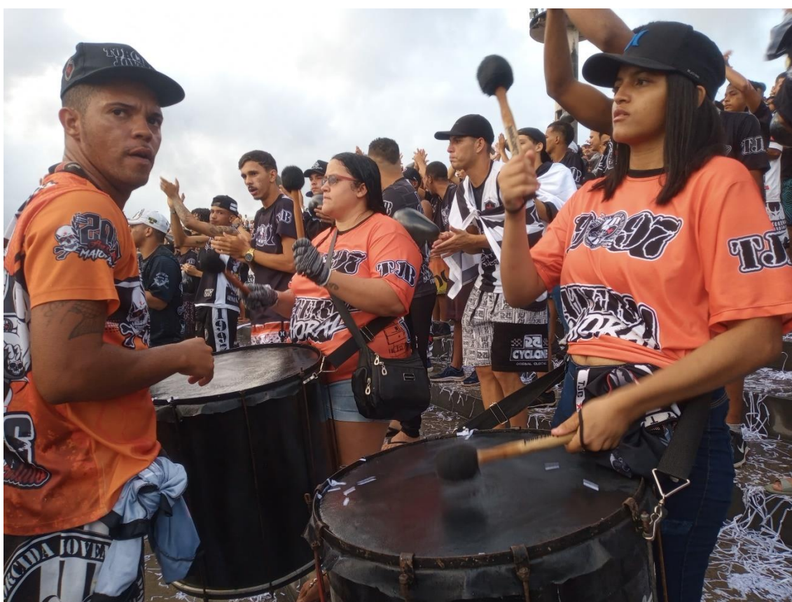
Figura 14 / Mulheres da TJB integram a Bateria Maioral e ocupam espaços que no passado eram interditados para elas / 14 de maio de 2022

No curso de minha pesquisa, a propósito, eu identifiquei inúmeras mulheres que atualmente participam da Bateria Maioral (Figura 14), algo que era proibido até algum tempo atrás. E, em muitas oportunidades, eu observei a participação delas no transporte de materiais da torcida para o estádio em dias de jogos.