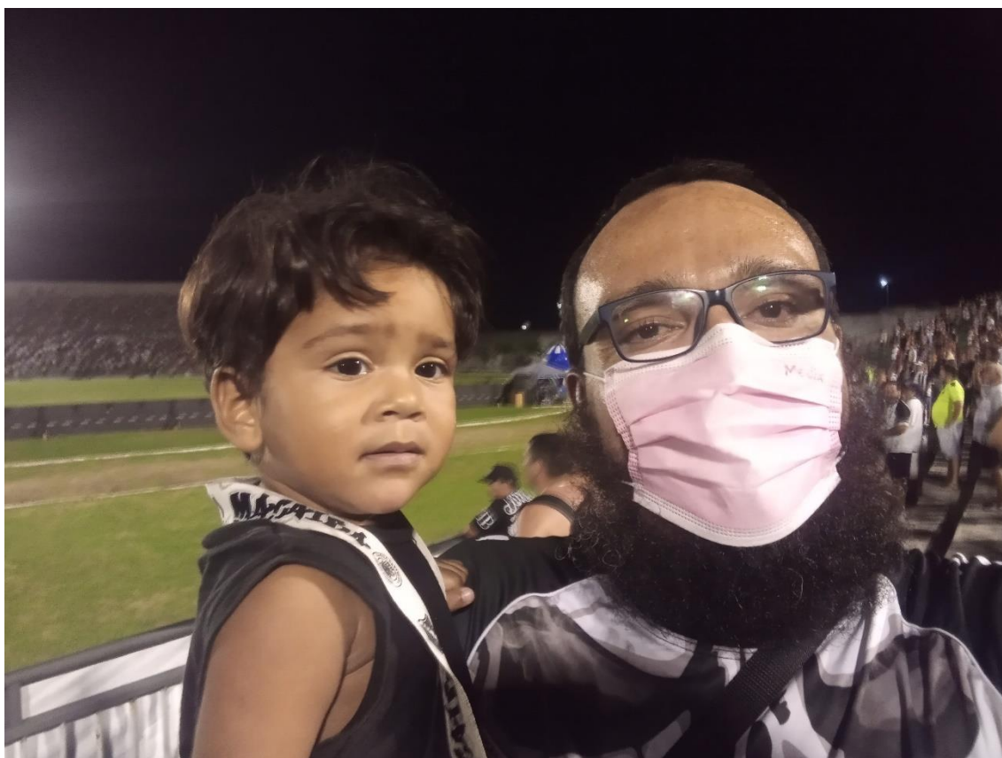
Figura 15 / Crianças são cada vez mais frequentes na Arquibancada Sol, levadas também pelas integrantes da TJB / 26 de abril de 2022

E, diante de um aceno meu que serviu para ela como aceitação silenciosa, entregou-me a criança, que eu segurei em meus braços e a embalei cuidadosamente por entre a desforra coletiva (Figura 15). Eu fazia isso enquanto ela se virava em êxtase, soltava um grito, abria os braços, finalmente pulava e abraçava as suas companheiras de BF, de TJB, de resistência também.