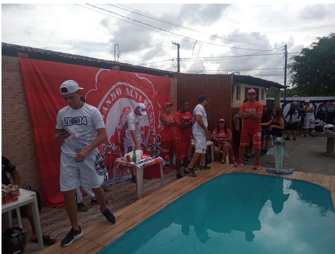
Figura 19 / Torcedores da Comando Alvirrubro cruzam os braços durante performance da Toca e da TJB / Phelipe Caldas / 31 de julho de 2022