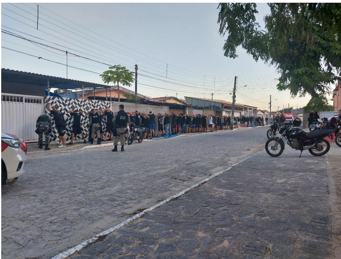
Figura 37 / Policiais militares da Paraíba realizam baculejo coletivo em torcedores da TJB / 30 de julho de 2023

É bem verdade que eu não questionava ninguém, não tentava repelir a postura deles, não protestava. Apenas seguia ali, indiferente aos policiais, registrando silenciosamente tudo o que acontecia, mas sem, em nenhum momento, ser incomodado, ser interpelado, ser abordado para também eu ser revistado. Eu fazia aquilo, por sinal, como uma espécie de experimento social, mas admito que cheguei a ficar totalmente constrangido por não ter sido revistado.