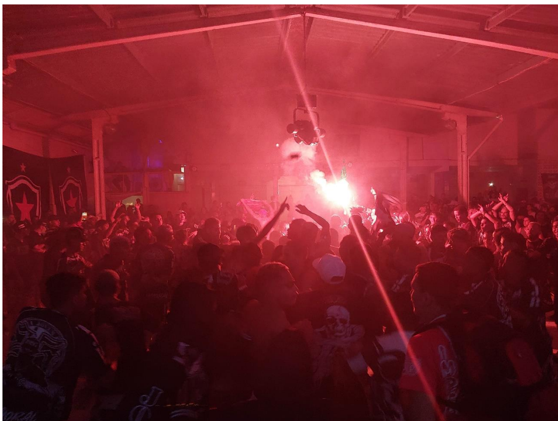
Figura 01 / Baile de 25 Anos da TJB, realizado na casa de Show Nova Querência, em João Pessoa / Phelipe Caldas / 26 de novembro de 2022

Aquele instante, inclusive, eu acompanhei bem de perto do puxador e da bateria, que juntos formavam uma das treze atrações que se apresentariam naquela noite. Eles estavam em um palco de concreto localizado no fundo de um grande salão retangular (considerando a perspectiva de quem entra no local, o lado oposto) e ficavam mais ou menos três metros acima dos demais torcedores. Com a pretensão de tirar fotos da apresentação, também subi ao palco. Mas, de repente, estava apenas observando tudo de uma forma completamente atônita.