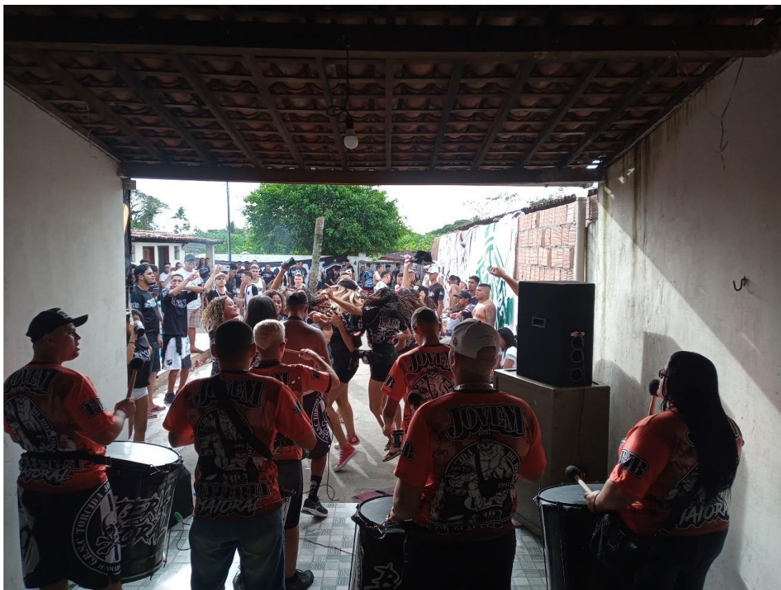
Figura 17 / Do fundo da garagem que se transformou em palco, é possível ter uma ideia da Waleskafest / Phelipe Caldas / 31 de julho de 2022

Algumas aderiram. Estavam lá a Torcida Força Alviverde (TFA), do Sousa-PB, única torcida paraibana aliada da TJB 92 ; a Fanático, do Náutico-PE; a Torcida Organizada Comando Alvinegro (Toca), do Central de Caruaru-PE; e a Comando Alvirrubro, do CRB-AL. Estavam presentes também integrantes da Império Alvinegro, do próprio Belo.