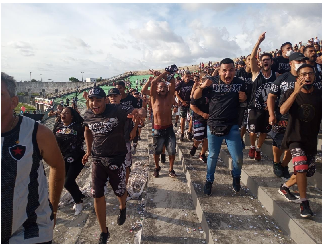
Figura 25 / “Ei, playboyzada, tira o cu da arquibancada” / Phelipe Caldas / 6 de março de 2022

O objetivo é simbólico, mas também é de ordem prática. Porque, acima de tudo, respeita a regra das torcidas organizadas de serem vistas, de se tornarem destacáveis e perceptíveis dentre tantas identidades postas numa mesma arquibancada. A ideia, pois, é que todos consigam perceber onde está a Jovem, possam reconhecê-la mesmo em caso de estádio lotado. Que um espectador vendo a cena de longe saiba exatamente qual é o território da TJB. Respeitando assim dinâmicas das organizadas que, tal como alardeado por Toledo (2022, p. 416), “dão os contornos de uma sociabilidade mais visível”.