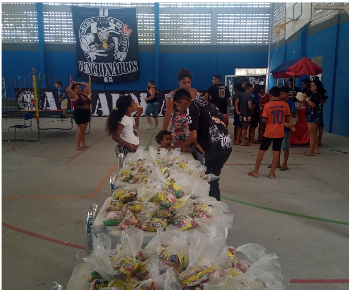
Figura 06 / BDF realiza ação social de Dia das Crianças para a própria comunidade, sem esquecer becas e bandeiras da torcida e do bonde / 22 de outubro de 2022

Outro detalhe que demonstrava o caráter comunitário do evento era a presença de quatro barbeiros contratados pelo bonde e que atendiam os presentes de forma totalmente gratuita ao longo de todo o dia. Eram profissionais especializados em cortes mais jovens, com “desenhos” e traços feitos com a ajuda de uma máquina de raspar cabelos e que atraíam principalmente os mais próximos da adolescência. Mesmo assim, muitas mães levariam os filhos pequenos para cortar o cabelo naquele dia, aproveitando a proximidade e a gratuidade do serviço e permitindo ainda mais a interação da ação social com os moradores dos Funcionários.