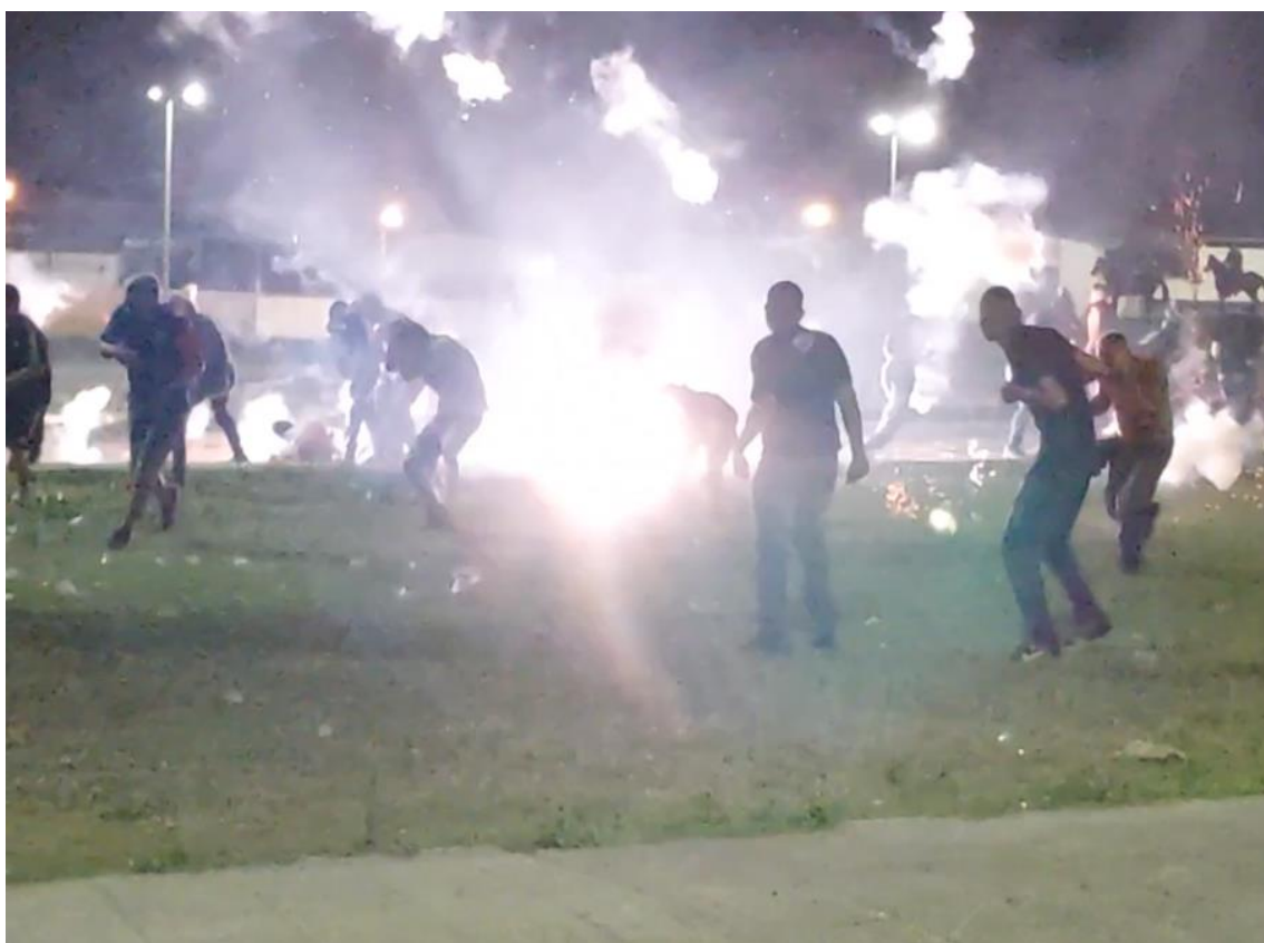
Figuras 32 e 33 / Pista entre TJB e Facção Jovem no entorno do Estádio Amigão, em Campina Grande / Phelipe Caldas / 26 de janeiro de 2023