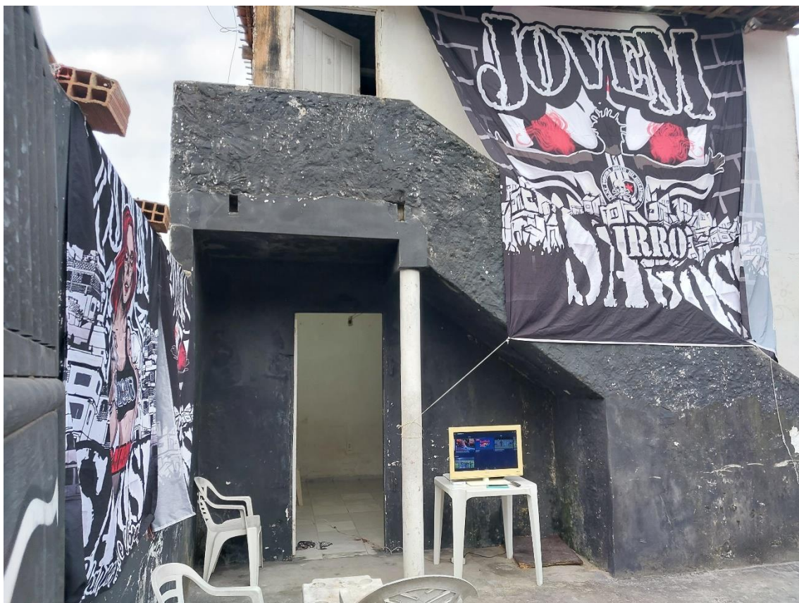
Figura 09 / Subsede da TJB no Bairro São José, em João Pessoa / 13 de agosto de 2022

– Você pode ficar tranquilo, viu? Você está em casa. Ninguém vai mexer com você não – disse-me solenemente, enquanto dava tapinhas acolhedoras e fraternais em minhas costas.