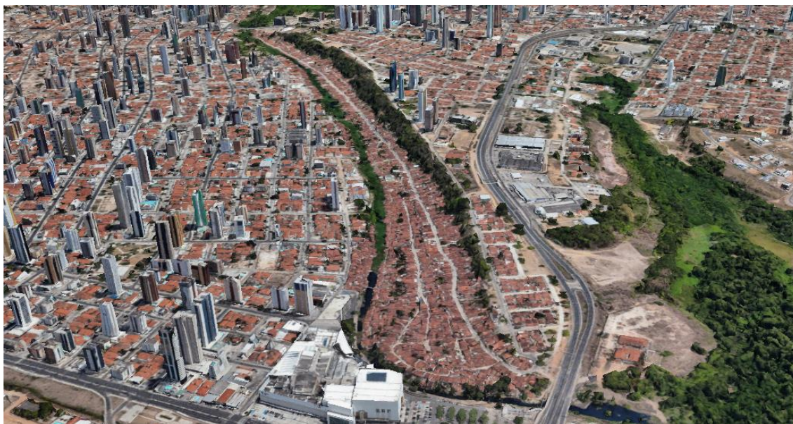
Figura 08 / Destacado pelas vegetações da falésia do lado direito e pelo rio do lado esquerdo, a fina e longa área que forma o bairro São José / Google Earth / 19 de julho de 2023

No que diz respeito à parte residencial, o São José é majoritariamente formado por algumas casas um pouco maiores, pequenos casebres e barracos de taipa, demonstrando inclusive algum nível de diferença econômica no interior do próprio bairro. Em períodos de muita chuva, ainda se vê ameaçado pelo risco de deslizamento de terra por parte da falésia e de alagamentos por parte do rio. Para além disso, acima da falésia estão os bairros de Brisamar e João Agripino e do outro lado do rio está o de Manaíra, todos considerados “nobres” e ocupados pelas chamadas classes média e alta da capital paraibana (Figura 08).