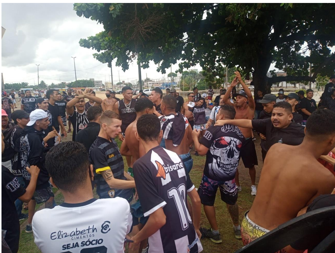
Figura 23 / Pé de Castanhola localizado perto do portão de entrada da Arquibancada Sol; o “point” da TJB, local de festas e de performances / 23 de abril de 2022

Por sinal, ainda que o futebol propriamente dito aconteça dentro do campo de jogo e só da arquibancada seja possível assisti-lo presencialmente, não é difícil perceber que, mesmo em dia de futebol, os torcedores invariavelmente passarão muito mais tempo do lado de fora da praça esportiva do que dentro. E, assim, tudo aquilo é ressignificado como a própria extensão da arquibancada. Ali também tem jogo, também tem esportificações, performances. Vivências em torno do clube e da própria torcida organizada.