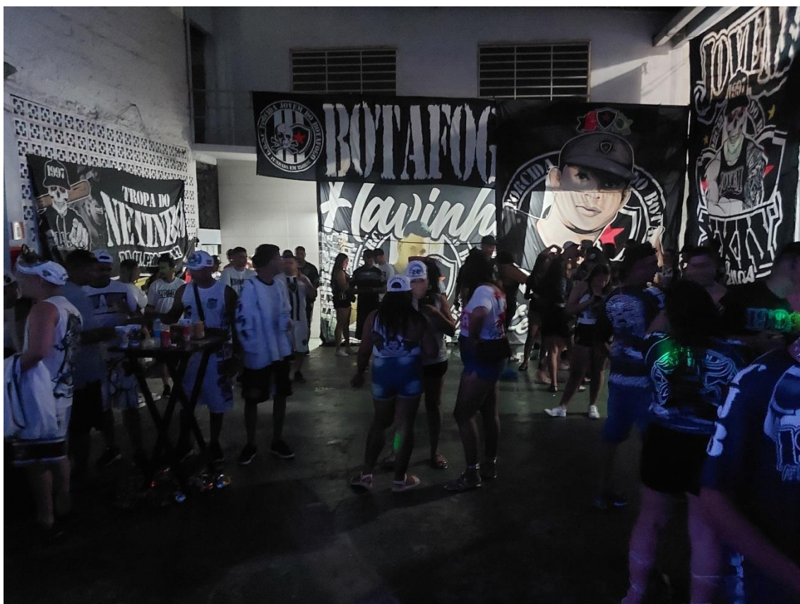
Figura 10 / Passados os momentos de arrebatamento do baile, cada torcedor fica mais perto de seu bonde e de suas bandeiras / Phelipe Caldas / 26 de novembro de 2022

Volto aqui, rapidamente, à cena que abre esta tese, naquela performance arrebatadora no baile de 2022 da TJB. Naqueles 15 minutos de euforia que eu descrevi, gritava-se o nome da torcida justamente porque aquele era um momento produzido pelo puxador para a exaltação da coletividade torcedora visando outras coletividades aliadas que estavam ali presentes. Na maior parte da festa, contudo, os integrantes dos bondes permaneceram mais coesos entre si, perto de suas bandeiras de bairros, evidenciando a segmentação em um contexto interno da agremiação (Figura 10).