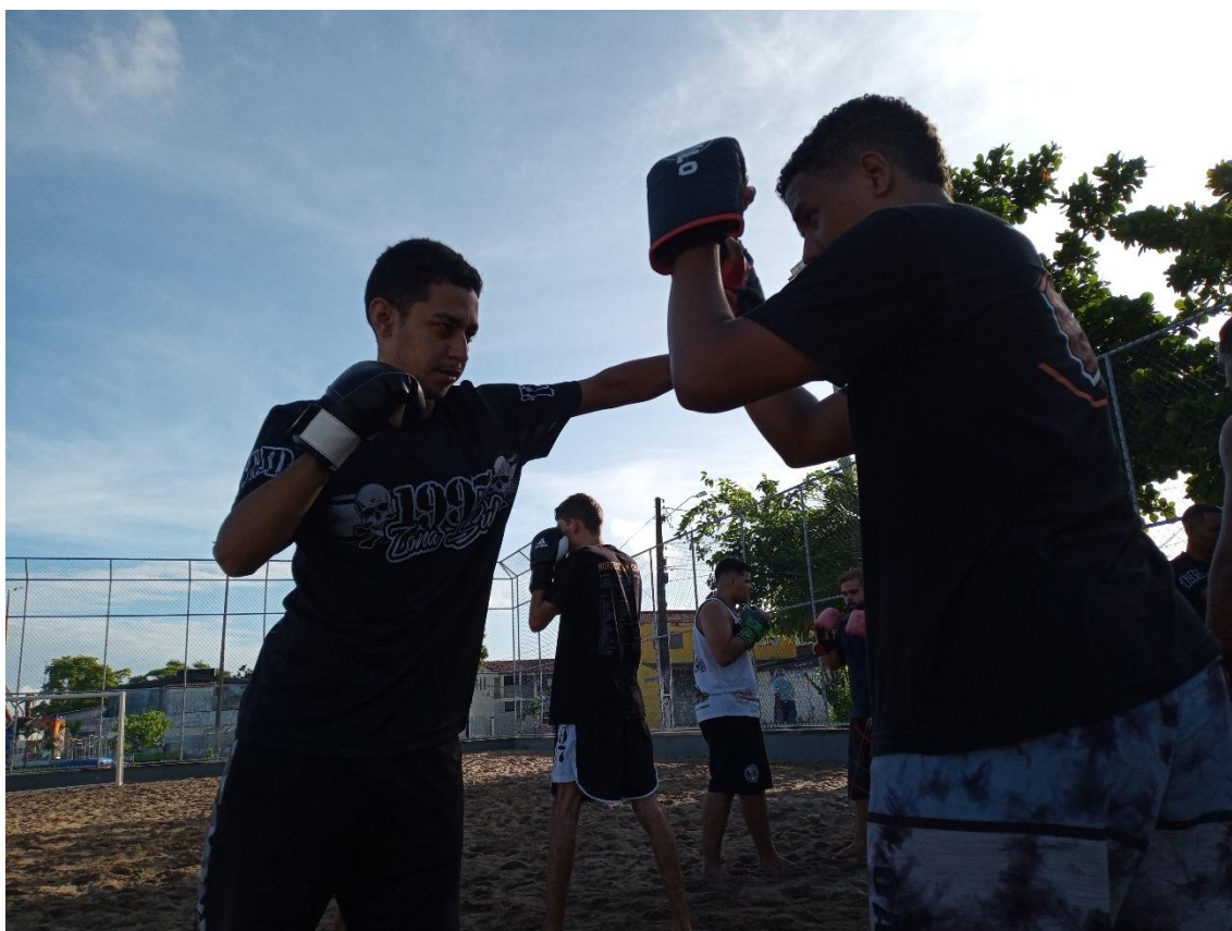
Figura 04 / Treino de kickboxing na Quadra de Areia da Praça Nova / Felipe Caldas / 30 de abril de 2022

O primeiro compromisso que eu tive com o BDF nos Funcionários 2, sem ser em dia de jogo, foi um treino de kickboxing realizado em 30 de abril de 2022 (Figura 04). Apesar da insistência dos dez torcedores presentes, eu não participei do treino, porque eu queria mesmo era observar os detalhes, as nuances daquela manhã de sábado.