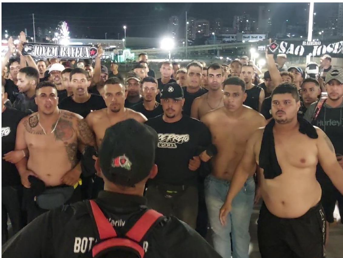
Figura 36 / Início da entrada da Jovem, em arrastão festivo, na arquibancada da Arena das Dunas, em Natal / 13 de maio de 2023

Nas semanas e meses seguintes, a Jovem iniciaria uma longa e bem-sucedida campanha para arrecadar R$ 12 mil para custear os reparos nos três ônibus. Antes, porém, precisaria honrar a torcida, mostrar destemor, se apresentar para o cântico, para o apoio, para exibir a faixa da Maioral na casa dos rivais e gritar, sempre que possível, mais alto do que os donos da casa.