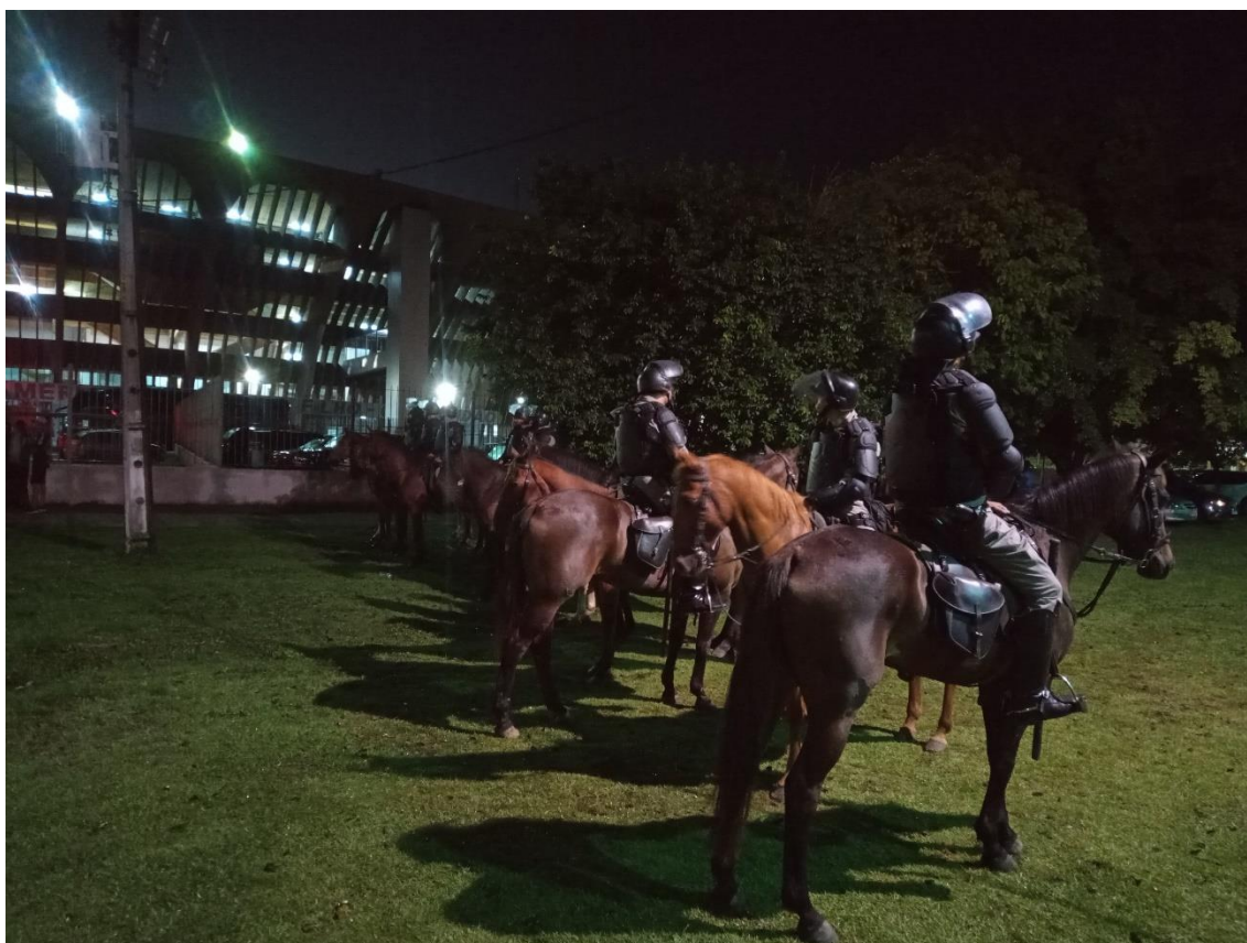
Figura 39 / Cavalaria é mobilizada para reprimir protesto da TJB antes mesmo de ele acontecer / 25 de maio de 2022

A mídia especializada, afinal, compra a ideia de que os torcedores são de fato “marginais” e que, conforme destacado por Pimenta (1997, p. 17), cabe mesmo à PM o papel de “órgão legalmente constituído para disciplinar, no calor do acontecimento, a violência dos agrupamentos de torcedores”. Claro, não todo torcedor. Acima de tudo, o torcedor pobre, periférico, negro. Enfim, basicamente, o torcedor organizado de pista. É isso o que pretendo abordar agora.