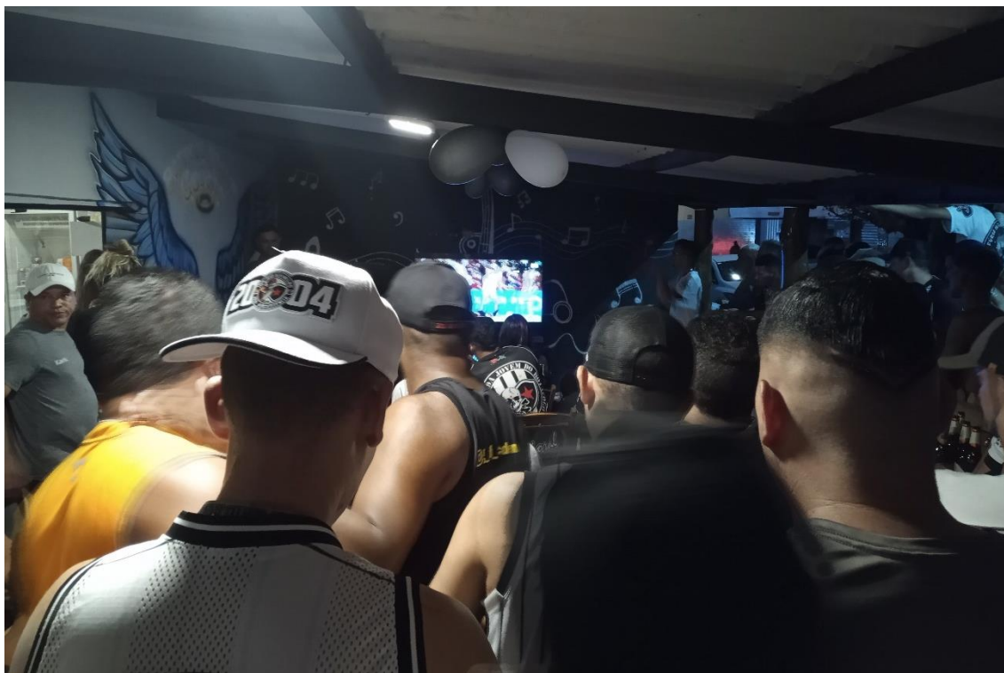
Figura 13 / Proibidos de viajar a Campina Grande, torcedores organizados do Belo assistem à final de 2022 em bar de Cruz das Armas / Phelipe Caldas / 21 de maio de 2022

O pessoal do BDF, alegando que o local era muito distante, preferiu assistir ao jogo na casa de um de seus integrantes, no próprio bairro dos Funcionários, mas, como eu sabia que a minha pesquisa era muito mais próxima e frequente com eles, naquela vez eu optei por ir ao encontro na Zona Oeste.