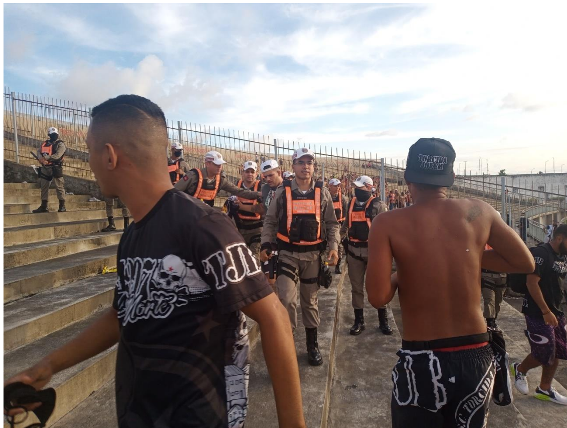
Figura 41 / Provação torcedora dos botafoguenses é reprimida por policiais militares paraibanos / 6 de março de 2022