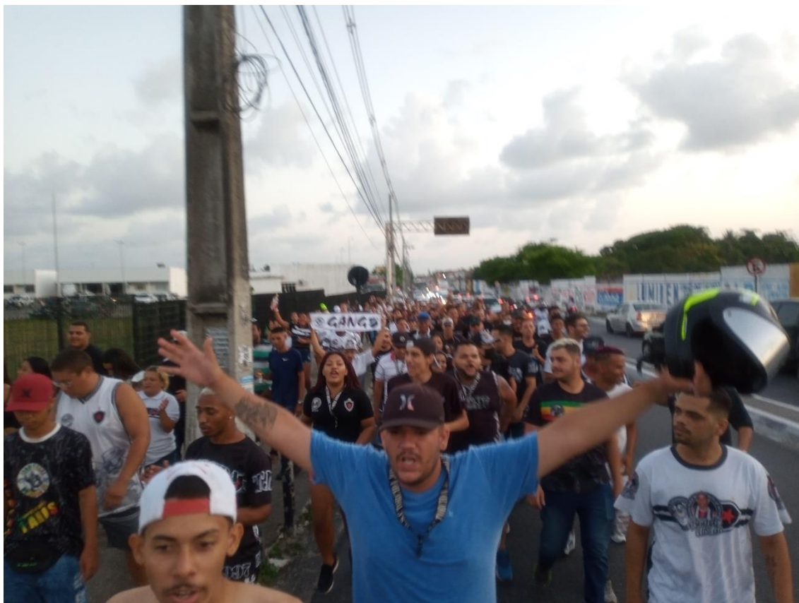
Figura 12 / À medida que outras identidades se unem à mobilização, aumenta o número de pessoas, modificam-se as músicas a serem cantadas / 15 de fevereiro de 2022

E essa é uma constatação que me foi dada pelo próprio campo, no exato momento em que, às cinco e vinte da tarde, todas aquelas múltiplas identidades começariam o arrastão final até o Almeidão (Figura 12). Porque, justo nesse instante, um torcedor da TJB, mais desavisado, tentou puxar o hino da torcida, no que foi repellido de forma imediata e até violenta por um colega ao lado.