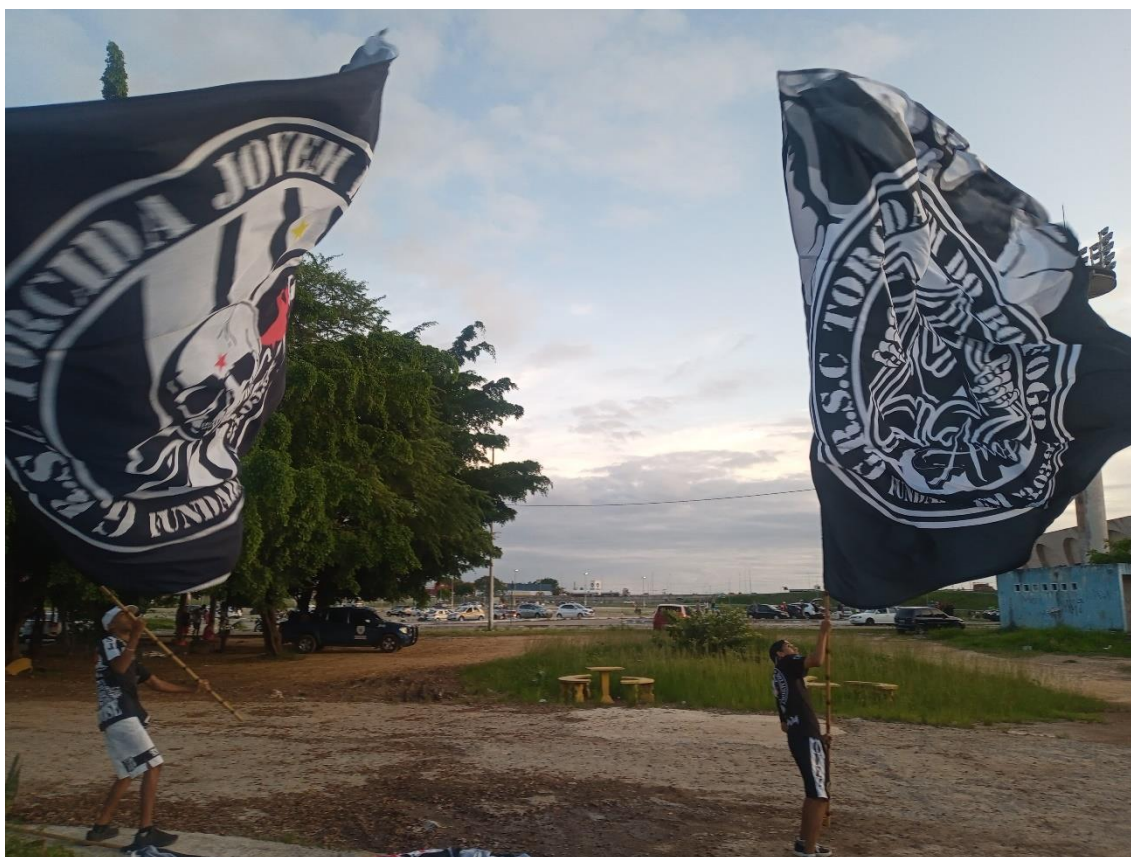
Figura 24 / Mesmo vetadas de entrar no estádio naquele momento, bandeiras da TJB são agitadas no entorno da Arquibancada Sol / 23 de março de 2022

Tal como no jogo contra o ABC-RN, portanto, naquele dia de aniversário da TJB, eram muitas as bandeiras sendo empunhadas do lado de fora do estádio (Figura 24). E, mesmo que elas não pudessem ir para dentro do Almeidão, e que por isso fosse teoricamente mais simples nem levá-las para o local, havia toda uma valorização daqueles símbolos e que justificava o esforço de exibi-las durante a festa pré-jogo e, depois, nas redes sociais da torcida.