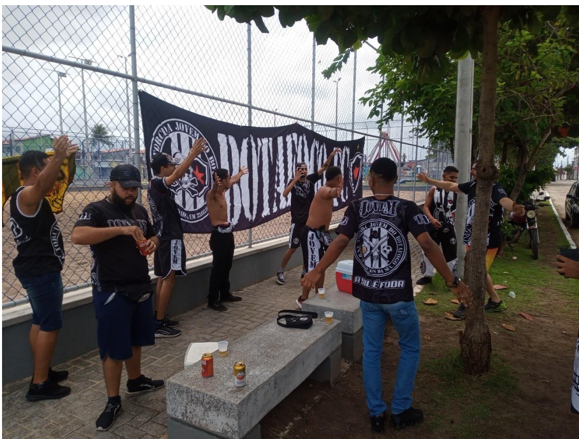
Figura 02 / Sociabilidade torcedora do BDF na Praça Nova, antes de jogo contra o Confiança-SE pela Série C de 2022 / Phelipe Caldas / 23 de abril de 2022

É, afinal, um tempo para exibir os troféus num espaço da cidade tomado como sendo deles. O tempo ampliado do torcer subverte a praça e dialoga com o espaço. Dialoga também com performances vividas em instantes presentes, reatualizadas enquanto celebração de conflitos já vividos e ainda por viver. Em rituais que se repetiriam muitas outras vezes ao longo da pesquisa (Figura 02).