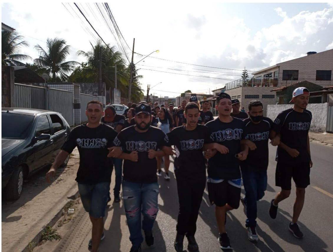
Figura 11 / Arrastão dos integrantes do BDF pelas ruas de João Pessoa / 15 de fevereiro de 2022

Pois, voltando a minha descrição sobre as experiências vividas naquela tarde que renunciava o jogo contra o Fortaleza, eu e mais uns 25 torcedores do BDF deixamos a nossa concentração por volta das três da tarde. Caminhávamos pelo meio da rua, fechando uma das duas faixas da via, deliberadamente saindo da calçada para se fazer perceber enquanto coletividade (Figura 11).