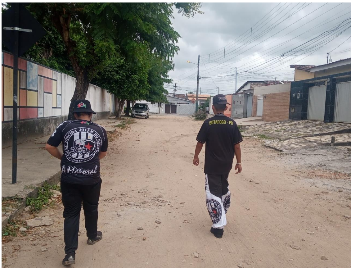
Figura 07 / Foto tirada ainda no bairro, pouco antes de adentrar na comunidade e ser orientado a guardar o celular / 22 de outubro de 2022

Por exemplo, em certo momento, um grupo de três torcedores foi à casa de Rodrigo Maia, à época coordenador do BDF e que morava ali bem perto, para pegar mais panelas com carne moída e com salsichas para seguir servindo cachorro-quente para as crianças. Como eu achei que poderiam precisar de ajuda, ofereci-me para ir junto, o que foi aceito. E, enquanto caminhava, eu tirava algumas fotos da vizinhança (Figura 07).