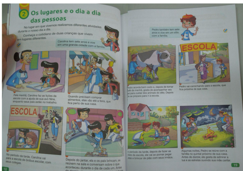
Figura 4: Representação de Carolina e Pedro

Fonte: Livro de história, Pitangá Mais, terceiro ano (Martinez; Garcia, 2021)