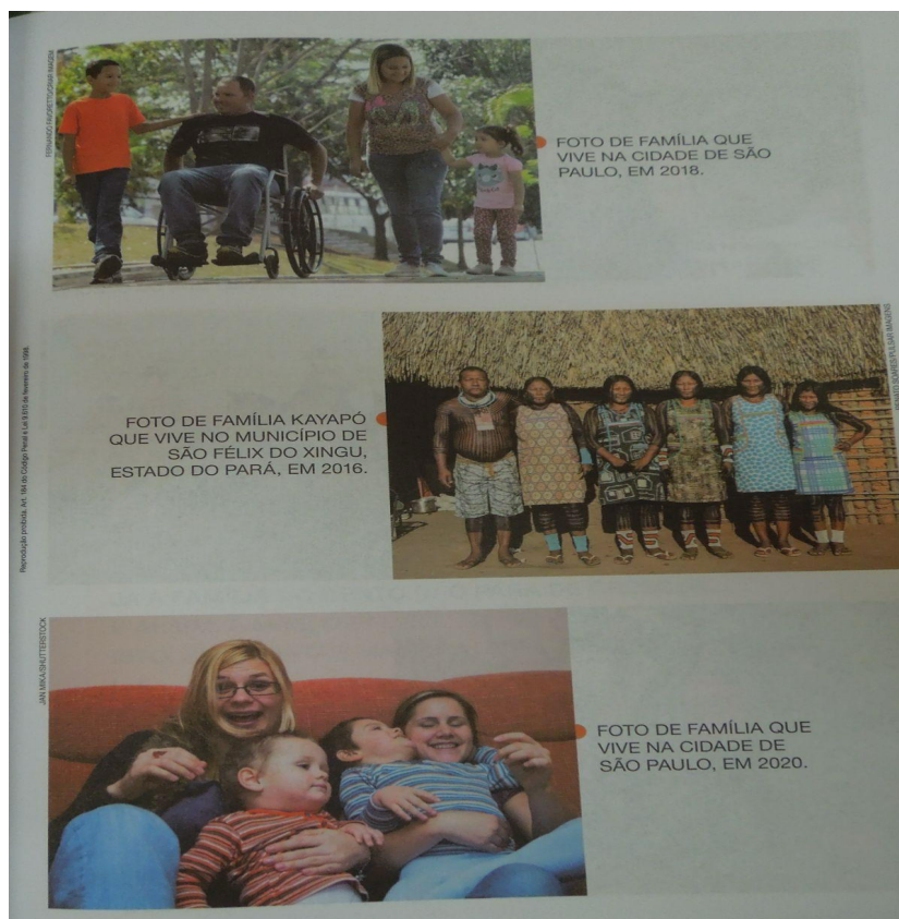
Figura 6: Representação de outras famílias pelo Brasil