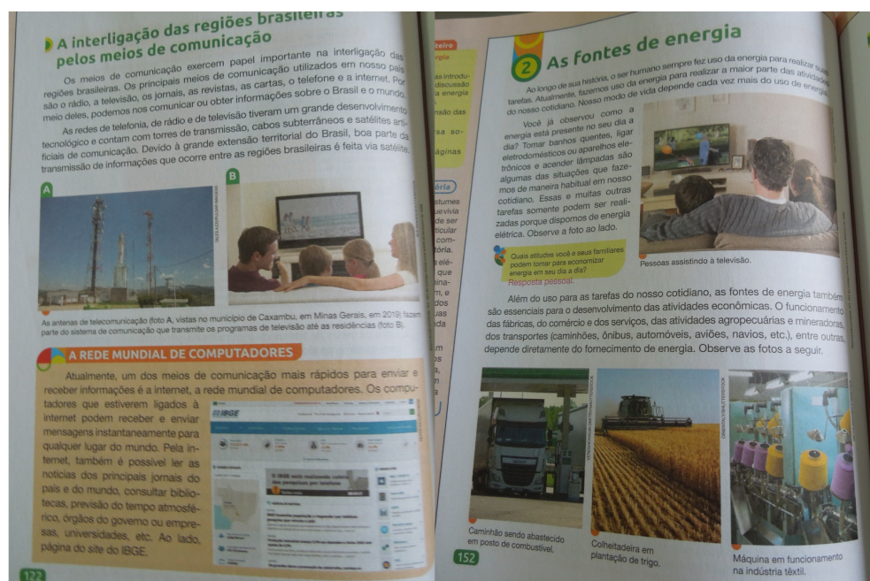
Figura 3: Famílias que assistem televisão enquanto estão sentadas em sofás