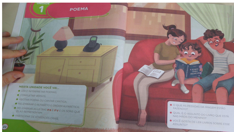
Figura 1: Representação de uma família em um sofá, envolvidos na leitura de um livro