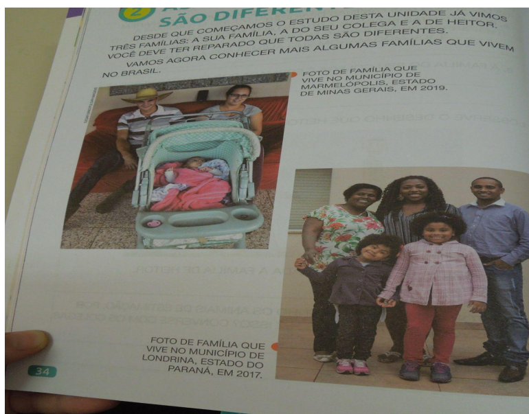
Figura 5: Família que vive no município de Londrina, Estado do Paraná