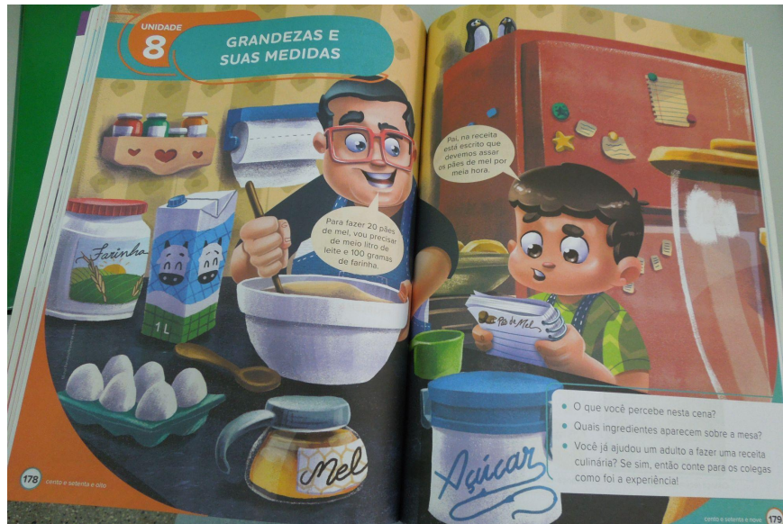
Figura 7: Pai e filho preparando uma receita