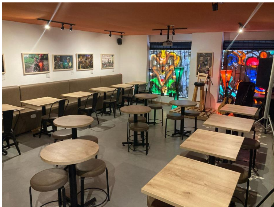
Figura 4- Casa Cultural La Roja

Essa experiência empírica permite refletir sobre como iniciativas como o Espacio Cultural La Roja (Figura 4) operam como “territórios insurgentes de paz” (DURÁN, 2020), promovendo novas formas de relação entre campo e cidade, entre economia e memória, e entre consumo e compromisso com a justiça social.