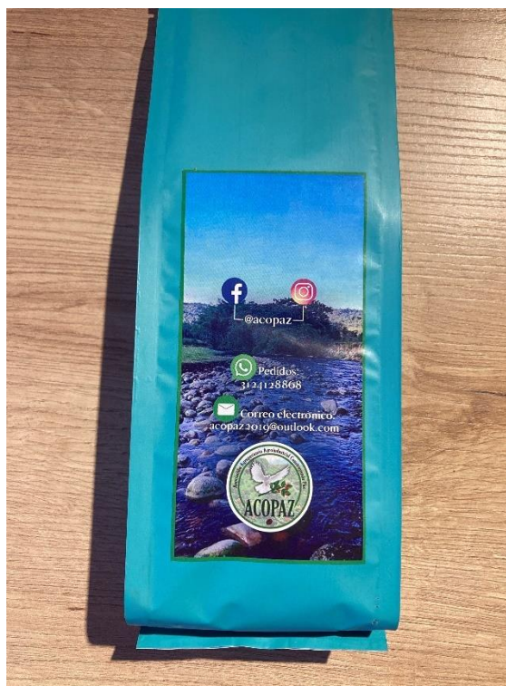
Figura 1- Café da Acopaz