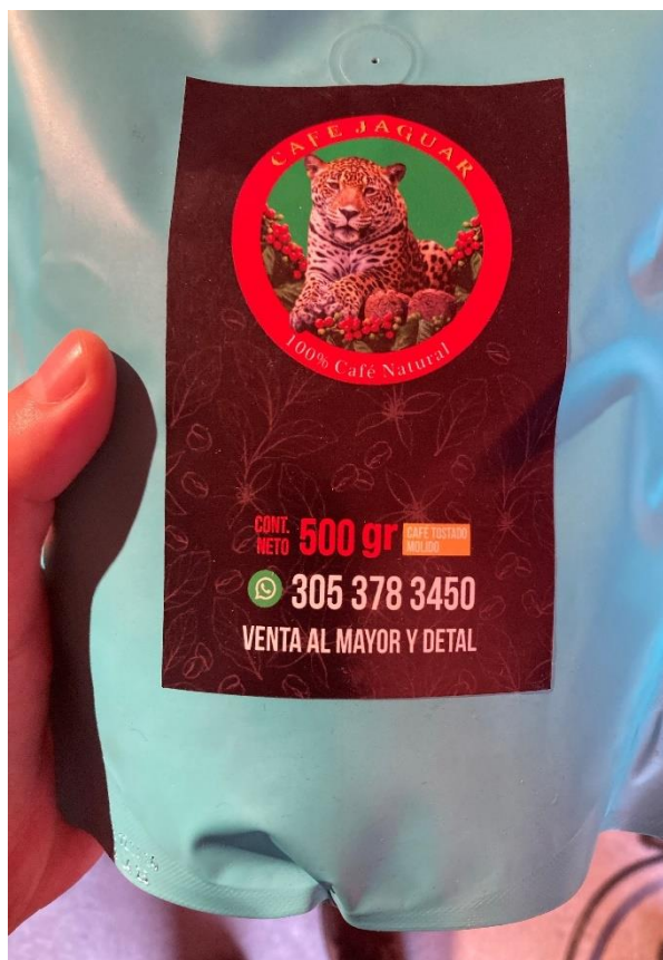
Figura 3- Café Jaguar