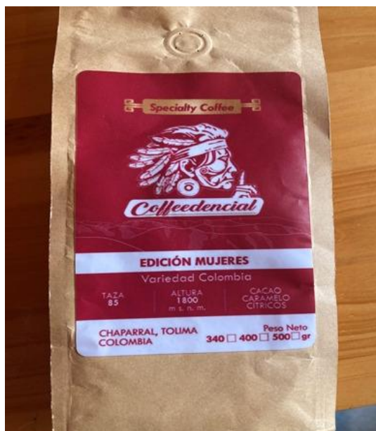
Figura 2- Café Coffedencial