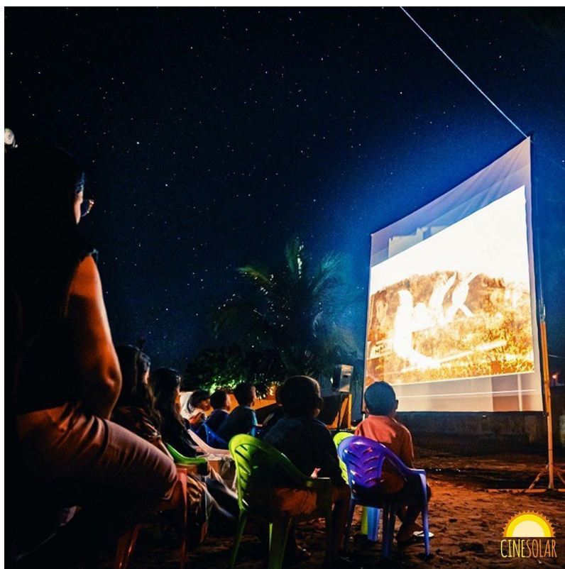
Figura 9 - Apresenta uma das exibições do projeto no interior de São Paulo.