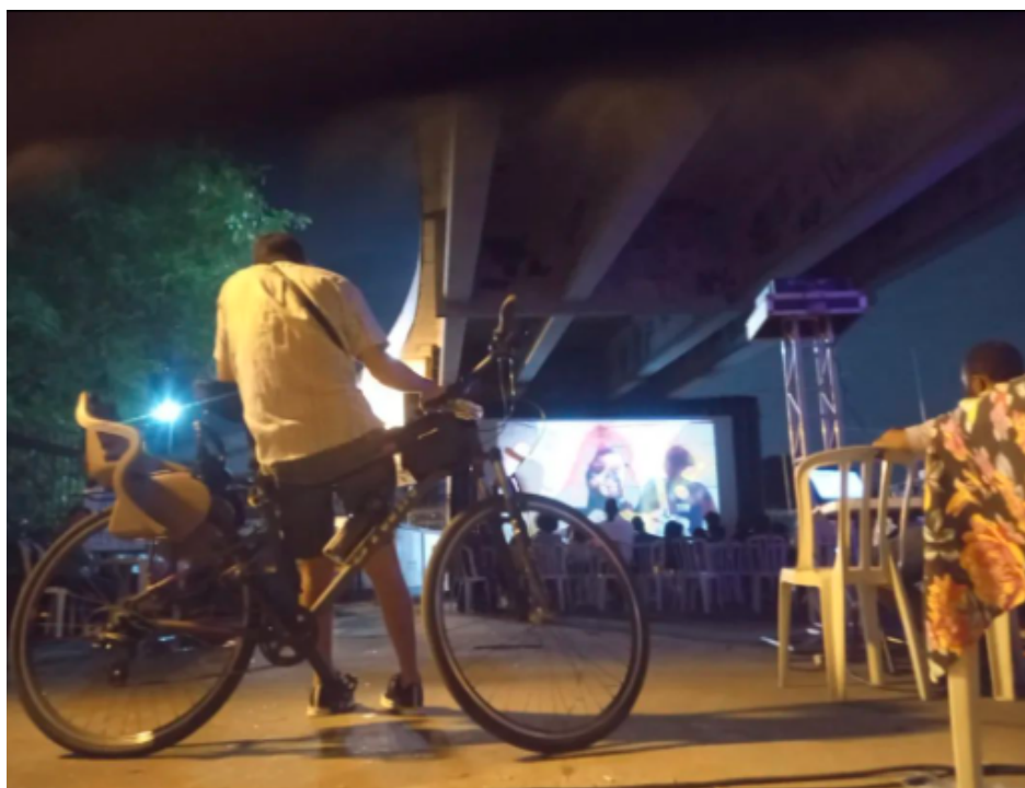
Figura 6 - Apresenta uma das exibições do projeto no espaço cultural Viaduto de Realengo - RJ.