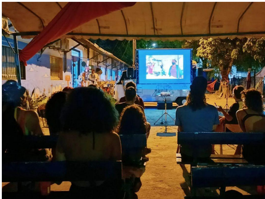
Figura 1 - Apresenta uma das exibições do projeto em Olinda - PE.