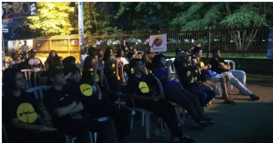
Figura 5 - Apresenta uma das exibições do projeto no espaço cultural Viaduto de Realengo - RJ.