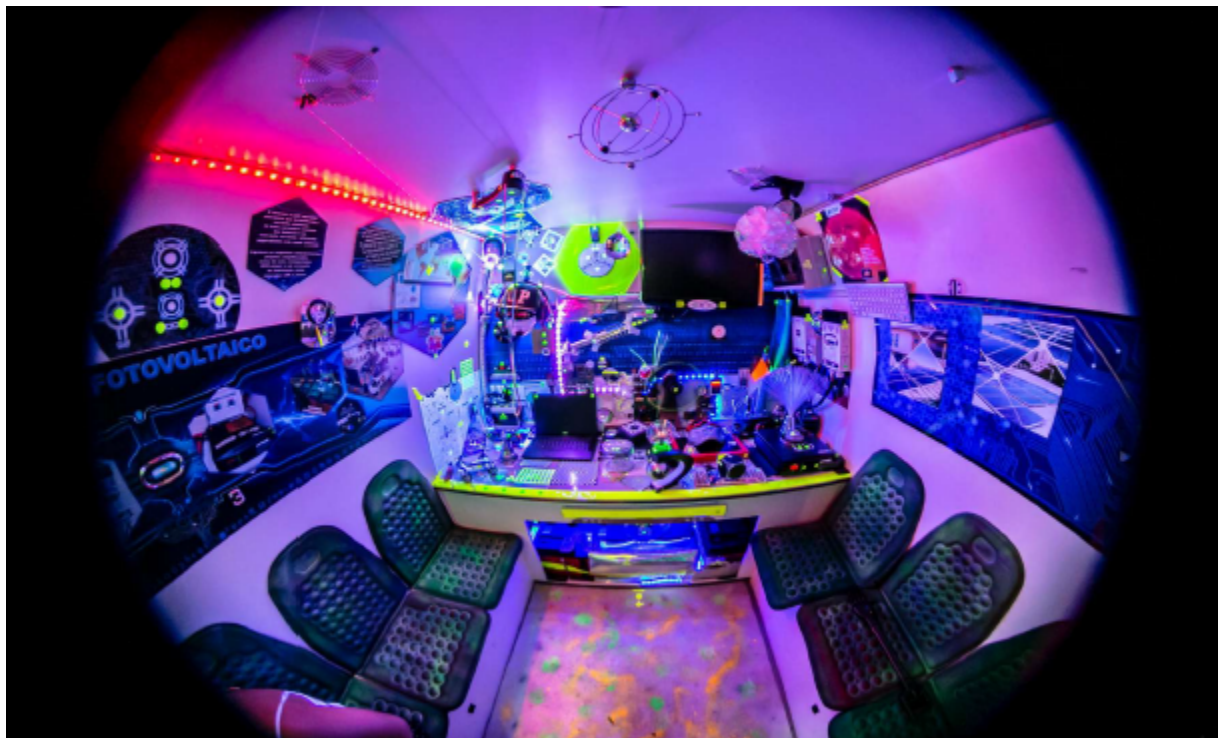
Figura 7 - Apresenta a parte interna do furgão que contém a estação de tecnologia do projeto de uma das vans móveis.