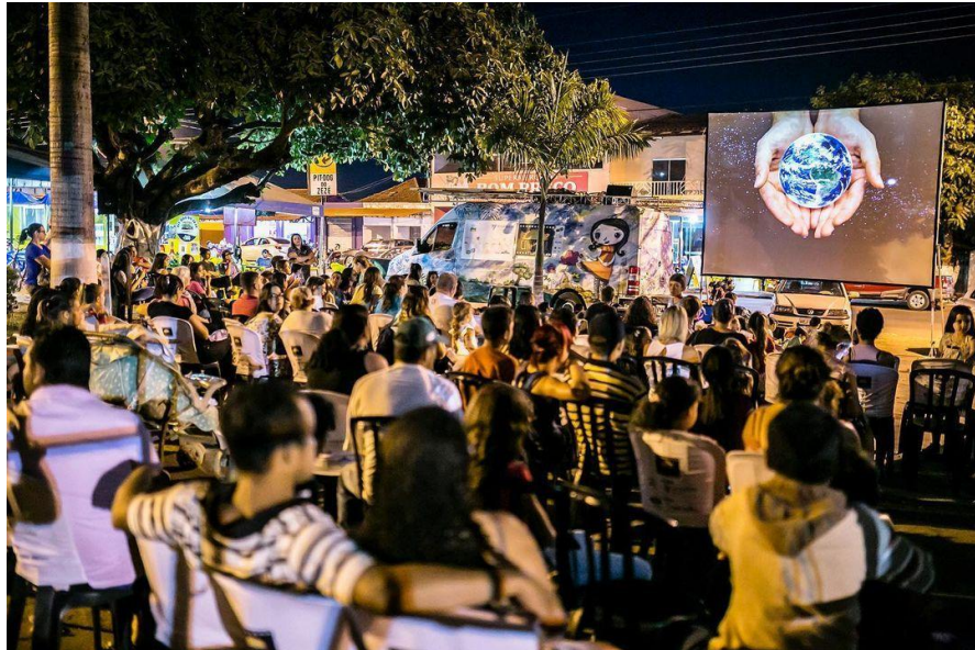
Figura 10 - Apresenta uma das exibições do projeto no interior de São Paulo.