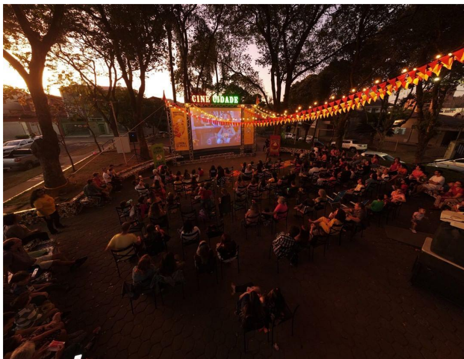
Figura 3 - Apresenta uma das exibições do projeto na praça Daniel Rabelo, Cariru em Ipatinga - MG.

(fonte: instagram do projeto: @mostracinecidade).