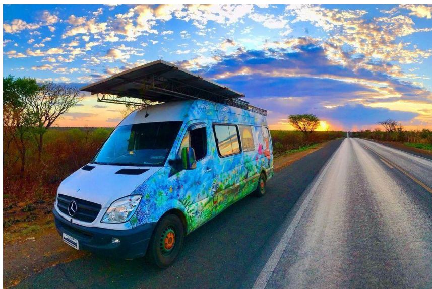
Figura 8 - Apresenta uma das estações móveis do projeto, Tupã.