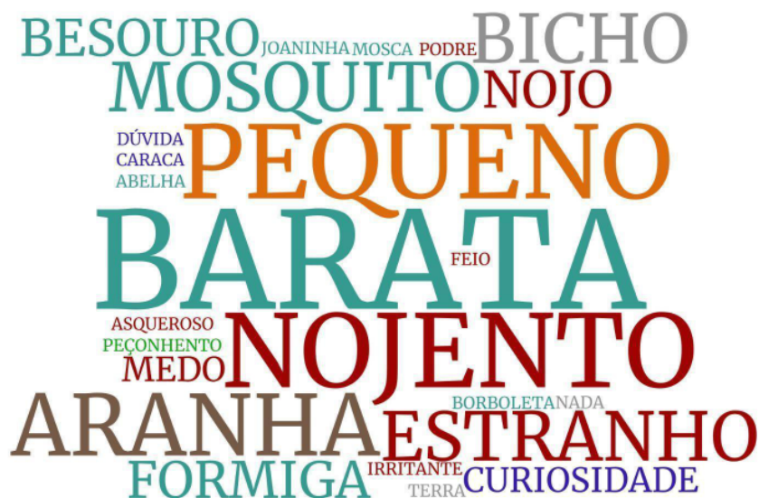
Figura 3 - Nuvem de palavras das evocações realizadas na questão 1 do diagnóstico prévio. As cores correspondem às categorias: Afetiva negativa - vermelho; Afetiva positiva - azul escuro; Descritiva Morfológica - laranja; Exemplar inseto - Verde-água; Exemplar não-inseto - marrom; Funcional/Ecológica - verde; Inconclusivo - cinza