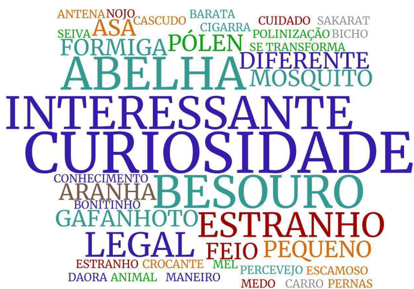
Figura 4 - Nuvem de palavras das evocações realizadas na questão 1 da avaliação final. As cores correspondem às categorias: Afetiva negativa - vermelho; Afetiva positiva - azul escuro; Descritiva Morfológica - laranja; Exemplar inseto - Verde-água; Exemplar não-inseto - marrom; Funcional/Ecológica - verde; Inconclusivo - cinza