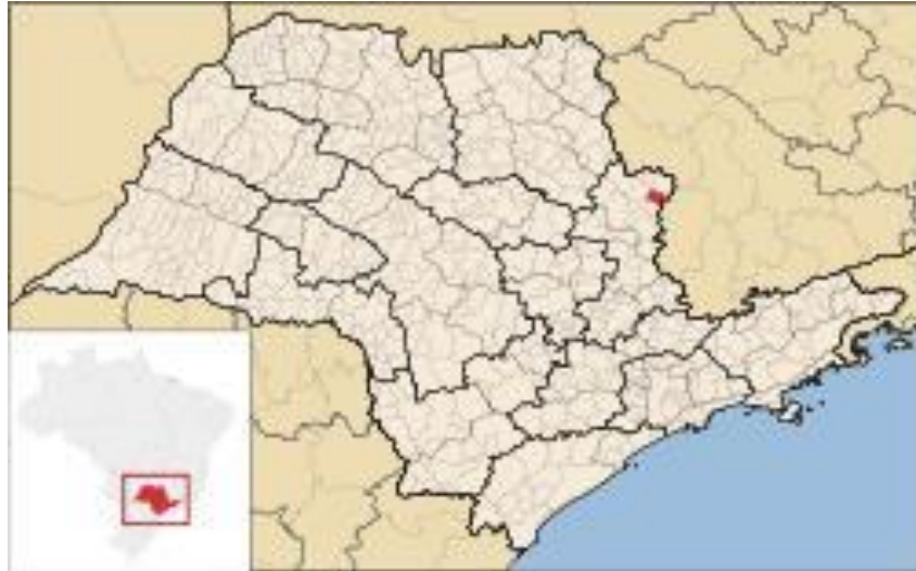
Figura 1 – Mapa do estado de São Paulo.

Até 2009, o município possuía 6 estabelecimentos de saúde conveniados ao Sistema Único de Saúde (SUS) (IBGE, 2009). O mapa abaixo ilustra o estado de São Paulo, o ponto vermelho que está localizado a cidade de Divinolândia: