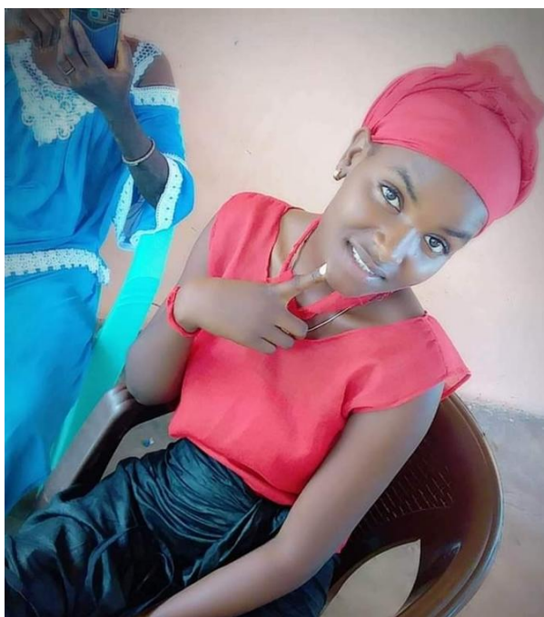
Figura 4 – Vestimenta de segundo ao sétimo dia depois do casamento

A figura 4 que mostra Vestimenta de segundo ao sétimo dia depois do casamento.