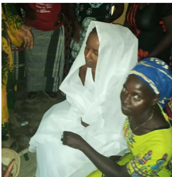
Figura 3– Vestimenta do dia do casamento

Outra coisa importante nesta questão é que, no momento do casamento, cada pessoa quer se vestir como noiva do seu grupo étnico. No caso da noiva Fula, usa dois pedaços de tecidos brancos, um na parte de cima e outro na parte de baixo, com essa roupa ela é levada para o seu marido. No dia seguinte, troca essa roupa por outra, um pano preto na parte de baixo, uma blusa vermelha e um lenço vermelho na cabeça. Na figura 3 demonstramos a vestimenta do dia do casamento. A figura 3 ilustra a vestimenta do dia do casamento.