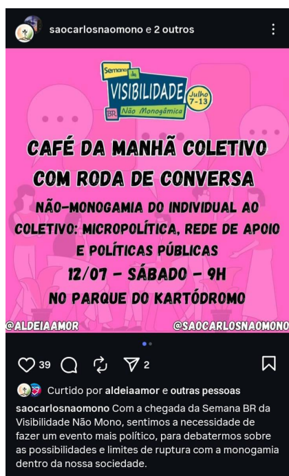
Captura de tela realizada em outubro de 2025.