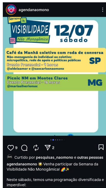
Captura de tela realizada em outubro de 2025.