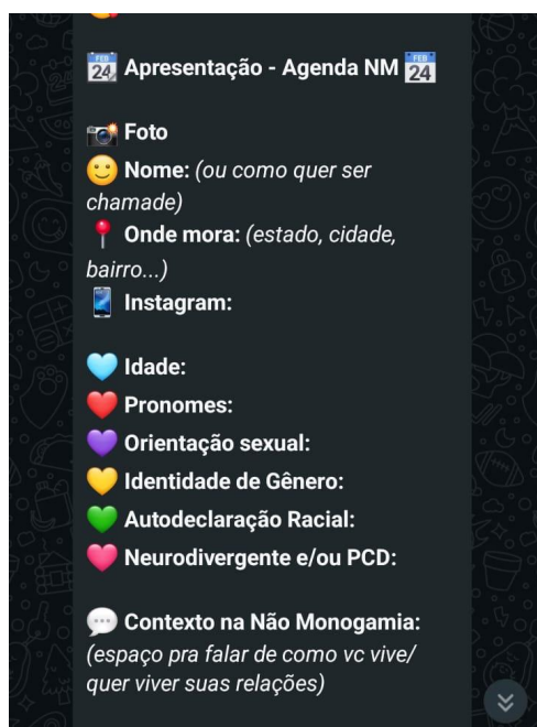
Captura de tela realizada em outubro de 2025.

Além disso, os novos membros participam de uma apresentação coletiva realizada às sextas-feiras, momento em que todos se apresentam novamente para que os recém-chegados possam conhecer melhor os demais participantes. As interações entre os membros geralmente têm início com essas apresentações, o que possibilita que aqueles interessados em você ou nos seus temas iniciem uma conversa, criando uma oportunidade para fortalecer os laços entre os participantes. Além de facilitar a aproximação, essa apresentação também funciona como uma medida de controle, proporcionando uma sensação de segurança ao permitir que todos saibam quem são os integrantes do grupo. Todas essas informações ficam registradas nas mensagens do grupo.