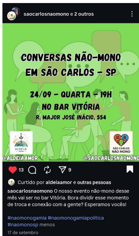
Captura de tela realizada em outubro de 2025.

Durante os eventos, inicialmente há uma apresentação, onde todos falam um pouco de si e sua experiência na não-monogamia. Durante as apresentações, percebi perfis variados e experiências diferentes entre as pessoas. Algumas já foram casadas monogamicamente por anos e só recentemente começaram a viver relações não-monogâmicas; outras também tiveram experiências monogâmicas, mas perceberam que esse modelo não era o ideal para elas. Já alguns participantes só tiveram vivências em redes não-monogâmicas. Alguns estão atualmente em relações afetivas ou sexuais, enquanto outros não, mas todos se consideram não-monogâmicos, independentemente do formato ou tipo de rede em que estejam inseridos. Pouco se falou em termos ou modelos relacionais específicos; o termo mais usado mesmo foi "não-monogamia".