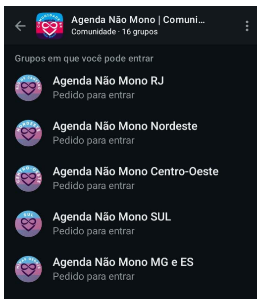
Figura 2 – Grupos dentro da comunidade Agenda Não Mono no WhatsApp

Captura de tela realizada em outubro de 2025.