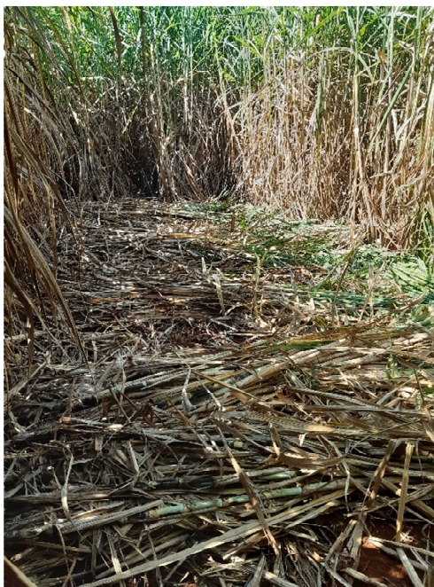
Figura 9. Parcela com colmos cortados, sendo 2 linhas de 8 metros.