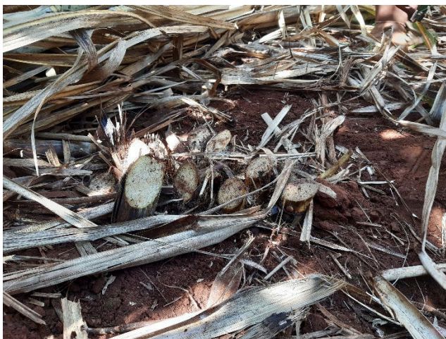
Figura 7. Altura dos 'tocos', após o corte dos colmos na base.

Corte : realizado com facão específico para essa atividade, simulando o corte de cana para colheita mecanizada, cortando-se a base do colmo e deixando em média 5 cm de colmo acima do solo (Figura 7).