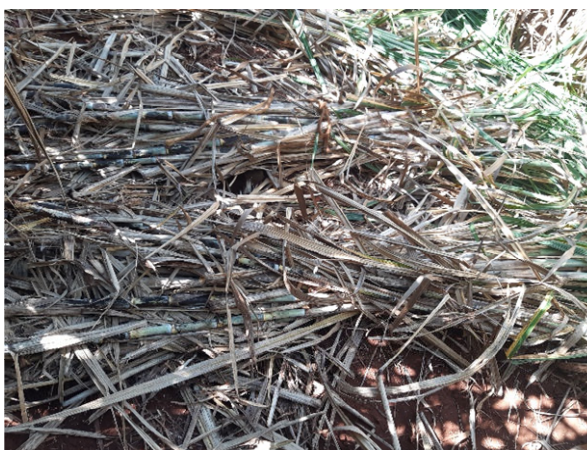
Figura 10. Feixes de cana amarrada, posicionados no chão, aguardando pesagem.

Pesagem: após o corte, os colmos de cada parcela foram agrupados em feixes e amarrados com corda (Figura 10), para facilitar a movimentação e suspensão do material durante a pesagem.