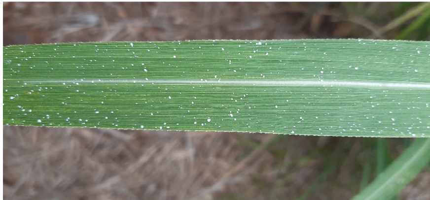
Figura 6. Disposição do produto pulverizado sobre folha da cana-de-açúcar.

Foi realizada em 30 de dezembro de 2022, por meio de aplicação aérea, utilizando-se uma aeronave agrícola da marca Air Tractor, modelo AT-802, usando bico de pulverização de jato reto, modelo CP-09, para uma vazão de 21,15 L ha -1 . Altura de voo foi de 4 metros acima do alvo, e a faixa de aplicação foi de 30 metros de largura, iniciando às 07:00 horas da manhã no local avaliado. A disposição do produto aplicado sobre a superfície foliar da cana-de-açúcar pode ser verificado na Figura 6.