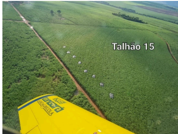
Figura 2. Imagem aérea do experimento 1, visualizando a disposição de lonas durante a pulverização, no talhão 15.