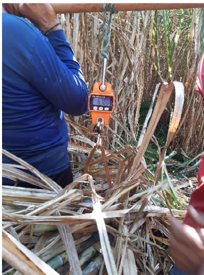
Figura 11. Pesagem individual de cada feixe de cana, usando-se balança digital suspensa.

Após a pesagem, os toletes foram posicionados sobre a linha de cana cortada, para serem aproveitados no momento da colheita mecânica.