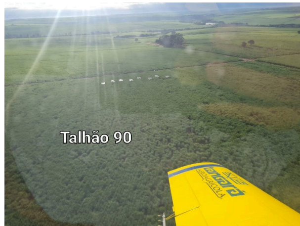
Figura 3. Imagem aérea do experimento 2, visualizando a disposição de lonas durante a pulverização, no talhão 90.