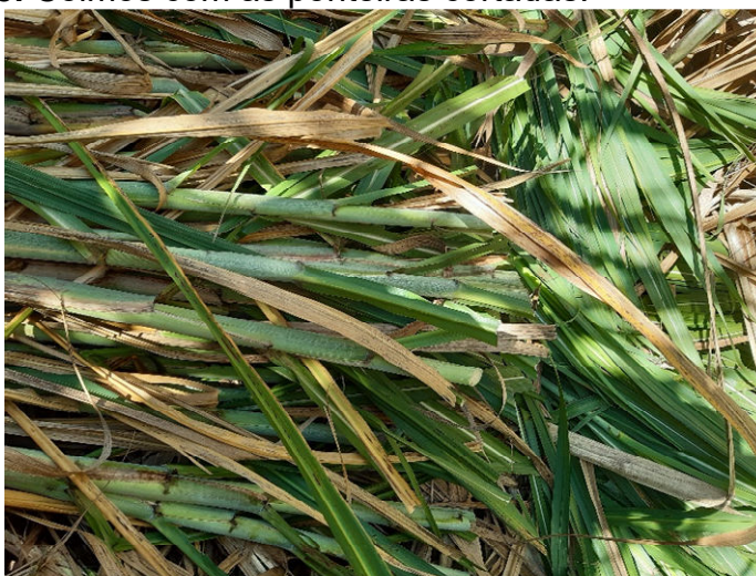
Figura 8. Colmos com as ponteiros cortadas.

Cortando-se também a ponteira, parte superior do colmo, para eliminar as folhas (Figura 8).