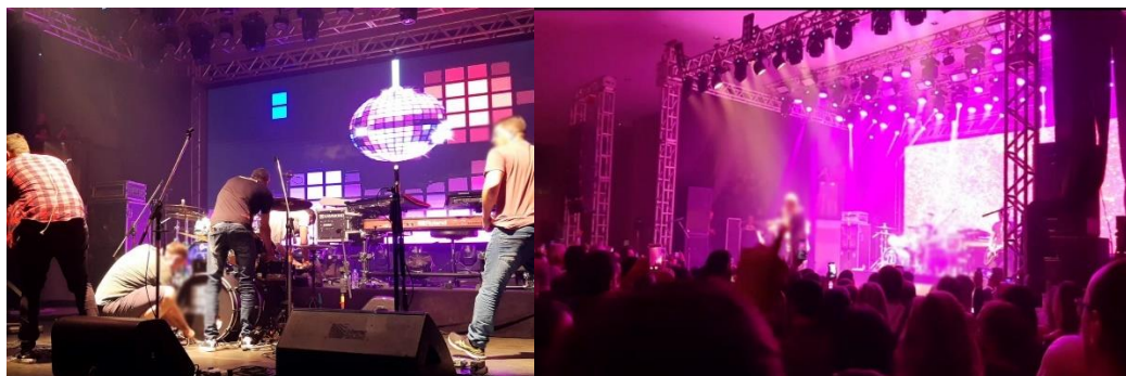
Imagem 3 — Técnicos de som e comportamento do público em show de banda de sucesso nacional.

Essa realidade contrasta com a da maioria dos artistas, que precisam realizar seu próprio trabalho técnico e braçal, ficando "invisíveis" nesses momentos e trabalhando mais intensamente. Eles geralmente chegam antes do público para realizar essas atividades e, no final do show, se estiverem em um bar, as luzes do palco diminuem enquanto desmontam os equipamentos. Nesses casos, o público volta a socializar e não presta atenção no palco ou nos músicos, que podem sair sem muitas abordagens por parte dos presentes.