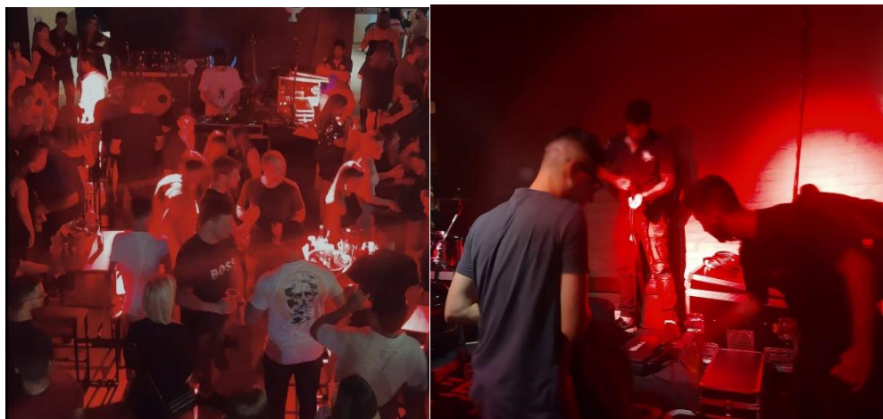
Imagem 2 — Público concentrado no palco no show de Ciro.