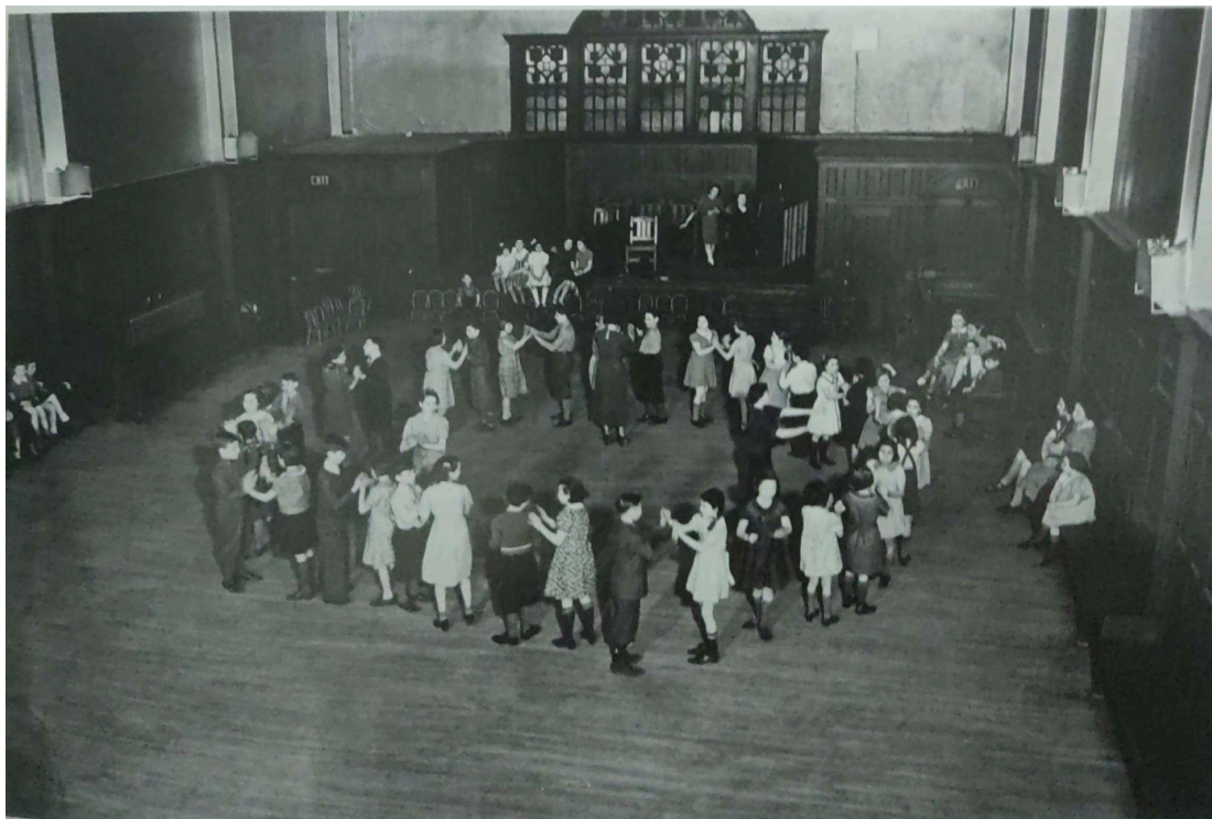
Figura 3: Baile. Descrição: Uma aula de dança aberta no salão Bowen Hall, da Hull House. Autoria: Wallace Kirkland. Fonte: The many faces of Hull House , item 41.