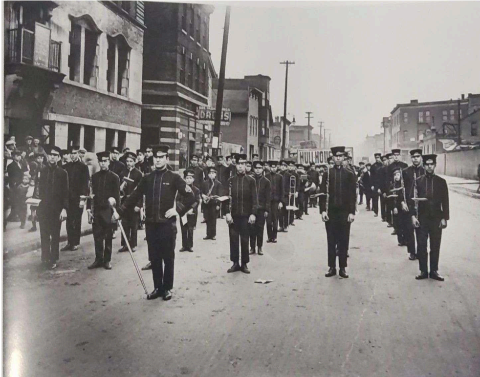
Figura 2: Desfile da banda. Descrição: A banda marcial The Hull-House Boy 's Band , composta por 60 meninos instrumentistas, desfilando vestindo uniformes, na rua da Hull House . Autoria: Wallace Kirkland. Fonte: The many faces of Hull House , item 32.

A equipe da Hull House ofertava arte e especificamente, atividades musicais, através do estabelecimento do Teatro Hull House Theatre , da Escola de Música Hull House Music School , da Escola de Artes Hull House Art School e do acampamento de artes e música Hull House Arts and Music Camp . (KELLY & DOHERTY, 2016).