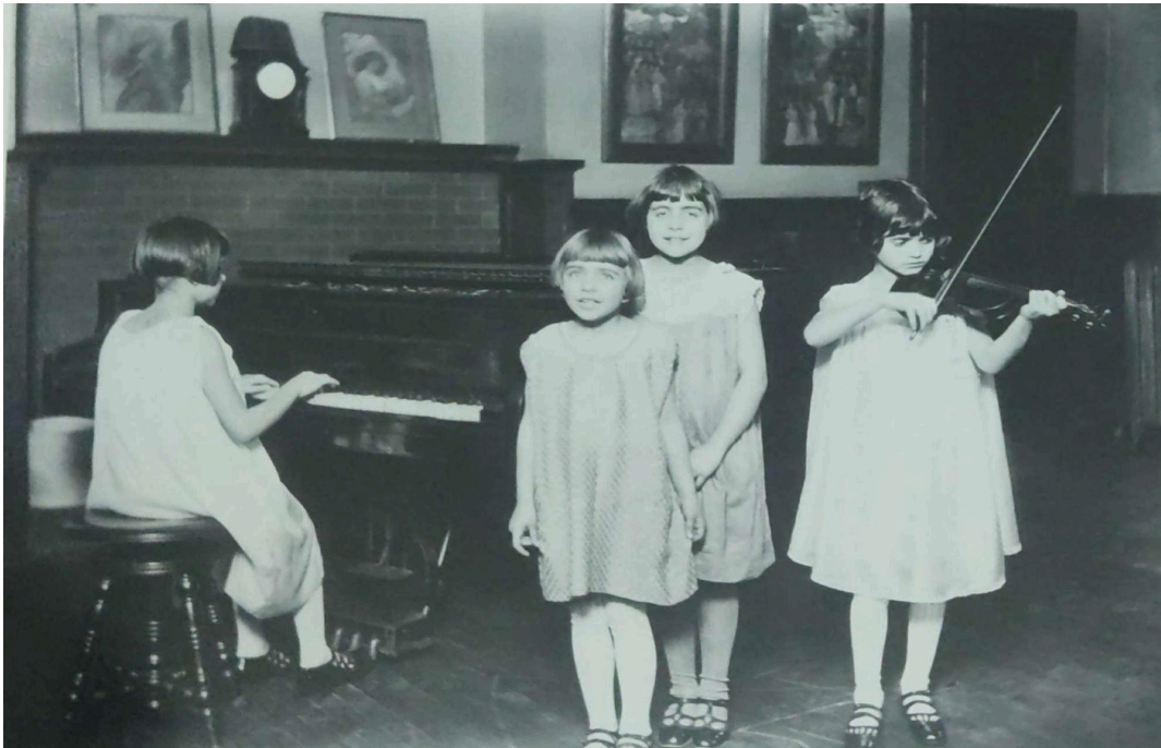
Figura 7: Meninas fazendo música. Descrição: Crianças estudantes da Escola de Música da Hull House. Autoria: Wallace Kirkland. Fonte: The many faces of Hull House, item 34.

É notável que as atividades musicais eram ofertadas principalmente para as crianças e jovens. A preocupação com as infâncias da Hull House também pode ser observada ao analisar algumas letras das canções, como no seguinte trecho de “ The shadow child ”: