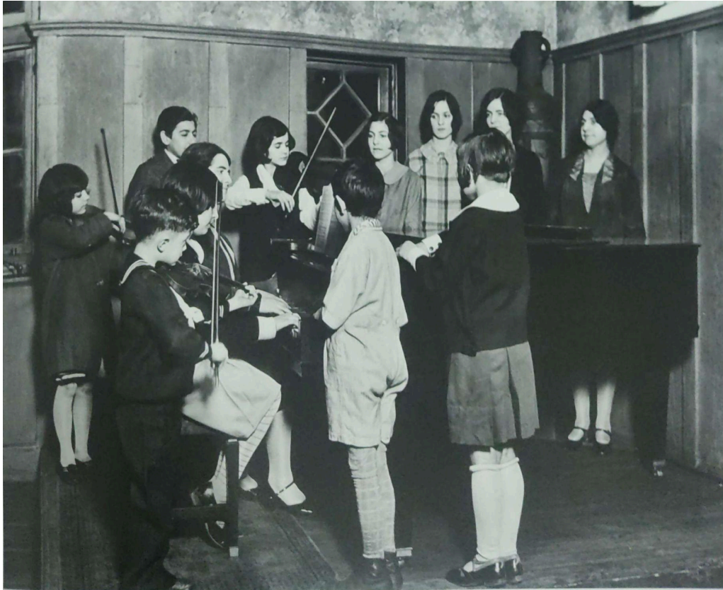
Figura 5: Performance em grupo. Descrição: Crianças e jovens reunidos ao redor de um piano, na Hull House.

Na década de 1930, a Escola de Música da Hull House havia crescido e aumentado suas ofertas de aulas a toda comunidade local que se interessasse. Havia aulas de canto individual, canto em coral, aulas de violino, violoncelo e concertos orquestrais (KELLY & DOHERTY, 2016).