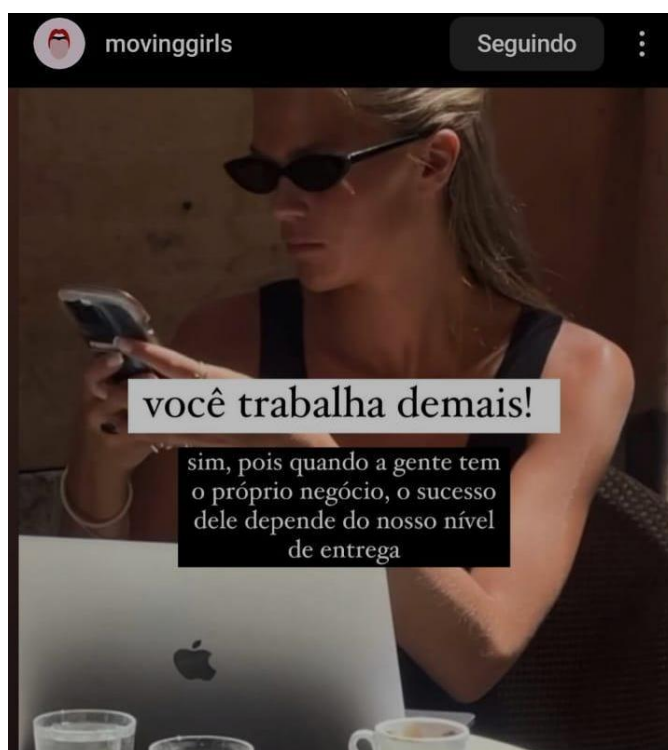
Figura 2: Publicação de 21 de abril de 2024 no perfil movinggirls.

Aliado a isso, a figura 2 ilustra publicações comuns nas redes sociais que apresentam longas jornadas de trabalho como símbolo de esforço e sucesso, reforçando a ideia de que a empreendedora deve estar totalmente dedicada ao seu negócio para alcançar reconhecimento. A imagem da empreendedora tem sido construída como a de uma mulher que trabalha integralmente em prol do empreendimento, cuja rotina deve estar inteiramente voltada à produtividade. Essa representação contribui para a formação de uma subjetividade marcada pela lógica da entrega total, em que a valorização do trabalho incessante é apresentada como sinônimo de mérito e realização pessoal.