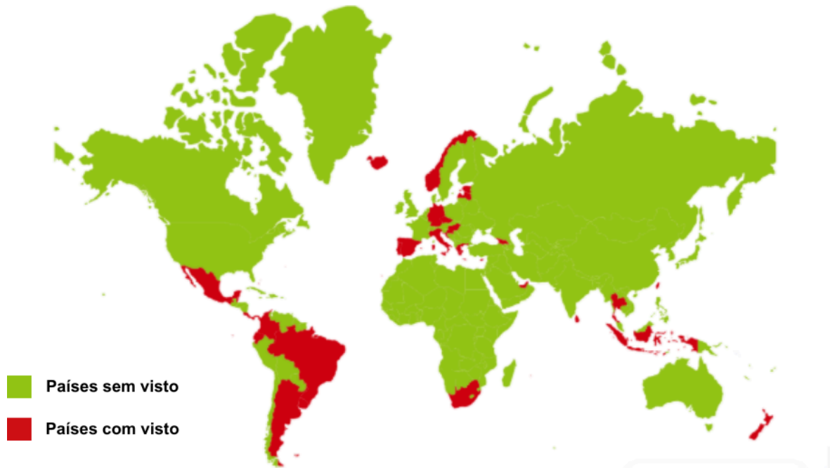
Figura 1 - Localização dos Países com Visto de Nômade Digital

Ao gerar uma figura geográfica destacando países com visto, fica ainda mais nítido o desfalque ao redor do mundo, também é possível identificar concentrações regionais, como no continente americano, a concentração maior de países com visto é na América Central e Caribe, bem como na Ásia, onde destacam-se países do sul e sudeste asiático, já na Europa há uma maior divisão geográfica. Na África não há países ao norte que possuem visto de nômade digital, apenas na região mais ao sul do continente.