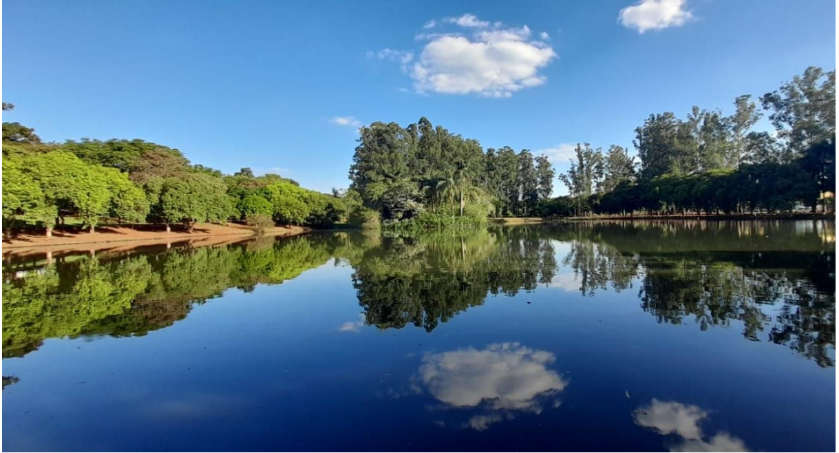
Figura 2: Lago presente no Parque

O mapa abaixo (figura 3), solicitado e disponibilizado pela Secretaria de Planejamento, Gestão e Mobilidade (2023), fornece uma visão ampla do Parque Ecológico, evidenciando todas as áreas do local: