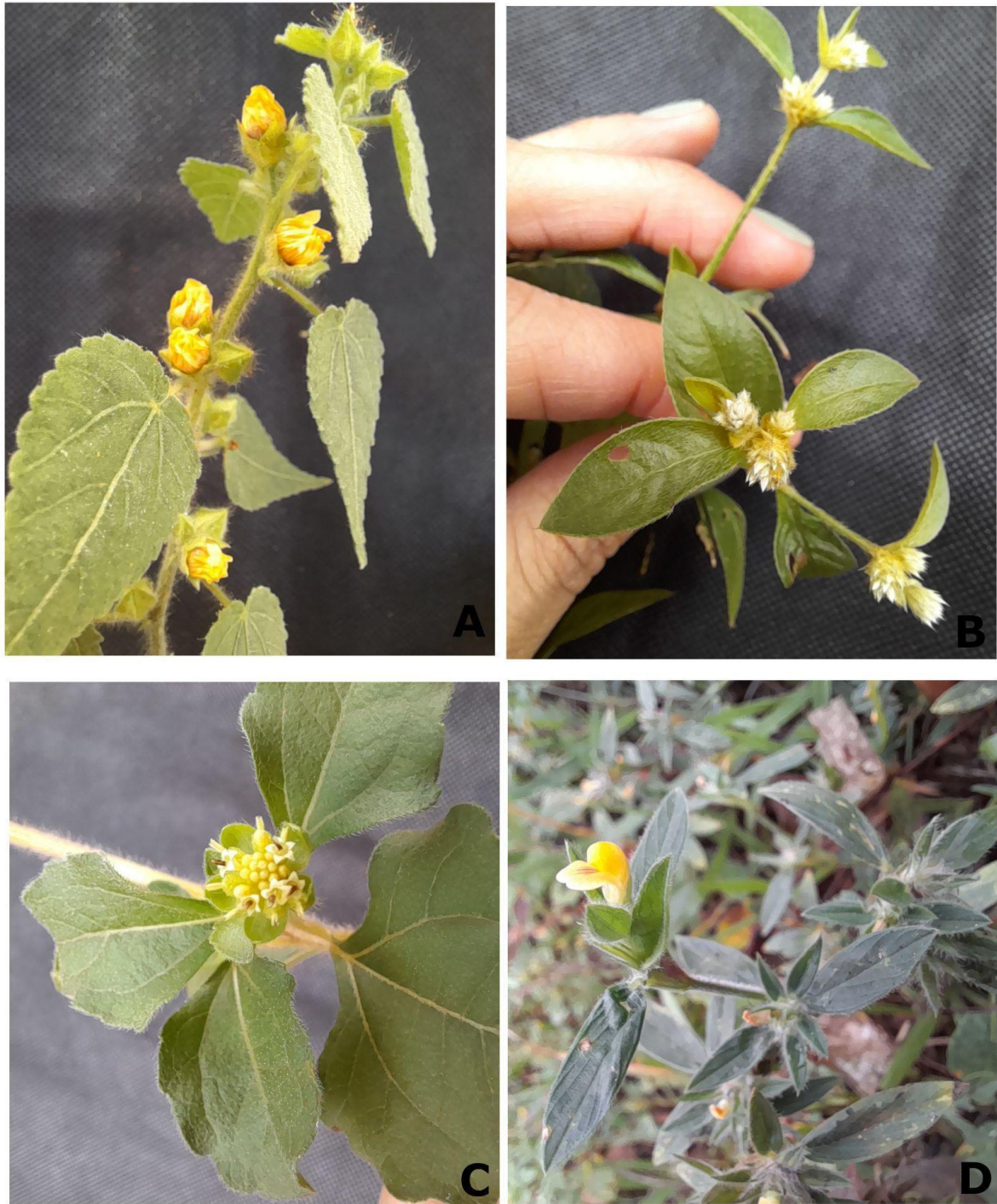
Figura 8: A: Sida urens L. (coleta 19); B: Alternanthera sessilis (L.) R. Br. Ex DC. (coleta 22); C: Acanthospermum rispidum (Loefl.) Kuntze (coleta 24); D: Stylosanthes viscosa (L.) Sw. (coleta 25). (Elaborado pela autora)