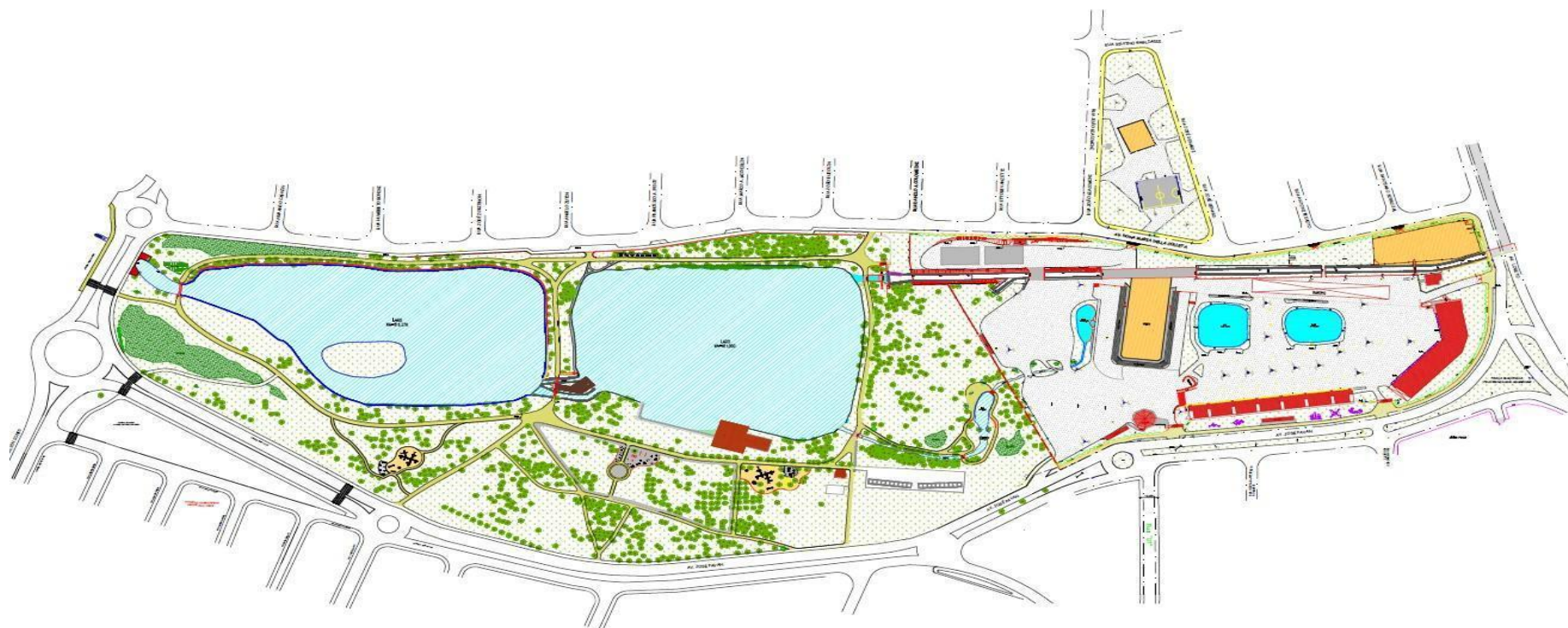
Figura 3: croqui Parque Ecológico (Secretaria de Planejamento, Gestão e Mobilidade do Município de Araras)