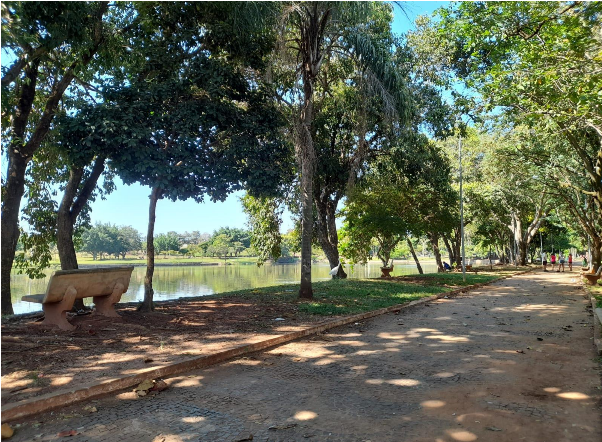
Figura 1: Vista do Parque

Considerando que estudos e publicações referentes são determinantes para um retorno e interesse social e administrativo por parte da administração pública, possibilitando o desenvolvimento de mudanças, ampliações, benfeitorias para melhor aproveitamento da população, ressaltamos, novamente, a importância deste estudo.