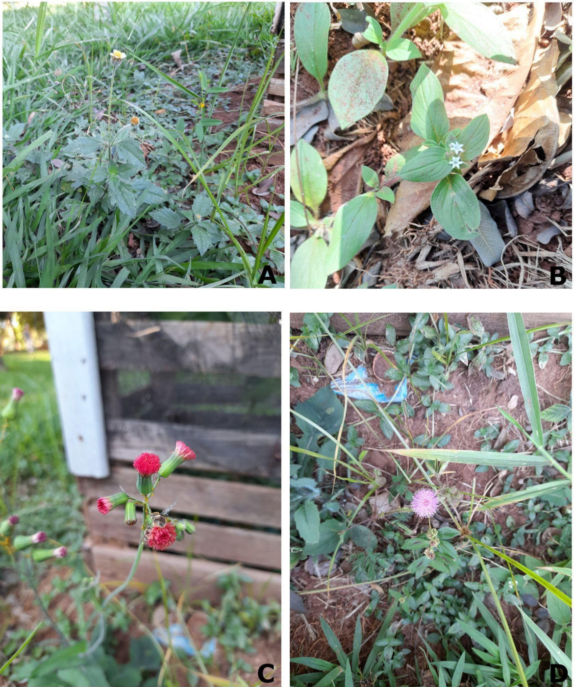
Figura 6. A: Tridax procumbens L. (coleta 1); B: Richardia brasiliensis Gomes (coleta 8); C: Emilia fosbergii Nicolson (coleta 2); D: Mimosa pudica L. (coleta 3). (Elaborado pela autora)