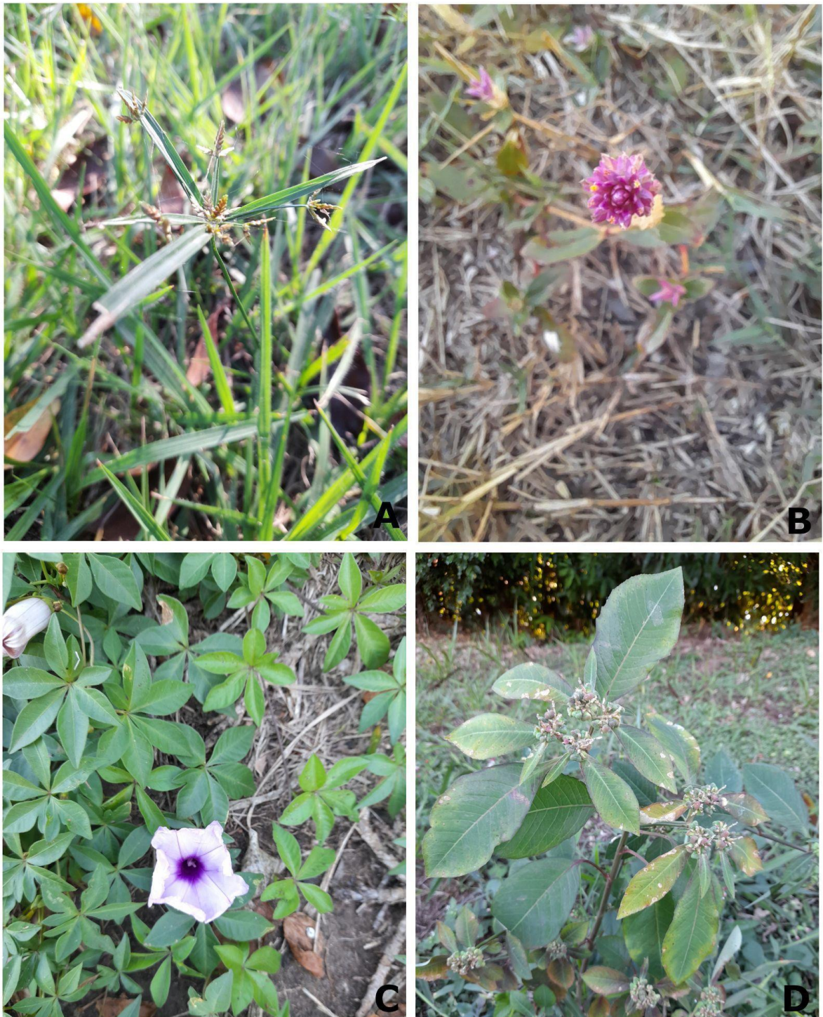
Figura 9. A: Cyperus sp. (coleta 27); B: Gomphrena globosa L. (coleta 29); C: Ipomoea cairica L. (coleta 32); D: Euphorbia heterophylla L. (coleta 33). (Elaborado pela autora)

Associado ao trabalho de levantamento florístico, também foi observado o alto potencial da área explorada ser utilizada como um espaço de educação ambiental. Ensino e aprendizagem de botânica, nesses locais, proporcionam a contextualização do cotidiano, que somente o livro didático não pode oferecer, ou seja, possibilita