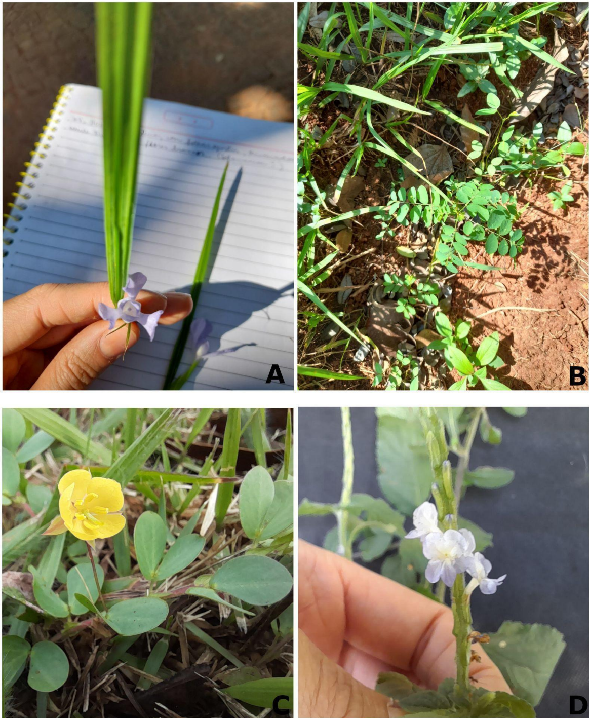
Figura 7: A: Cipura paludosa Aubl. (coleta 9); B: Moeroris tenella (Roxb.) R.W. Bouman (coleta 10); C: Chamaecrista rotundifolia (Pers.) Greene (coleta 11); D: Stachytarpheta cayennensis (Rich.) Vahl. (coleta 16). (Elaborado pela autora)