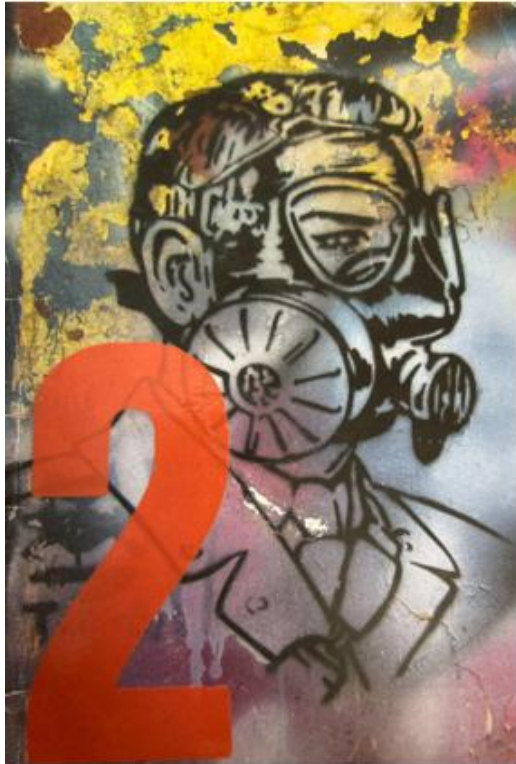
Figura 1: Artivismo