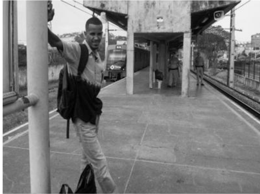
Imagem 2: Marreteiros, cotidiano