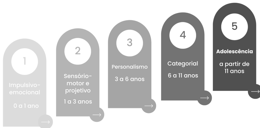
Imagem 1-Estágios do desenvolvimento.

Segundo Wallon (1999), o desenvolvimento infantil ocorre em estágios, se as crianças dos anos iniciais, geralmente entre 6 e 11 anos, encontram-se no estágio categorial.