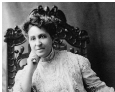
Figura 14 - Mary Church Terrell (1863 – 1954)