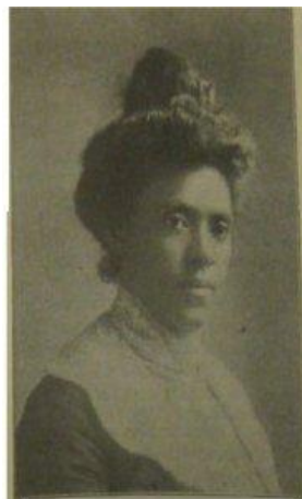
Figura 10 - Addie Waites Hunton.

Na imagem, uma das indicações seria de Mrs. Hunton , Addie Waites Hunton, que foi peça fundamental para a realização do Congresso de 1927, em Nova Iorque. Addie, na figura 10, nasceu em Norfolk, cidade da Virgínia, nos Estados Unidos, em 1870, e iniciou sua vida como professora.