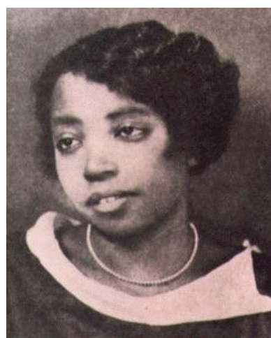
Figura 19 – Marita Odette Bonner (1899-1971)

Alain LeRoy Locke reuniu, em um livro denominado The New Negro (1925), pensadores negros para refletirem sobre uma nova forma de afirmação da população negra nos Estados Unidos.