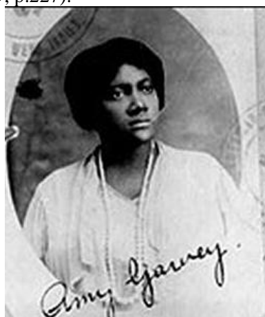
Figura 17 Amy Ashwood Garvey (1887 – 1969) 30

C.L.R. James e Amy Garvey souberam captar os movimentos anticoloniais e anti-imperiais da diáspora, coordená-los e canalizá-los em apoio à Etiópia. A integridade e independência da Abissínia significavam muito em um momento em que se disputava a soberania sobre o continente africano e a luta por liberdade do jugo colonial. O ataque à Etiópia consolidou o que já vinha se desenhando no interior do pensamento radical negro, que o imperialismo operava uma guerra racial contra os negros. A Abissínia torna-se, desta maneira, a causa primordial de todos os negros dispersos na diáspora. Esta percepção por parte de James e daqueles que formaram o International African Friends of Ethiopia deve ser vista enquanto algo central na consolidação do continente africano enquanto território a ser disputado politicamente, mas também num território fundamental do ponto de vista epistemológico. Se antes os ativistas caribenhos na Grã-Bretanha lutavam mais intensamente pelo autogoverno e pela formação de uma federação no Caribe e não pela libertação do continente africano, com o ataque à Etiópia e as iniciativas coordenadas de Londres, este cenário se modifica. (Mattos, 2019, p.227).