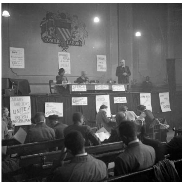
Figura 16 - Congresso Pan-Africano de 1945, Manchester.

Além dos homens representantes nesse Congresso havia também mulheres e dentre elas, Amy Ashwood Garvey como podemos ver sentada ao lado de Du Bois, na figura abaixo.