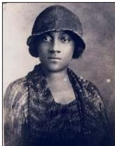
Figura 31- Amy Ashwood Garvey (1897 – 1969)

Em relação a busca pelo nome Amy Ashwood Garvey 138 o mesmo acervo forneceu 8 cartas digitalizadas em seu nome ou que a citava diretamente.