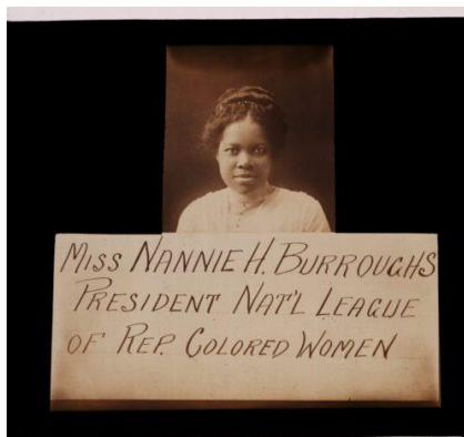
Figura 22 - Nannie Helen Burroughs (1879 – 1961)

A carta de Nannie H. Burroughs 44 , na figura abaixo, uma carta endereçada a Addie Waites Hunton, datada de 20 de outubro de 1923, mencionava o envio de uma representante da National Association of Colored Women ao 3º Congresso Pan-Africano. Na correspondência, foi indicada a colaboração de Burroughs com Addie para garantir a participação de mulheres negras norte-americanas nesse Congresso.