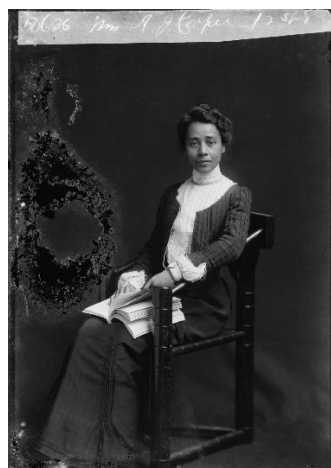
Figura 15 - Anna Julia Cooper (1858-1964)

Já no Congresso de 1923, proferiu a palestra intitulada “ The Coloured Races and the League of Nations ”.