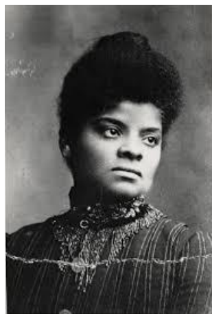
Figura 34 - Ida Bell Wells-Barnett (1862-1931)