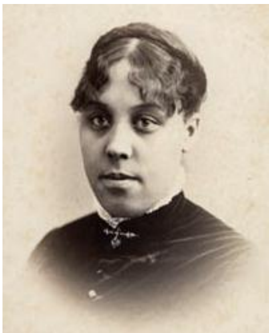
Figure 13 - Ida Alexander Gibbs Hunt (1862 – 1957) 24

Ida Alexander Gibbs Hunt (figura 13) 23 , lutou em defesa da igualdade racial e de gênero, de acordo com Alexander (2010) ela fazia parte da aristocracia afro-americana e seu pai trabalhou como advogado com Frederick Douglass.