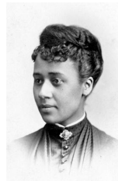
Figura 3 - Anna Julia Cooper (1858-1964)