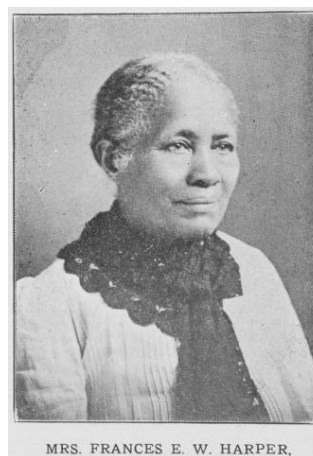
Figura 33 - Frances E. W. Harper (1825-1911)