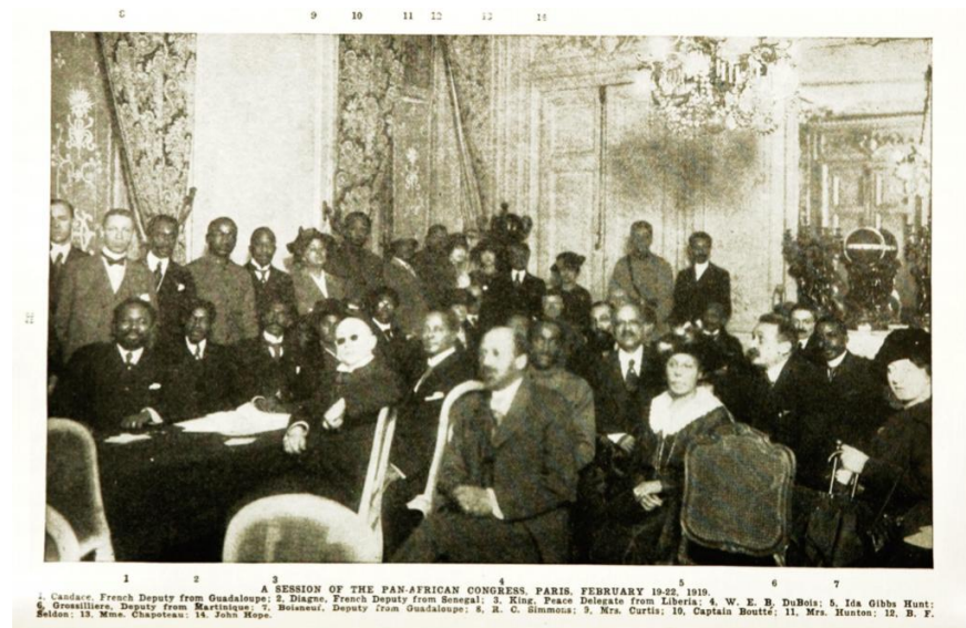
Figura 9 - I Congresso Pan-Africano, Paris, 1919.

Na figura 9, que mostra os participantes do I Congresso Pan-Africano, realizado em Paris, em 1919, é possível observar as mulheres indicadas também como representantes. 12