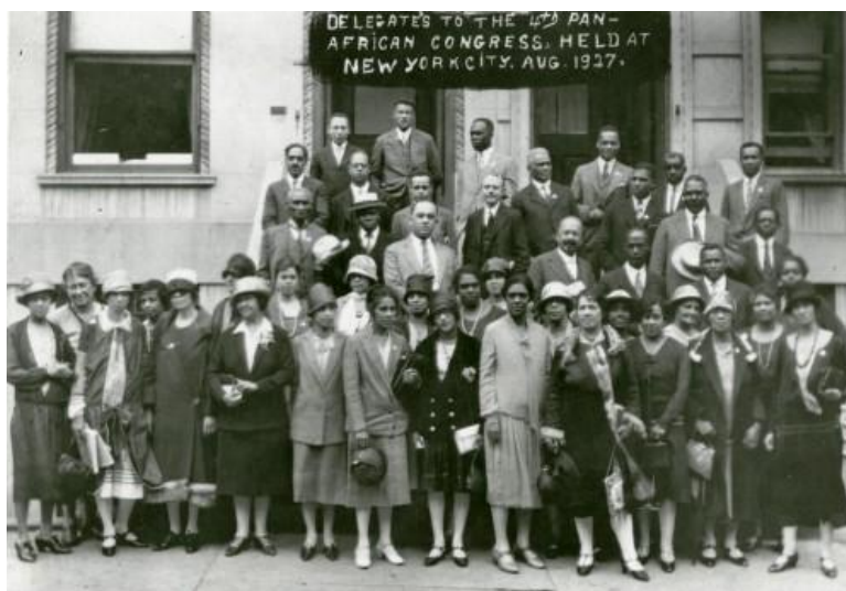
Figura 12 - Representantes do 4º Congresso Pan-Africano, Nova York, 1927.

Com isso, Du Bois sugeriu que seria vantajoso realizar o Congresso nas Américas ressaltando que os afro-americanos eram um grupo intelectualmente “avançado” dos descendentes africanos, mas que ele acreditava que havia outros grupos de intelectuais negros em outras partes do mundo. Assim, ele propôs a Addie o financiamento por parte da Circle for peace and foreign relations descrevendo os custos ao final desta carta.