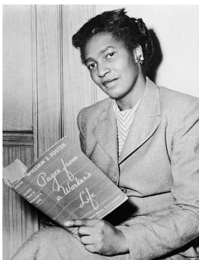
Figura 20 - Claudia Jones, New York City, 1948.

Claudia Jones foi uma teórica comunista negra que conectou as lutas locais de negros e mulheres contra o racismo e o sexismo às lutas internacionais contra o colonialismo e o imperialismo. Em seus escritos, como American Imperialism and the British West Indies , ela examinou o imperialismo americano e sua relação com as potências coloniais.