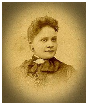
Figura 7 - Fanny Barrier Williams (1855-1944)