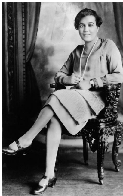
Figura 25 - Jessie Redmon Fauset (1882 – 1961)

A carta 55 de Addie Waites Hunton para W. E. B. Du Bois, datada de 6 de agosto de 1925, tratava de nomes de participantes ou apoiadores importantes para as discussões que Du Bois estava promovendo sobre o 3º Congresso Pan-Africano.