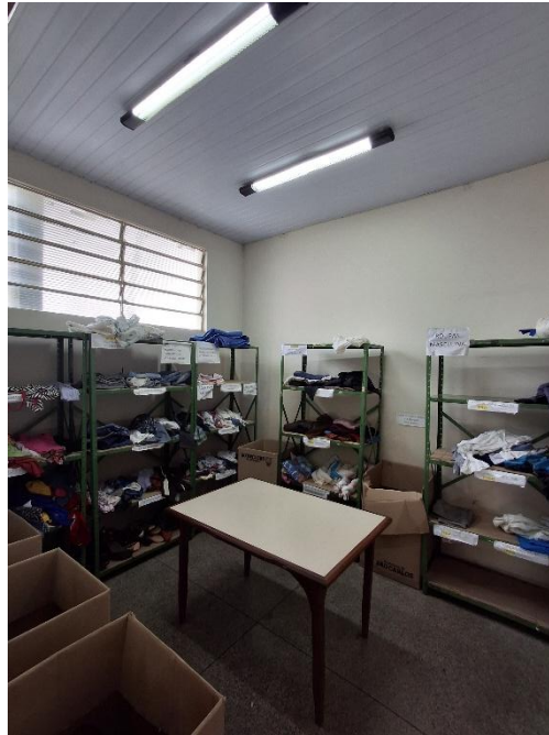
Figura 9 - Interior da sala de doações.