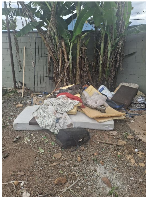
Figura 13 - Volumosos no Eco ponto São Carlos VIII com alguns materiais têxteis no dia 18/02/2026.

Ao chegar no penúltimo local, o Eco ponto São Carlos VIII se mostrou ser o mais bagunçado de todos, indo contra todos os outros locais que eram bem limpos e organizados. Lá o funcionário Ronaldo informou que eles não pegam mais roupas, até pegavam no passado, mas a empresa pediu para pararem de receber porque estava acumulando muita roupa, e como a demanda é alta a empresa não consegue dar conta de descartar tudo. De acordo com Ronaldo, o máximo que pegam são materiais têxteis grandes ou peças que vêm junto com estofados como lençóis, por exemplo, e um sapato ou outro para serem descartados junto com os volumosos (Figura 13).