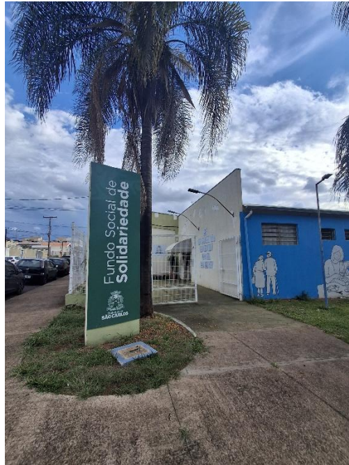
Figura 1 - Fundo Social de Solidariedade de São Carlos.