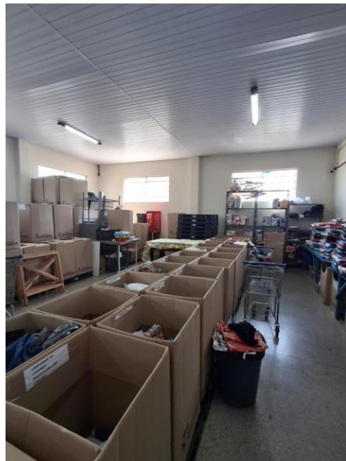
Figura 4 - Montagem das caixas de roupas para o bazar itinerante.