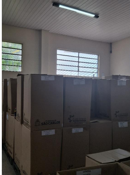
Figura 5 - Caixas de roupa fechadas e etiquetadas para o bazar itinerante.