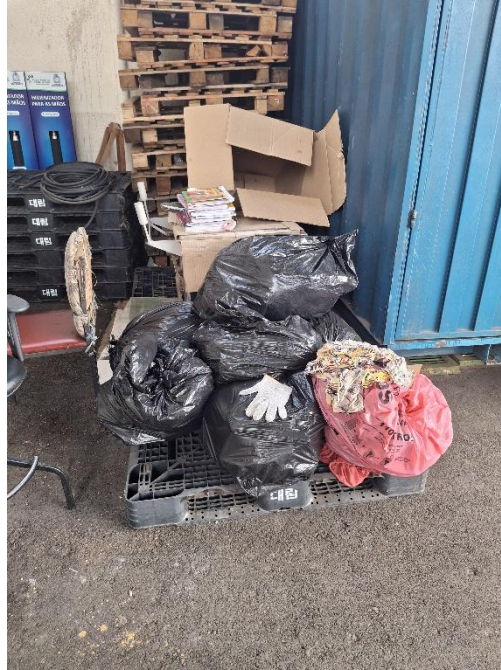
Figura 11 - Sacos de roupas para descarte acumulando no Fundo Social.