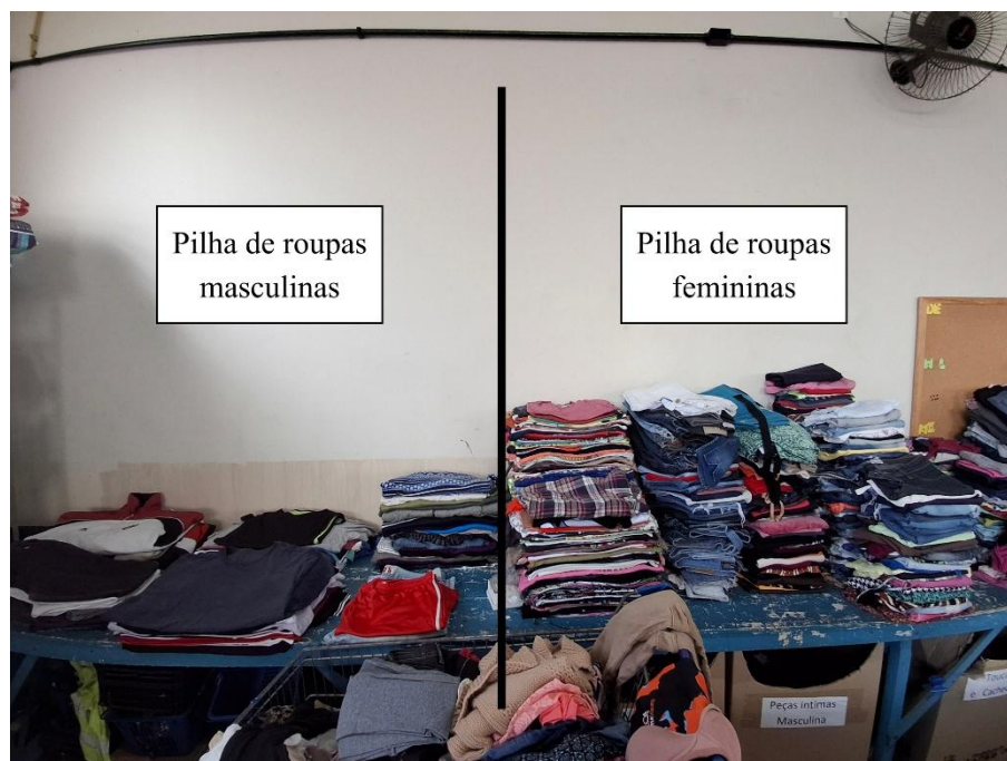
Figura 10 - Diferença das quantidades entre roupas femininas e masculinas no estoque.