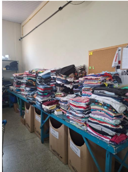
Figura 3 - Mesa de estoque de roupas para a sala de doações.