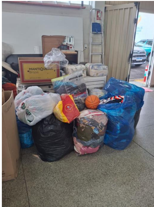
Figura 2 - Sacolas de doações arrecadadas.