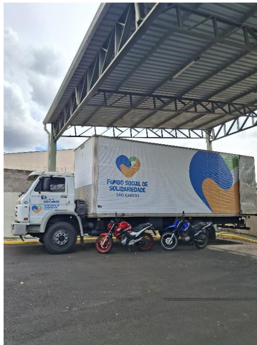
Figura 7 - Caminhão do Fundo Social de Solidariedade.

do material é feito pelo caminhão do próprio Fundo Social (Figura 7). No local, as roupas são dispostas em mesas para a escolha pelos beneficiários. O acesso é organizado por meio de fila, com os participantes sendo liberados em grupos. Cada grupo tem até 10 minutos para selecionar as peças que desejam, dando lugar ao grupo seguinte no final do prazo. Após o atendimento de toda a fila, é permitido que as pessoas revisitem as mesas para uma nova escolha, caso haja peças remanescentes. Os bazares itinerantes duram o dia todo, e apesar de mobilizar quase toda a equipe do Fundo Social de São Carlos, a sede e a sala de doações continuam funcionando normalmente.