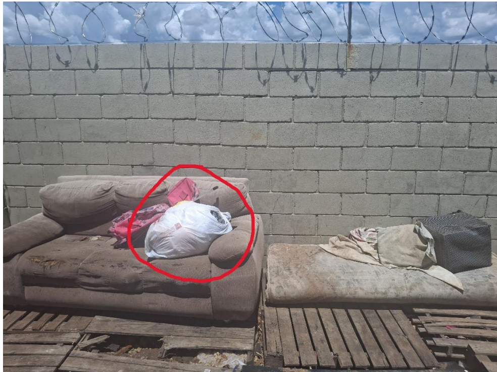
Figura 12 - Volumosos no Ecoponto Vida Nova São Carlos com um saco de roupas no dia 18/02/2026.