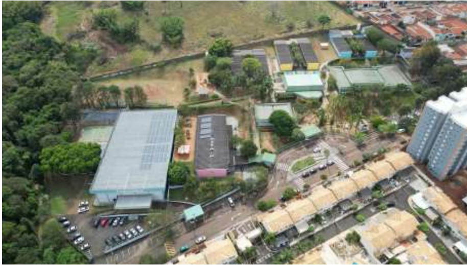
Figura 1 – imagem aérea que mostra todo o espaço da escola tratada no projeto.