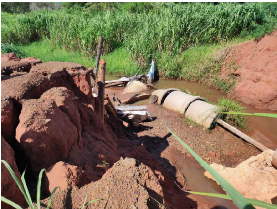
Figura 2 - Foto em Detalhe de Sulcos de Erosão (Voçorocas) em uma Lavoura