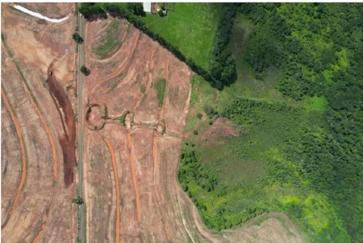
Figura 4 - Foto Aérea/Vista Geral que mostra o Rio Assoreado e o Contraste entre Áreas de Mata Ciliar Preservada e Áreas de Uso Intenso