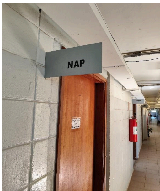
Figura 3 - Placa indicando a sala do NAP

● NAP (Núcleo de administração de pessoa): Conforme estabelecido no Decreto nº 52.833, de 24 de março de 2008, no NAP (Figura 3) os funcionários possuem atribuições específicas, incluindo as funções previstas nos artigos 16, 17 e 19, incisos III a VII e IX a XIII, excetuando-se o disposto no inciso VI do referido decreto. Entre suas responsabilidades, destacam-se o acompanhamento do processo de atribuição de classes e aulas, com as devidas complementações, e a análise do absenteísmo nas unidades escolares, propondo medidas corretivas. Sendo assim, cabe a esse núcleo o controle das rotinas de administração de pessoal, a solicitação do preenchimento de vagas existentes e a requisição de avaliações médico-periciais em casos de readaptação ou aposentadoria por invalidez, bem como o acompanhamento e controle dos processos de readaptação de servidores. É no NAP que muitas dúvidas sobre o processo de atribuição, SED (Secretaria Escolar Digital), etc, são sanadas.