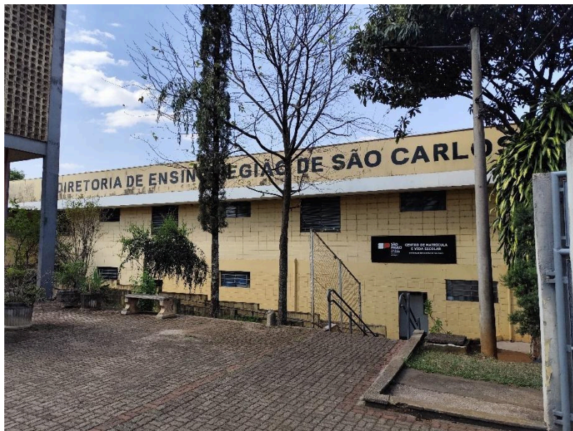
Figura 2 - Diretoria de Ensino no município de São Carlos/SP

A diretoria de ensino é responsável por oferecer recursos para garantir a organização escolar, além de monitorar as unidades escolares e seu funcionamento. Na Figura 2 abaixo tem-se a fachada da Diretoria de Ensino no município de São Carlos.