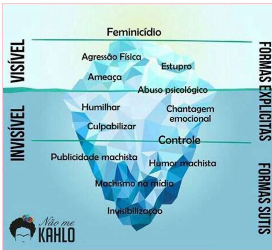
Figura 3 - Iceberg da violência de gênero

(Fonte: Coletivo não me Kahlo, citado por Stevens et al., 2017)