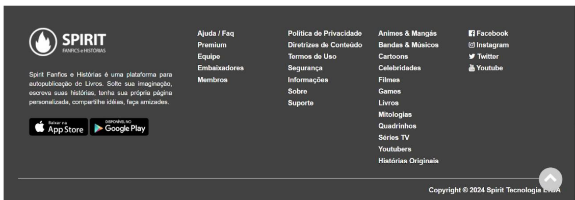
Figura 6 – Menu de rodapé do Spirit