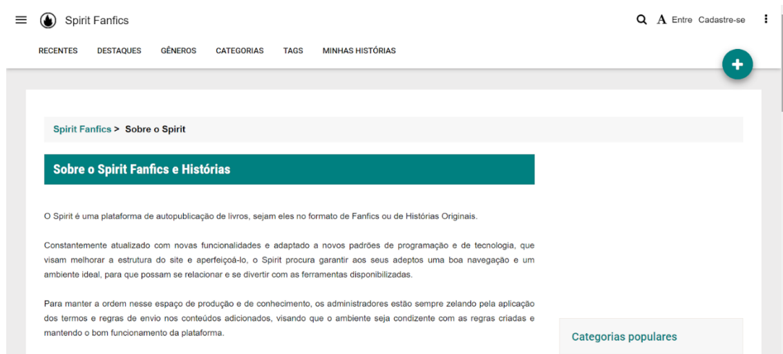
Figura 7 – Segundo menu principal do Spirit