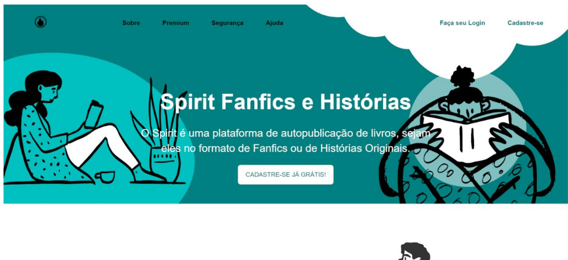
Figura 5 – Página inicial do Spirit