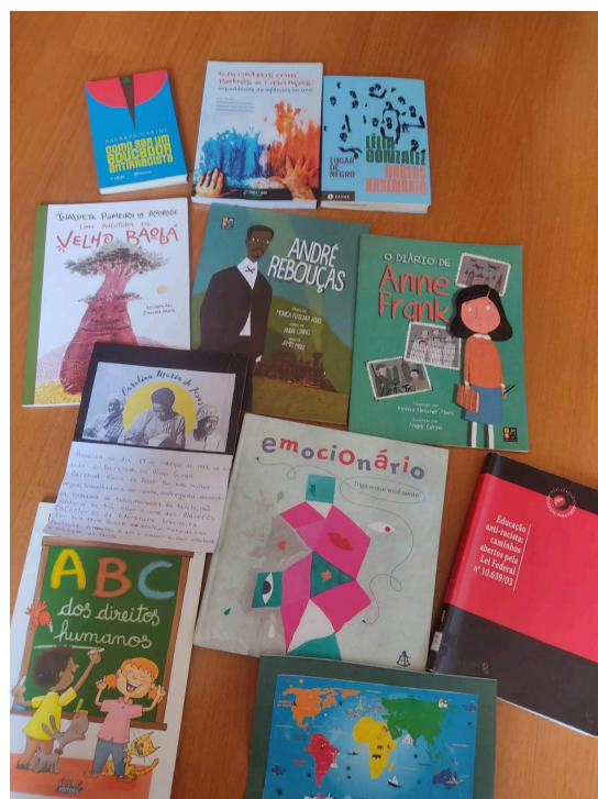
Legenda: A figura 3 mostra alguns dos materiais que guiam meus estudos e ideias de aplicação de atividades na sala de aula durante a experiência do Pibid.