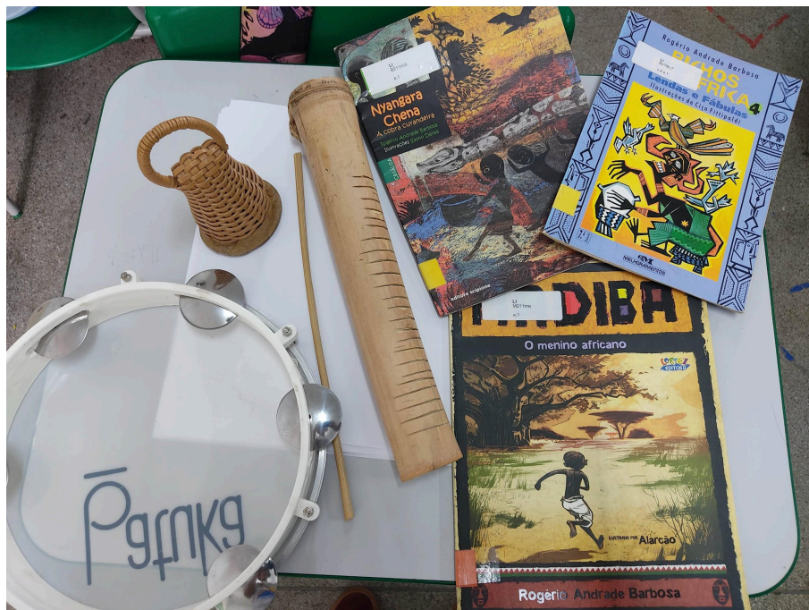
A figura 5 registra alguns dos materiais utilizados durante a aula sobre contos africanos, como o pandeiro, o reco-reco, o caxixi e 3 literaturas já mencionadas acima.