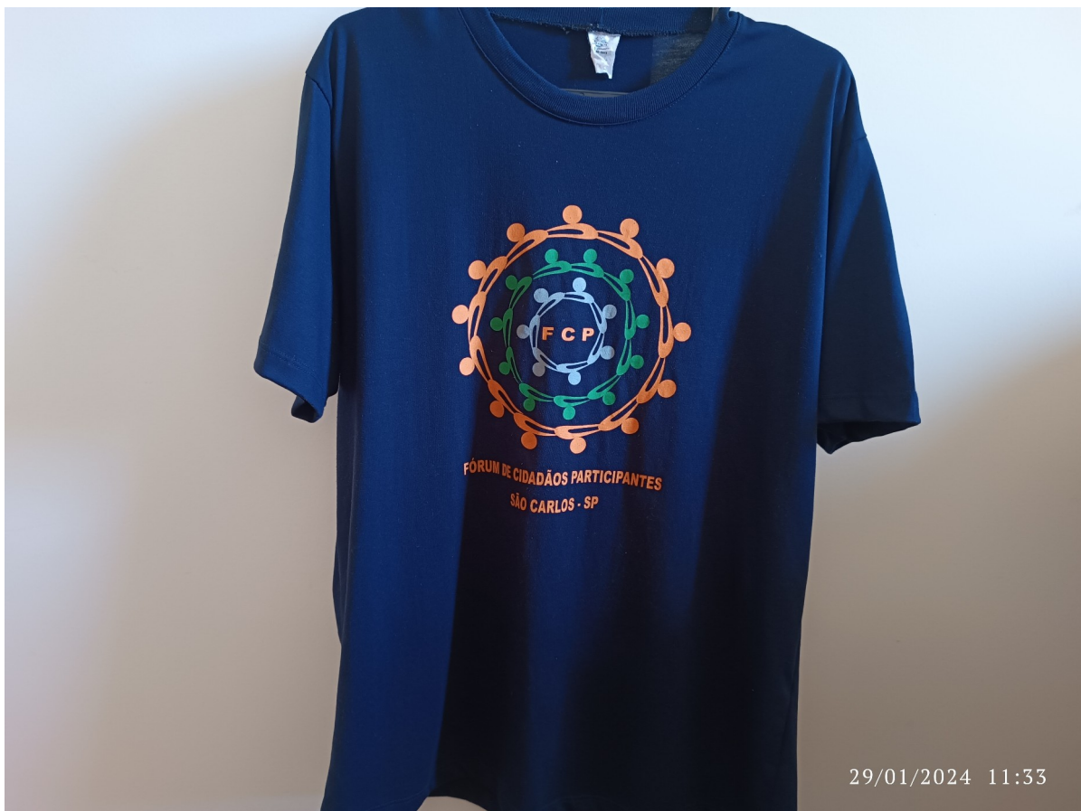
Fig. 1: Primeira versão da camiseta do FCP distribuída aos membros.

Por muitas reuniões após a primeira distribuição, pessoas ainda apareciam presencialmente para dizer que gostariam muito de conseguir uma camiseta para si, lamentando ter perdido a oportunidade anterior de retirada, demonstrando que recompensas materiais são relevantes motivadores (Bezerra; Gouveia Junior; Cavalcante, 2022). Felizmente, todas as interessadas tiveram sua chance, e as camisetas foram distribuídas a todo mundo minimamente engajado nas atividades presenciais. O uniforme motivava as pessoas, demonstravam animação frente ao seu recebimento e se orgulhavam de portar aquele logo (Figura 2). Em uma reunião interna preparativa para o encontro com o SAAE anteriormente mencionado, uma líder expressou que é importante a gente ir todo mundo com a camiseta do FCP pra mostrar resultado . Inclusive, neste encontro o servidor responsável por recepcionar, ao avistar os membros reunidos na sala de espera, leu as camisetas em voz alta, perguntando Fórum de Cidadãos Participantes, é isso? É um movimento? .