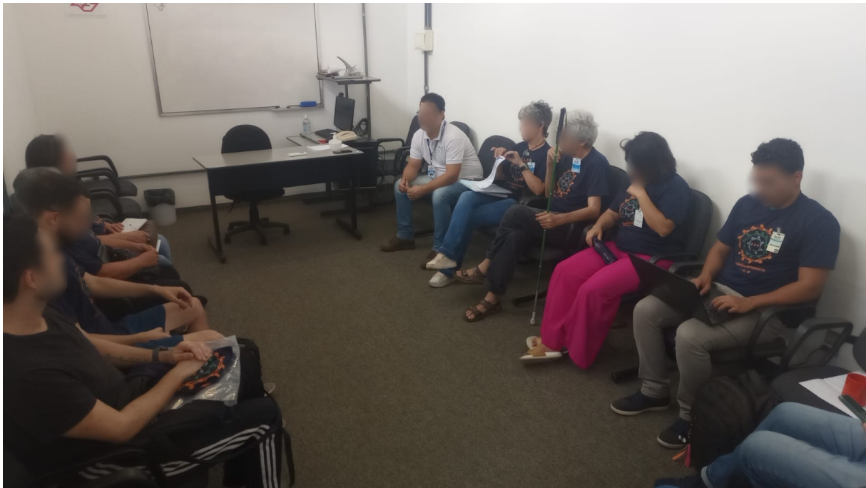
Fig. 4: Reunião com representante do SAAE (de camisa branca) nas dependências de um prédio administrativo da autarquia.

Além disso, a visibilidade formal e informal vincula-se ao fator motivador Inspiração. Com este fator, representa-se especificamente o desejo de que as ações do FCP inspirem outras pessoas a tomar iniciativa frente às questões locais. A visibilidade fomenta este desejo, e perceber que este objetivo foi alcançado atua como fator motivador. E ele pode ser alcançado, em escala local. Durante o já referido mutirão, um senhor que passava pelo local fez questão de interagir com os participantes e elogiá-los para dizer que a iniciativa o havia comovido e que possivelmente inspiraria outros, talvez ovens que ficam pensando besteira .