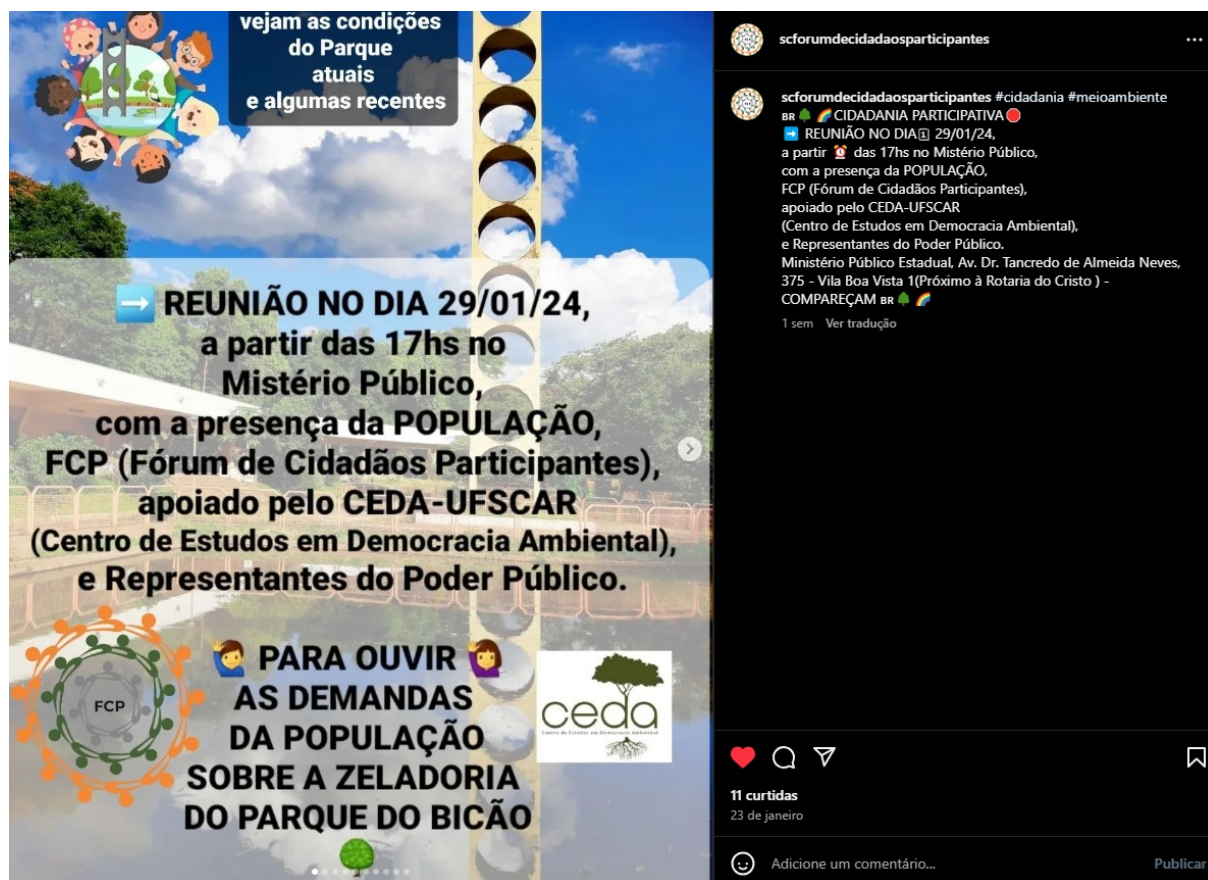
Fig. 3: Divulgação de audiência pública postada no instagram do FCP.

costumam divulgar suas atividades, convites a mobilizações e a participação em audiências (Figura 3).