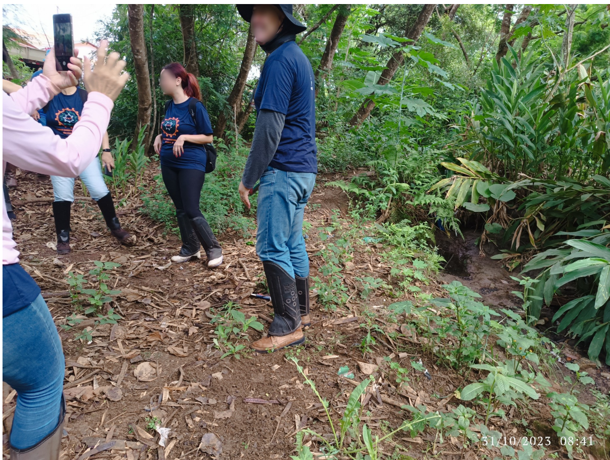
Fig. 2: Visita a áreas de obras hidráulicas para diagnóstico ambiental participativo.

Por conta disto, a cultura organizacional é potencializador do senso de Pertencimento, outro fator motivador (Freitas; Spiegel, 2022). Sentir-se acolhido pelo grupo, poder dizer que faz parte dele e afirmar com orgulho que por meio dele se desenvolve trabalho de impacto social e político parecia um sentimento compartilhado por muitas participantes. Normalmente, este sentimento vinha à tona em discursos das figuras de liderança quando do encerramento de atividades presenciais, em especial ações como o mutirão de limpeza ou confraternizações para comemoração de resultados. Ao final da confraternização de comemoração de um ano do FCP, as principais figuras de liderança do grupo fizeram discursos para expressar suas satisfações com os resultados, afirmando ser muito importante fazer parte de algo que tá dando certo e que empodera o povo .