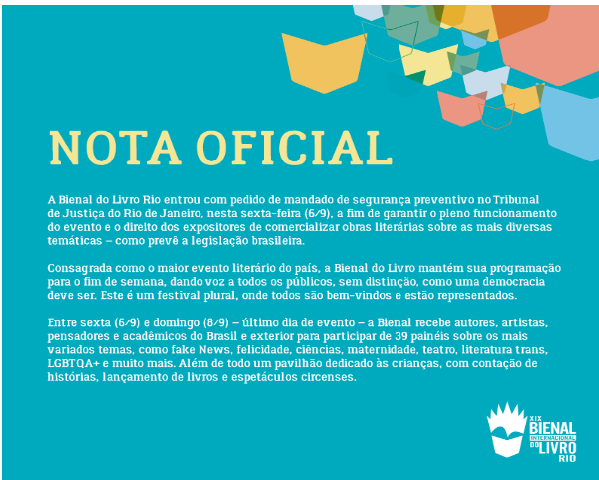
Imagem 1 - Nota da Bienal do Livro em resposta à prefeitura do Rio de Janeiro em Setembro de 2019.