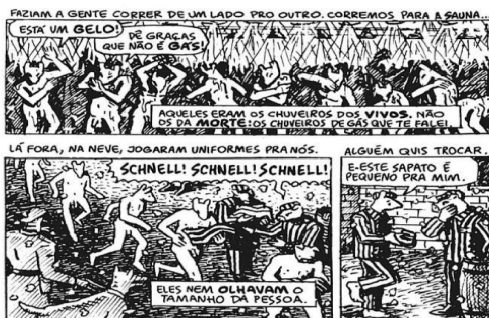
Imagem 2 - Trecho da obra Maus contendo nudez explícita e utilizada como justificativa da censura. Fonte: Maus, de Art Spiegelman.

empregada pelo autor foi no uso gráfico dos quadrinhos. Dentro da obra, cada grupo étnico é representado por um diferente animal, por exemplo: personagens de origem polonesa eram representados por porcos, franceses por sapos e personagens vindos dos Estados Unidos por cães. No caso os judeus, independente de sua nacionalidade, são representados por ratos e os alemães, seus perseguidores, por gatos, animal popularmente conhecido por caçar e se alimentar de ratos. Abaixo colocamos a dita cena a fim de demonstrar a metalinguagem da obra e o contexto que ocorre a dita nudez.