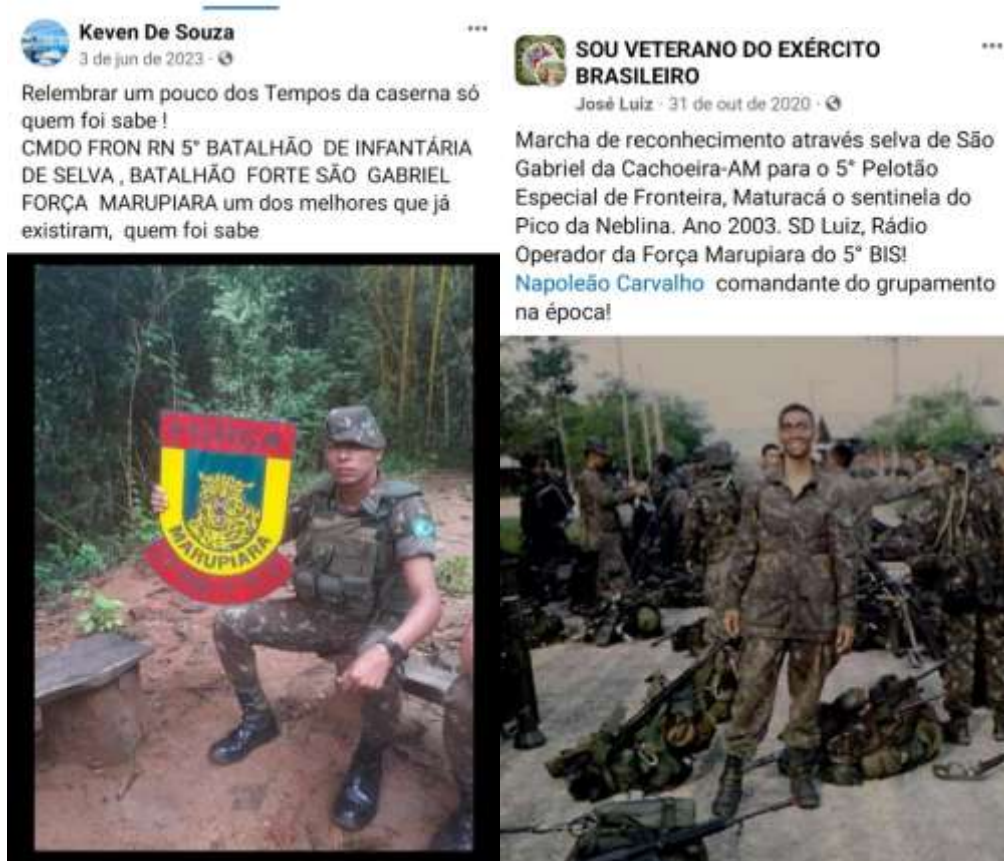
FIGURA 15 - FORÇA MARUPIARA NAS REDES SOCIAIS

similares durante o combate à Guerrilha do Araguaia, na qual se priorizava grupos militares reduzidos, precedidos por operações de inteligência e de operações psicológicas entre as populações civis da região, como destacado nas seções iniciais deste capítulo.