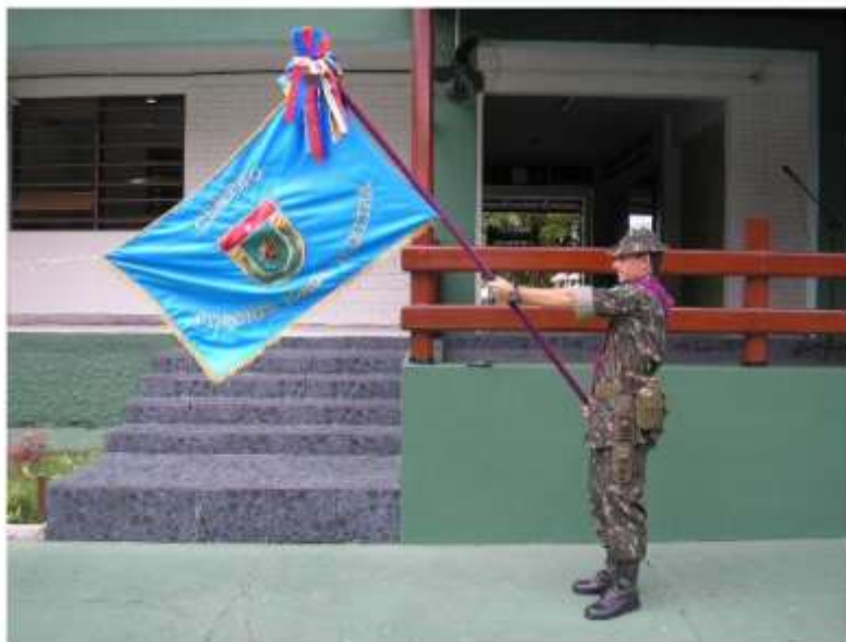
FIGURA 2 - ESTANDARTE HISTÓRICO DO CIGS 126