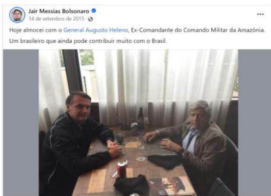
FIGURA 27 - JAIR BOLSONARO E AUGUSTO HELENO (2015)

A candidatura não veio, mas a associação com Jair Bolsonaro teve vida longa. Em 2015, o então deputado federal fez questão de apresentar o ex-comandante militar da Amazônia aos seus seguidores nas redes sociais.