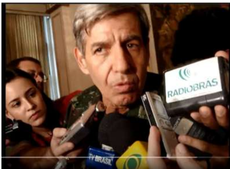
FIGURA 21 GENERAL HELENO NO CLUBE MILITAR

As declarações foram feitas usando o característico uniforme camuflado do Exército Brasileiro e eram acompanhadas por jornalistas que cobriam a cerimônia e que entrevistaram o general após a palestra.