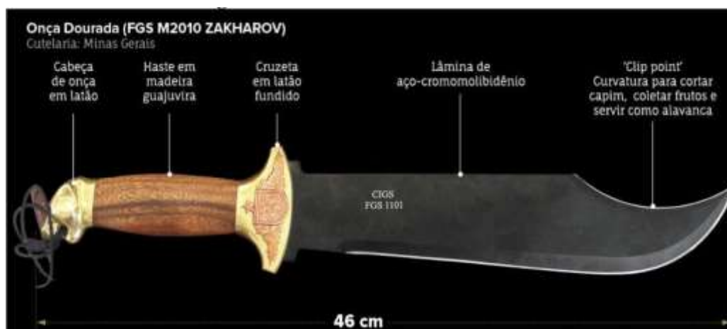
FIGURA 12 - FACÃO DO GUERREIRO DE SELVA