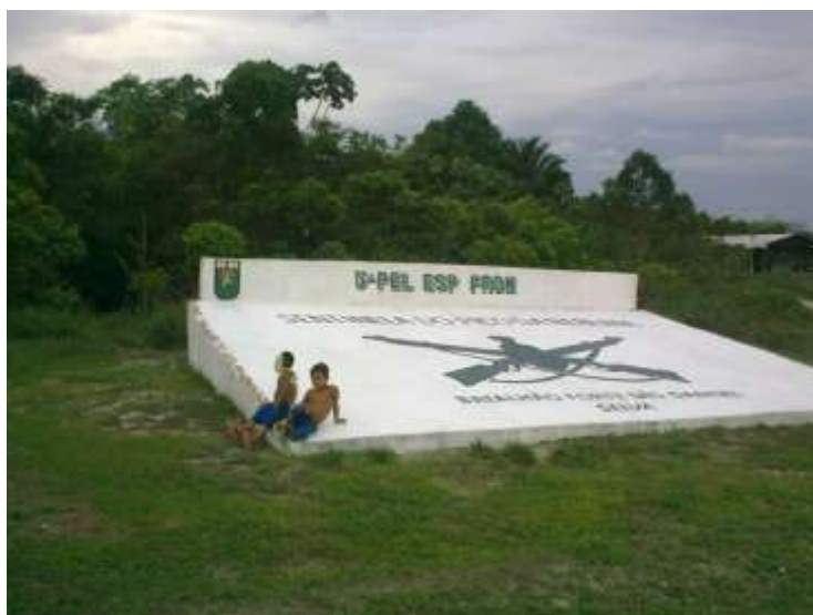
FIGURA 23 – 5º PELOTÃO ESPECIAL DE FRONTEIRA DE MATURACÁ (TERRA YANOMAMI – SÃO GABRIEL DA CACHOEIRA - AM)

Fonte: Piero Leirner (fevereiro de 2010)