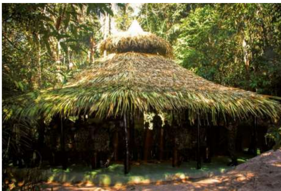
FIGURA 13 - TAPIRI DA MÍSTICA (VISÃO EXTERNA).

O piso é em cimento rústico, pintado nas cores do couro da onça pintada. É constituído, ainda, de uma passarela de alvenaria, assentada com pedras rústicas da Amazônia, um trapiche às margens do Igarapé CANDIRU e local para acendimento da fogueira no centro do dispositivo. A iluminação pode ser feita por meio de lamparinas de bambu com breu vegetal e maravalha. No suporte em frente ao assento destinado ao Coronel JORGE TEIXEIRA, é colocado o FGS Nr 0001, simbolizando a presença do Patrono do CIGS (CIGS, 2023, p. 73).