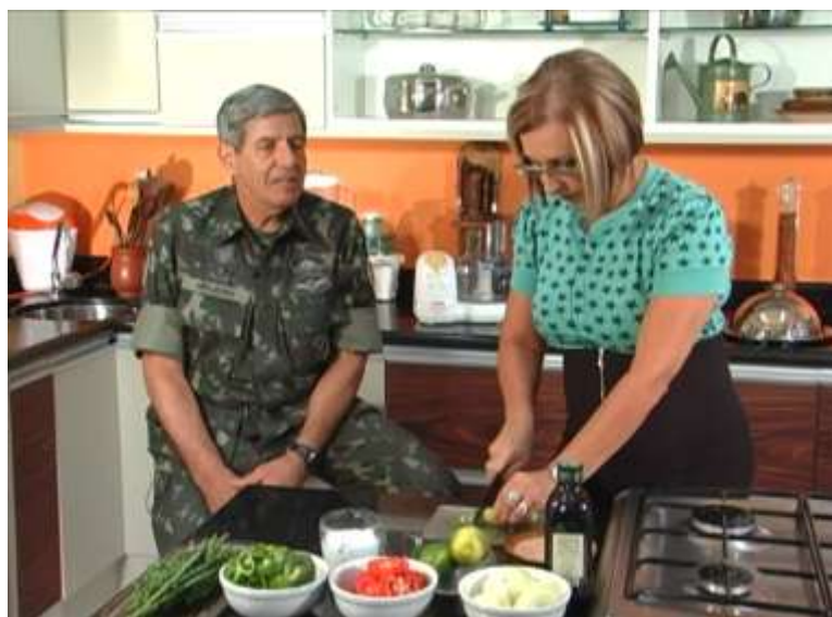
FIGURA 25 - AUGUSTO HELENO NO “PROGRAMA DA NORMA” (2008)

uma grande propulsora do nosso país. [...] A Amazônia é um bem brasileiro, nós é que vamos decidir sobre a Amazônia, ninguém tem que dar palpite na Amazônia [...]” 353 .