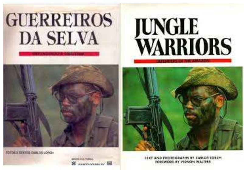
FIGURA 20 - LIVRO GUERREIROS DA SELVA COMBATENDO NA AMAZÔNIA (1992)