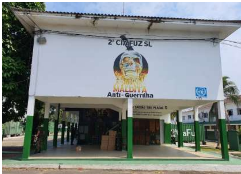
FIGURA 16 - 2ª COMPANHIA DE FUZILEIROS DE SELVA – “MALDITA”