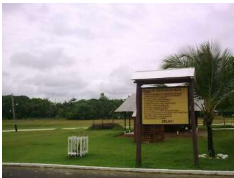
FIGURA 9 - ORAÇÃO DO GUERREIRO DE SELVA – 4º PELOTÃO ESPECIAL DE FRONTEIRA (SÃO GABRIEL DA CACHOEIRA - AM)

Fonte: Piero Leirner (fevereiro de 2010)