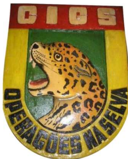
FIGURA 7 - DISTINTIVO DO CIGS (1978)