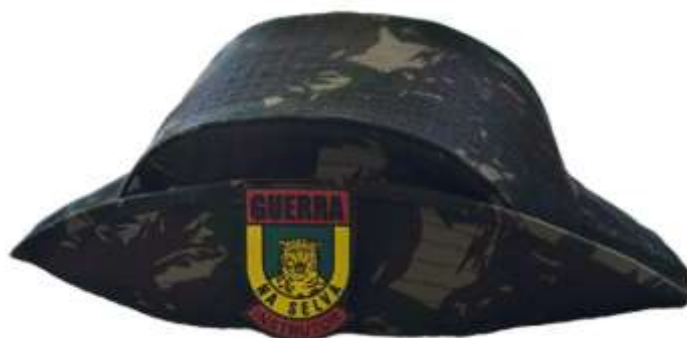
FIGURA 11 - CHAPÉU BANDEIRANTE.