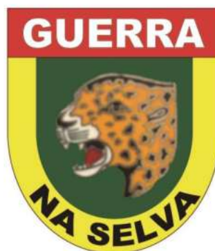
FIGURA 5 - DISTINTIVO “PIONEIRO” (1966)

Ao longo de sua história, o CIGS teve quatro versões de distintivos, os quais acompanharam as modificações sofridas pelo Centro que, como dito anteriormente, por um período também sediou o Curso de Ações de Comandos (CAC).