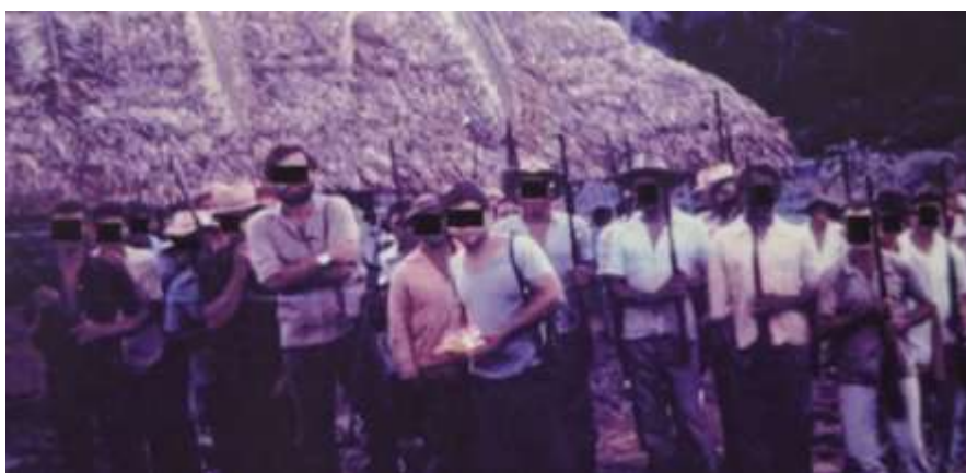
FIGURA 1 - OPERADOR DE FORÇAS ESPECIAIS E NATIVOS DE UMA EQUIPE ZEBRA NA CAMPANHA DO ARAGUAIA