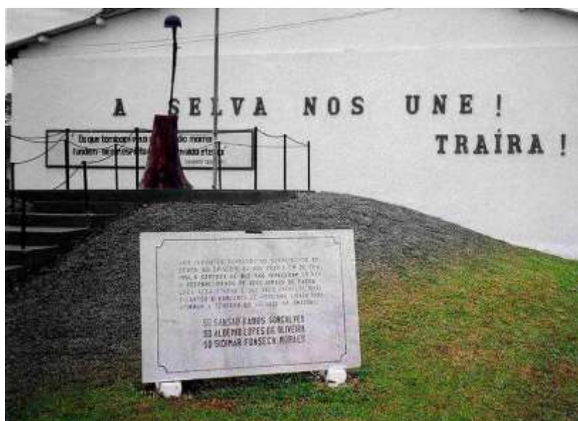
FIGURA 18 - PLACA PRESENTE NO MONUMENTO “HERÓIS DO TRAÍRA” – 3º PELOTÃO ESPECIAL DE FRONTEIRA