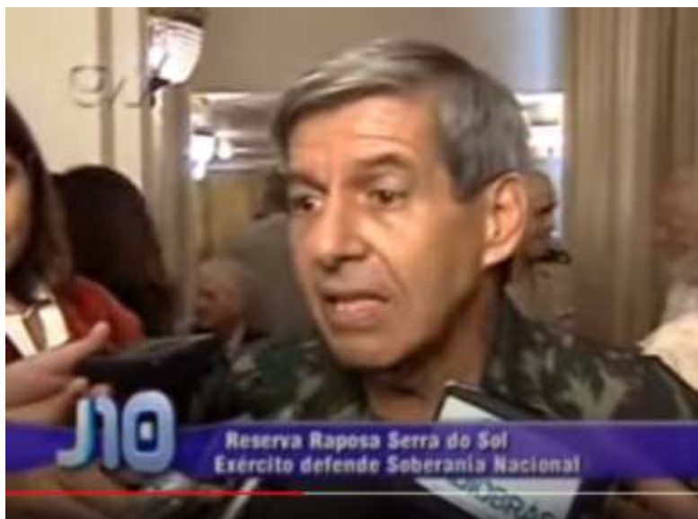
FIGURA 22 GENERAL HELENO APÓS PALESTRA NO CLUBE MILITAR