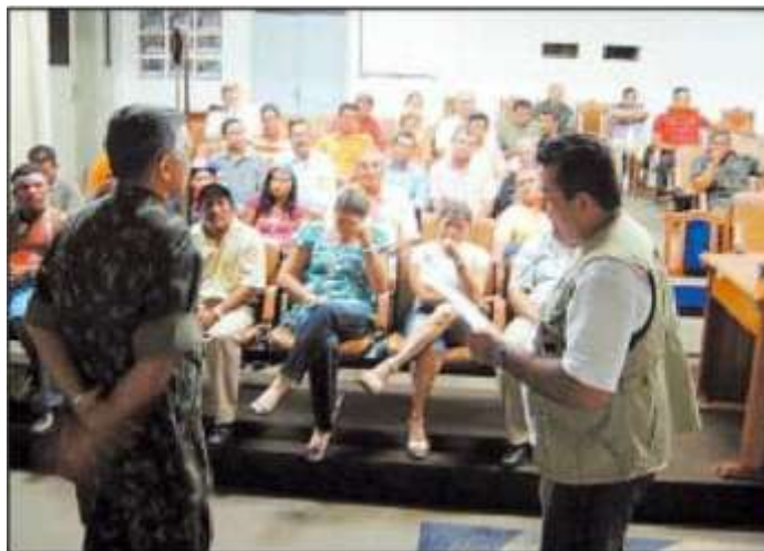
FIGURA 26 – MANIFESTAÇÃO DE ARROZEIROS NO INTERIOR DA 1ª BRIGADA DE INFANTARIA DE SELVA – BOA VISTA-RR