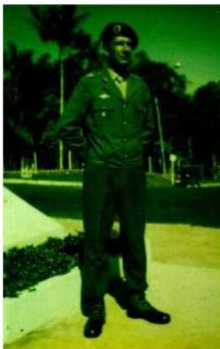
FIGURA 10 - BOINA VERDE DO CIGS.

A boina só seria aprovada mais tarde, ainda em 1969. Por alguns anos, a boina verde foi de uso exclusivo do CIGS. Quando da modificação do RUE, na administração do Ministro LEÔNIDAS, a boina verde foi adotada para todo o Exército e o CMA, dotado de boina rajada (CIGS, 2018, p. 30-31)