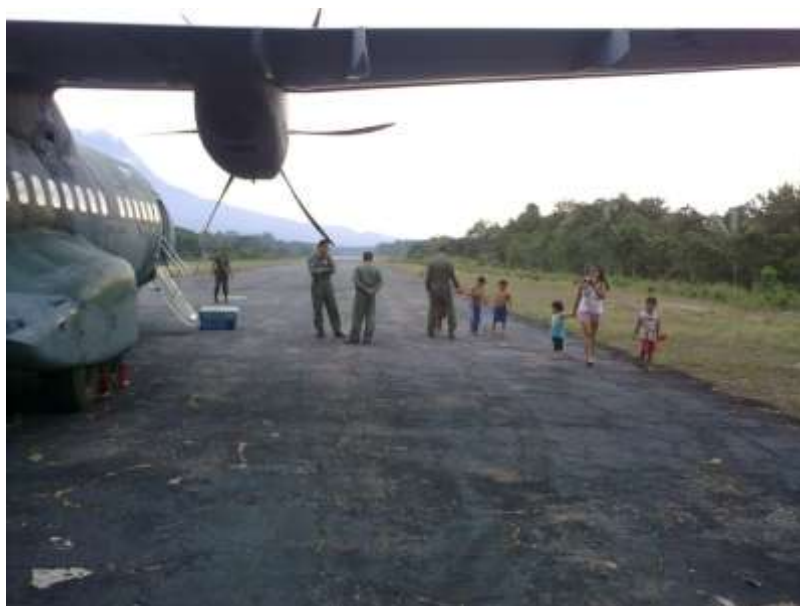
FIGURA 24 – MILITARES DA AERONÁUTICA CONVERSAM COM CRIANÇAS YANOMAMI NO 5º PELOTÃO ESPECIAL DE FRONTEIRA DE MATURACÁ (TERRA YNOMAMI – SÃO GABRIEL DA CACHOEIRA - AM)