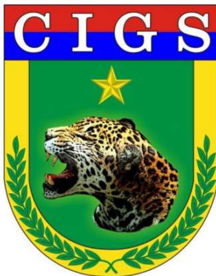
FIGURA 8 - DISTINTIVO ATUAL DO CIGS (1994)