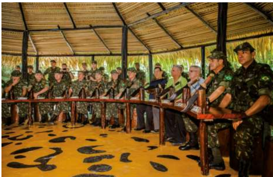
FIGURA 14 - TAPIRI DA MÍSTICA (VISÃO DA “TÁVOLA”)