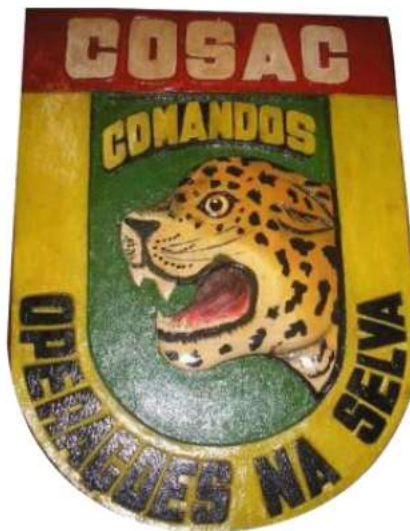
FIGURA 6 - DISTINTIVO DO COSAC (1970)