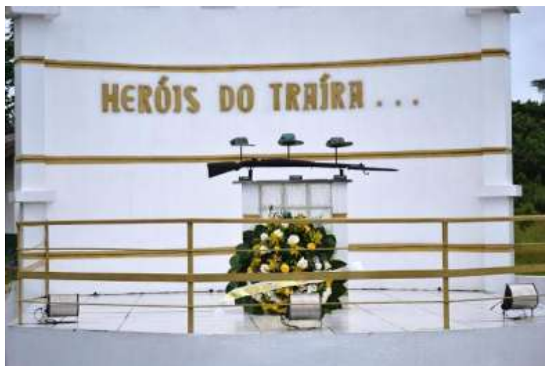
FIGURA 17 - MONUMENTO “HERÓIS DO TRAÍRA” – 3º PELOTÃO ESPECIAL DE FRONTEIRA