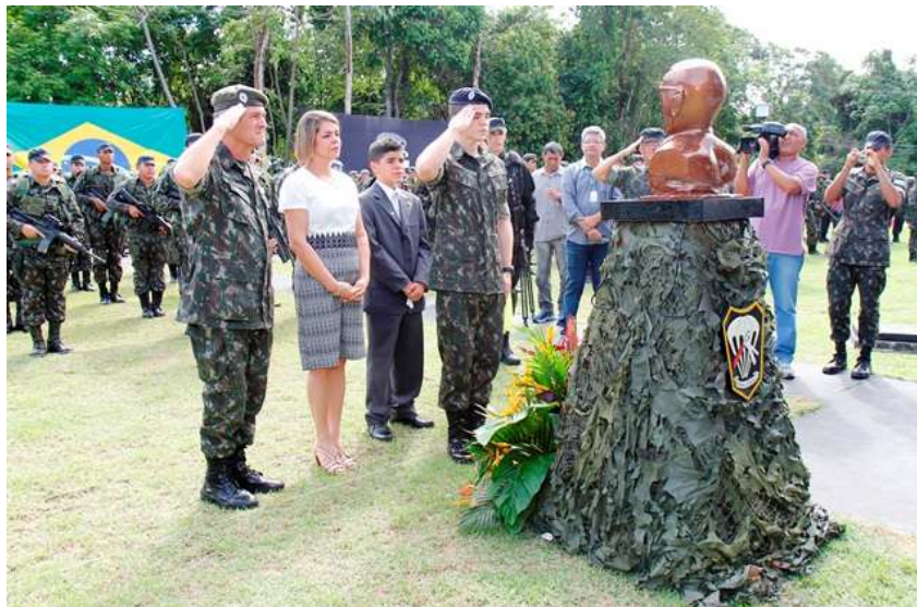
FIGURA 19 - 3ª COMPANHIA DE FORÇAS ESPECIAIS DO COMANDO MILITAR DA AMAZÔNIA – “COMPANHIA GENERAL THAUMATURGO”.