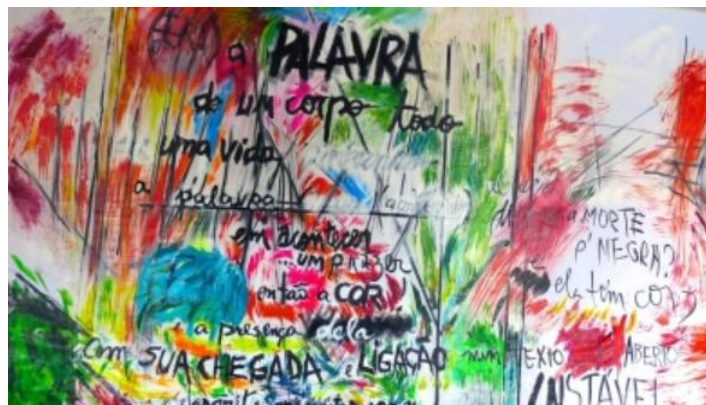
Figura 4- (AHTO, 2024)

Portanto, Mari é uma presença que, assim como interpretado pelos escritos nas cartas e em suas próprias produções, inspirou reflexões profundas sobre o cuidado com o outro e o reconhecimento de si. Sua trajetória se entrelaça com o modo como percebemos as relações humanas, ampliando a compreensão do cuidado não apenas como um gesto profissional, mas como uma prática existencial que atravessa o ser e o estar no mundo.