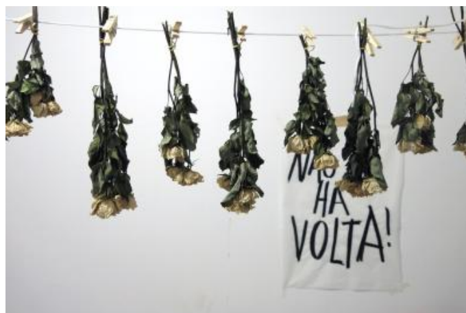
Figura 3 – (AHTO 2024)