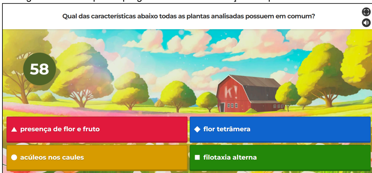
Figura 1 – Exemplo de pergunta utilizada na criação do questionário Kahoot!

de exemplo; questões subjetivas a respeito dos sentimentos e significados que a atividade trouxe aos participantes (Apêndice 5).