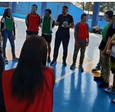
1º TEMPO ACORDO DAS REGRAS

3º Tempo: (Pós-Jogo) Após o apito final, os times se reúnem novamente. O resultado não é definido apenas pelos gols ou pontos técnicos. O grupo avalia se os acordos do 1º tempo foram cumpridos. É contabilizado as pontuações extras de cada equipe através dos pilares da metodologia: Respeito, Cooperação e Solidariedade.