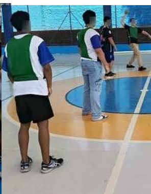
2º TEMPO JOGO